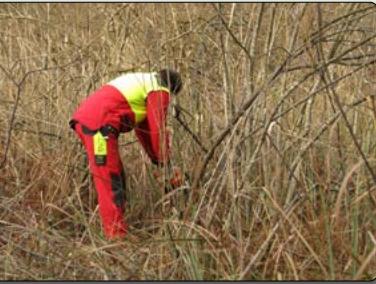
Schwenden einer Feuchtfläche