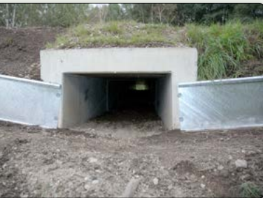
Neu eingebauter Kleintiertunnel mit Leitanlage