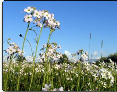
Feuchtwiese mit Wiesen-Schaumkraut