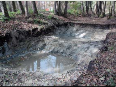
Neu angelegtes Kleingewässer