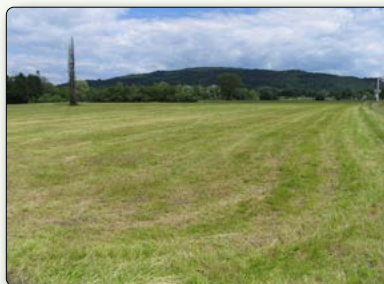
Frisch gemähte Wiese