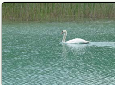
Eine „Befahrung“ weiter Teile der Wasserfläche ist nur der Tierwelt erlaubt.