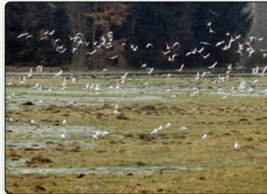
Lachmöwen auf vernässten Wiesen