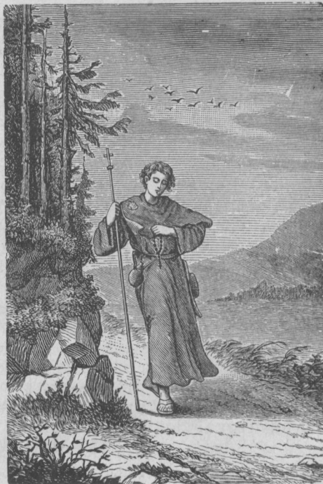
Ďaleko od hluku sveta — bližšia cesta k Bohu ...