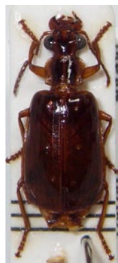
27. オオヨツアナアトキリ ゴミムシ