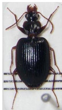
14. ヤセアトクリゴミムシ