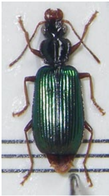
16. アオアトキリゴミムシ