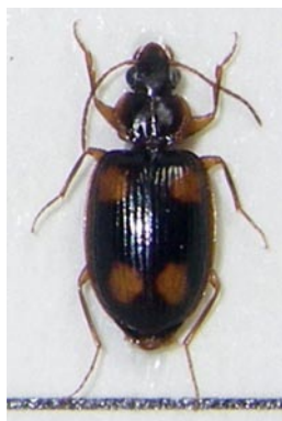
13. コヨツボシアトクリゴミムシ