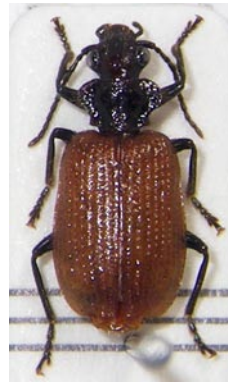
19. アリスアトキリゴミムシ