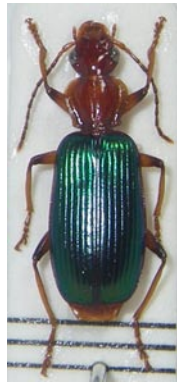
17. キガシラアオアトキリ ゴミムシ