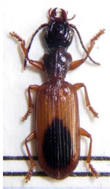
3. クロモンヒラナガゴミムシ