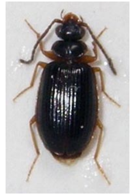
5. カドツブゴミムシ