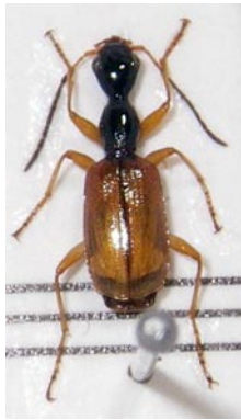
2. チャバネクビナガゴミムシ