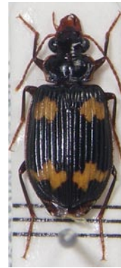
9. コキノコゴミムシ