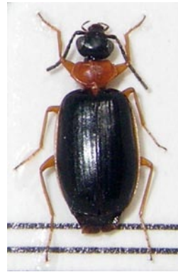
4. ダイミョウツブゴミムシ