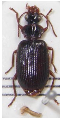
18. メダカアトキリゴミムシ