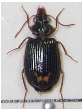
11. ハギキノコゴミムシ