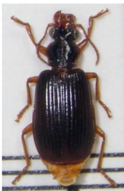
26. ミツアナアトキリゴミムシ