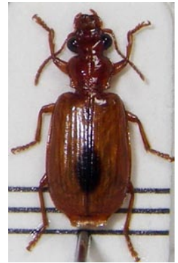
25. ヒトツメアトキリ ゴミムシ