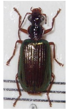
20. コアオアトキリゴミムシ