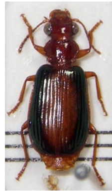
24. アオヘリアアトキリ ゴミムシ