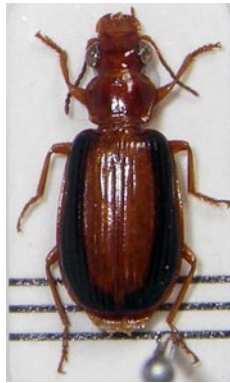
23. クロヘリアアトキリ ゴミムシ