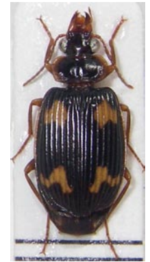
10. ヒメキノコゴミムシ