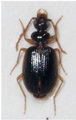
6. クロツブゴミムシ