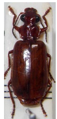
30. オオヒラタアトキリ ゴミムシ