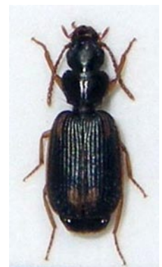
15. キボシアトクリゴミムシ