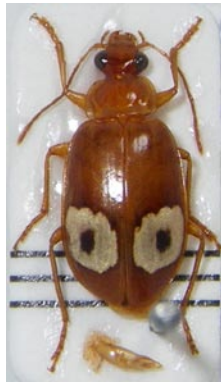
22. フタツメゴミムシ