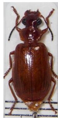
29. ヒラタアトキリゴミムシ