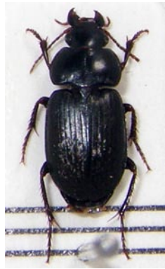
7. トゲアトクリゴミムシ