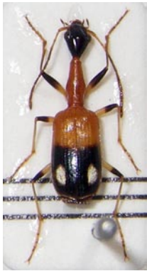
1. フタモンクビナガゴミムシ