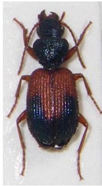
8. ダイミョウアトクリゴミムシ