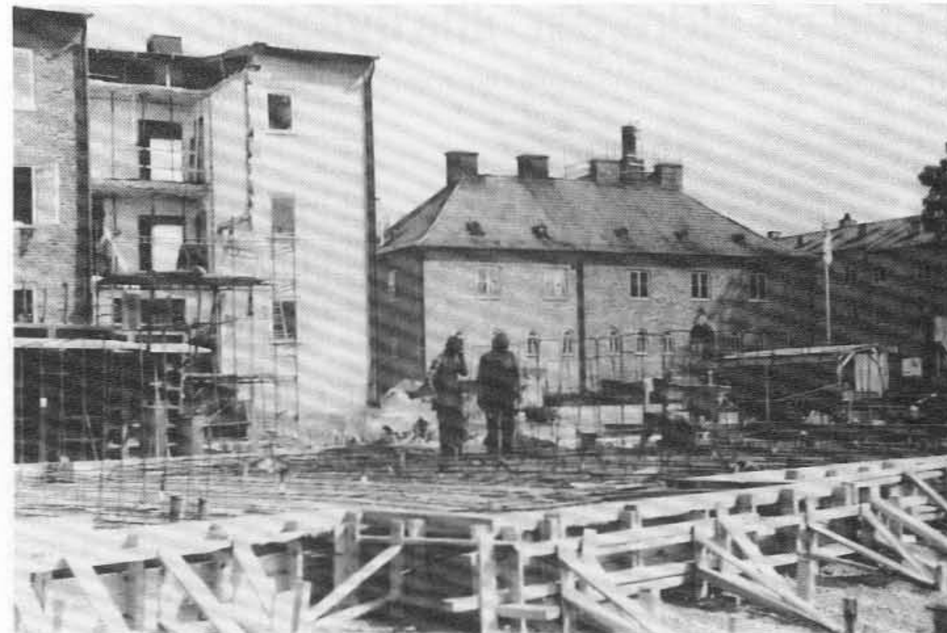
Bottenplatta för nybyggnationen gjuts. Nuvarande avdelning 1, 2 och 3 rivs delvis för att bereda plats åt hiss. I bakgrunden syns det ännu orörda varmbadhuset.

Vid den nu påbörjade om- och tillbyggnaden försvinner de äldsta smårummen genom sammanläggning av rumsytor till lägenhetsytor. Sammanlagt kommer servicehuset att omfatta 35 lägenheter, varav 16 vardera i tillrespektive ombyggnaden och tre i gamla varmbadhuset. Samtliga lägenheter kommer att ha normalutrustat kök med matplats. Badrummen får dusch samt plats för tvättmaskin. Balkong eller uteplats kommer med något undantag att finnas till varje lägenhet. Varje lägenhet får lokaltelefon kopplad till receptionen liksom ringledning för larm.