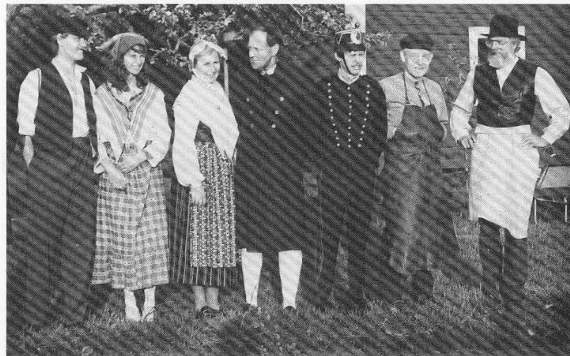
Kumla sockens näringsliv och tradition gestaltas av drängen och pigan, bonden och hans maka, skomakaren samt stenhuggaren.