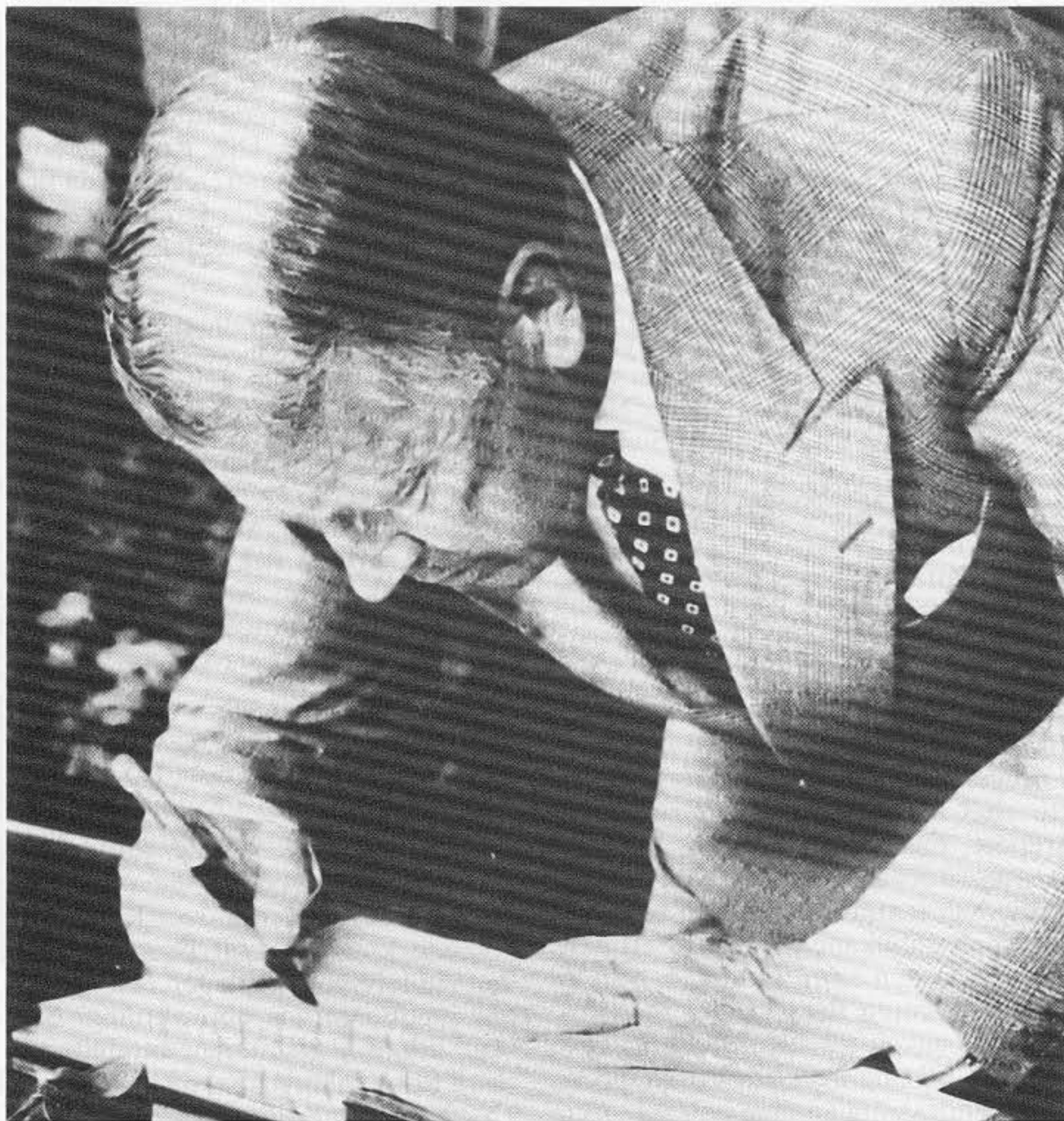
Gustaf VI Adolf skriver i gästboken på C A Jonssons skofabrik vid sitt besök i Kumla den 16 juni 1953.

gjorde alltså som de tidigare kungarna ett återbesök i Kumla.