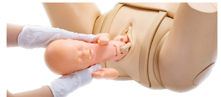
Asistencia de parto