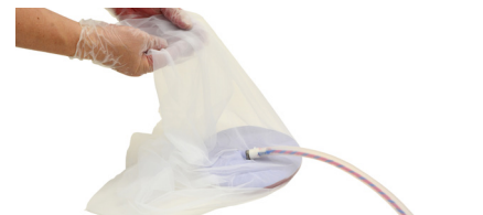
Inspección de placenta y velamen