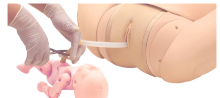
Pinzamiento, amarre y corte del cordón umbilical