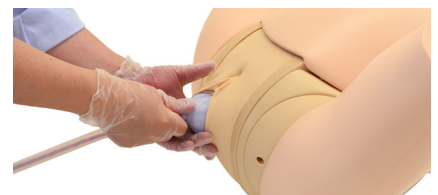
Extracción de placenta