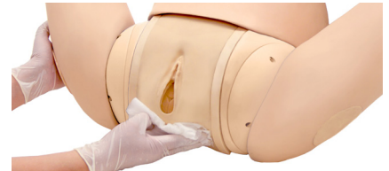
Protección perineal, protección de esfínter anal