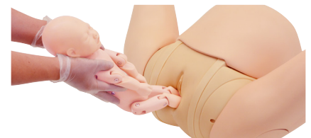
Extracción del neonato fluida