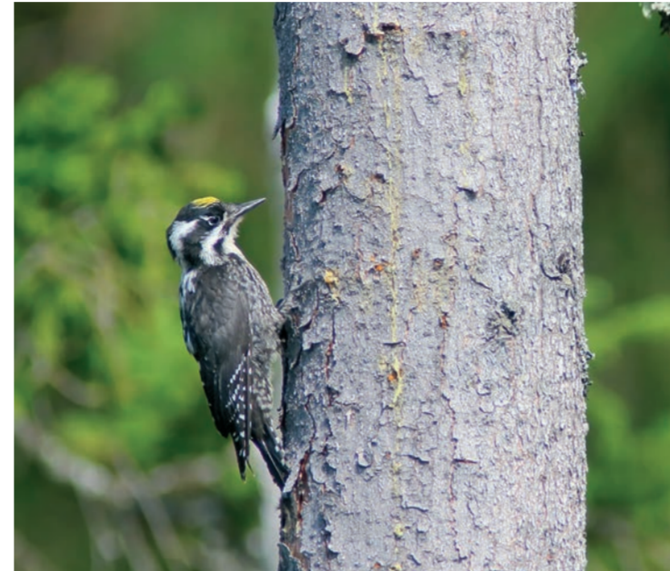
Tretåig hackspett – Picoides tridactylus

Vid Staktjärns sydöstra strand finns en gammal ristning i en tall. Större delen av texten är borthuggen men årtalet 1788 finns kvar. Troligen är ristningen gjord av en vallkulla, en kvinna som vallade djur i skogen från någon av de närliggande fåbodarna. Vallkulleristningar har hittats på flera ställen i Dalarna. De består ofta av ett eller flera namn på olika vallkullor, årtal och ibland en text. Ristningen är den första kända av sitt slag i Hedemora kommun.