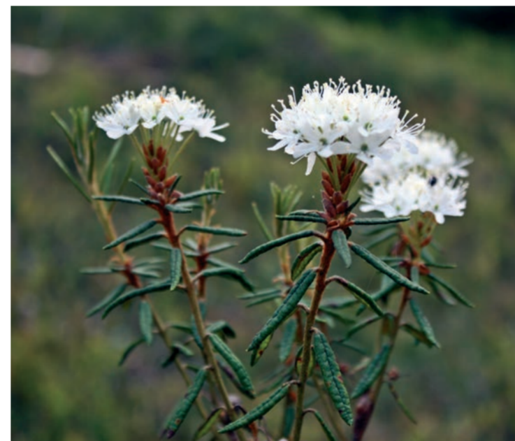
Skvattram – Rhododendron tomentosum