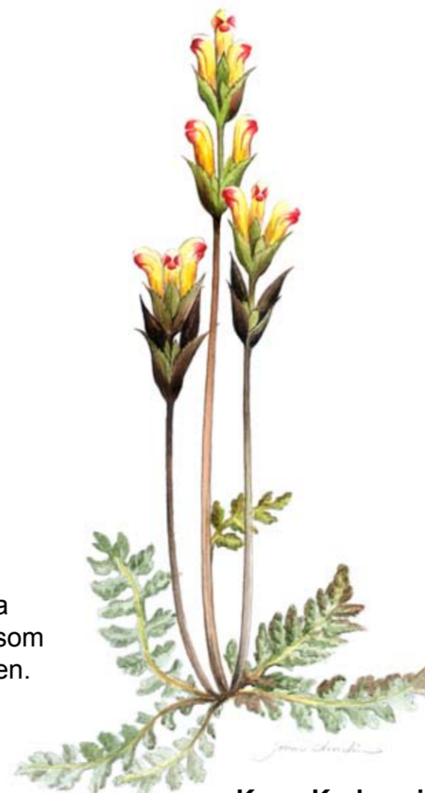
Kung Karls spira Pedicularis sceptrum-carolinum

Den ståtliga Kung Karls spira växer i de blomsterrika kärr som finns söder om Näcksjövardens.