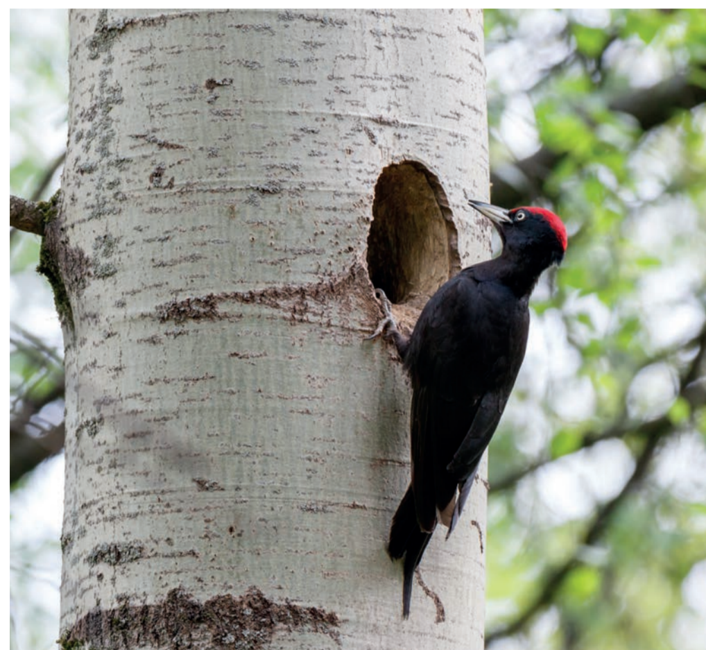
Spillkråka ( Dryocopus martius ).

Ett strövtåg här är ett äventyr. Det är inte bara brant, du måste också kliva över lågor och ta dig igenom tät skog i stiglöst landskap. En låga är ett dött, liggande träd. Och du passerar många vindfällan som vittnar om stormar som här har vräkt omkull fullt friska träd. Som en kompakt vägg med rötter, jord och stenar i tapeten tornar vindfället upp sig. Framför väggen ligger marken bar med grus och sten och på andra sidan ligger stam och krona i hela sin längd.