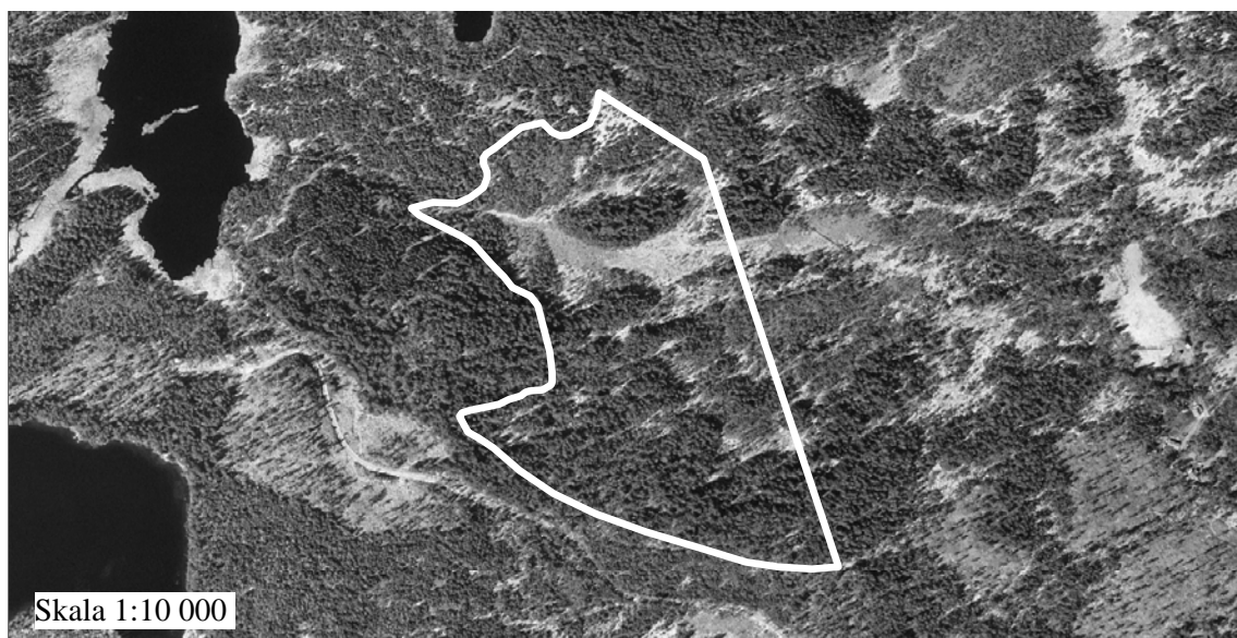
Skala 1:10 000