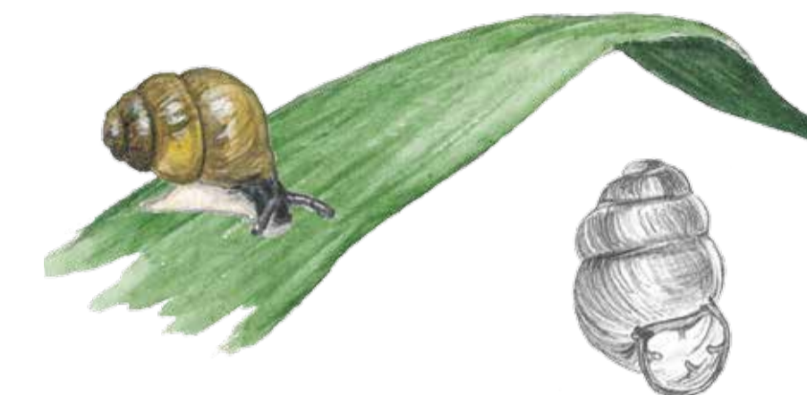
Kalkkärrsgrynsnäcka ( Vertigo geyeri ). Den sällsynta snäckan blir knappa två millimeter stor. Den finns i rikkärren invid Djurrödsbäcken.