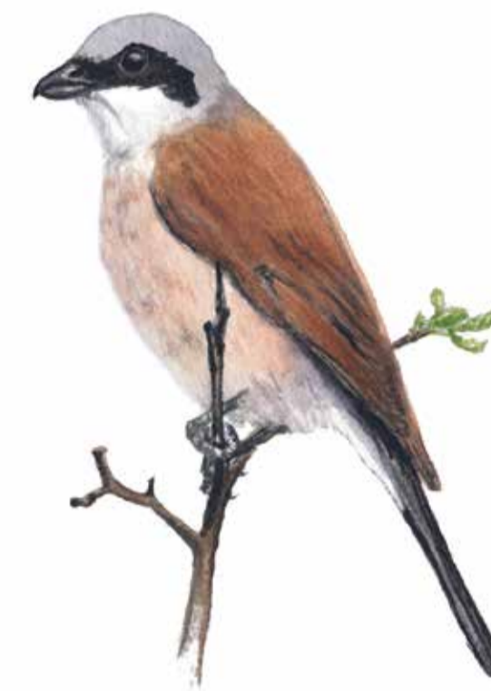
Törnskata ( Lanius collurio ) Är en iögonfallande fågel som använder taggarna på tex slån och hagtornsbuskar för att spetsa insekter som matförråd.