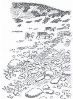
Illustration: Sören Holmqvist

Ett dramatiskt inslag i terrängen finns här dock; Sömlingshågnas branta lodväggar möter i norr gränsen mot Härjedalen. Toppen når den imponerande höjden av 1195 meter, länets näst högsta berg! Vågar man sig inte på att bestiga denna bjässe, kan man även från Fonnfjällets topp få en fin utsikt över vidderna runt omkring.