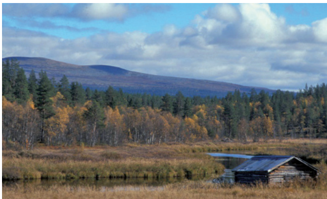
Höst på Vedungsfjällen

Vik av från riksväg 70, mellan Särna och Idre på väg 311 norrut. Reservatet nås enklast från Storfjäten eller från Fröbergsvallen. Alternativt från Särna direkt norrut mot Nysätersvallen.