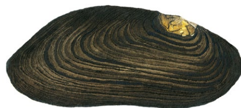
Flodpärlmussla. Illustration: Michael Holmberg

Det är forsens kraft som skapat bygden runt Grängshyttan. Hyttan har anor åtminstone sedan mitten av 1400-talet och var i drift fram till år 1888 och revs kort därefter. Kraften från det forsande vattnet har även använts till en kvarn, vars förfallna kvarnbyggnad i slaggsten ännu finns kvar på platsen. Om traktens bergsbrukshistoria berättar även bergsmansgårdarna och den ståtliga stenvalvsbron som leder över Rastälven.