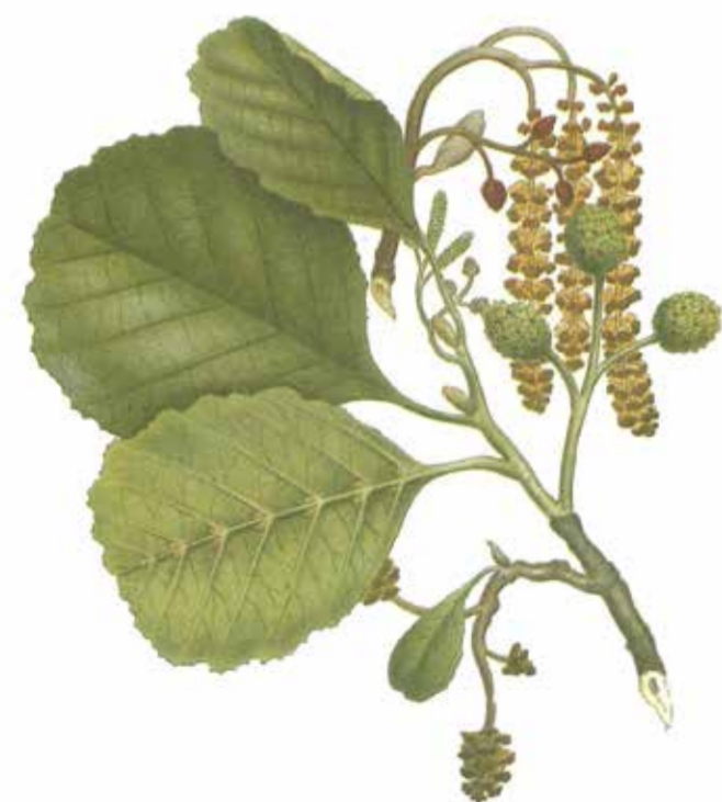
Klubbala Alnus glutinosa

Asp, björk och sälg växer i de gamla lövbrännorna, spår efter bränder. Träden är mellan 110–170 år. Och på marken bland mossiga stenar och rötter ligger det många döda träd i olika åldrar. I några svackor växer grova klubbalar – en ovanlig syn så här långt norrut.