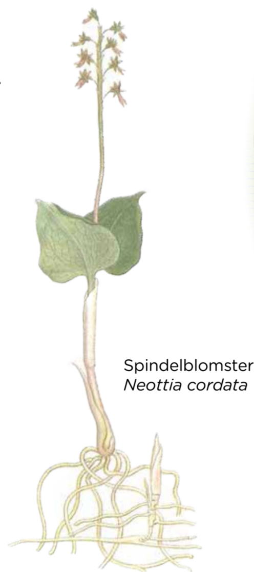
Spindelblomster Neottia cordata