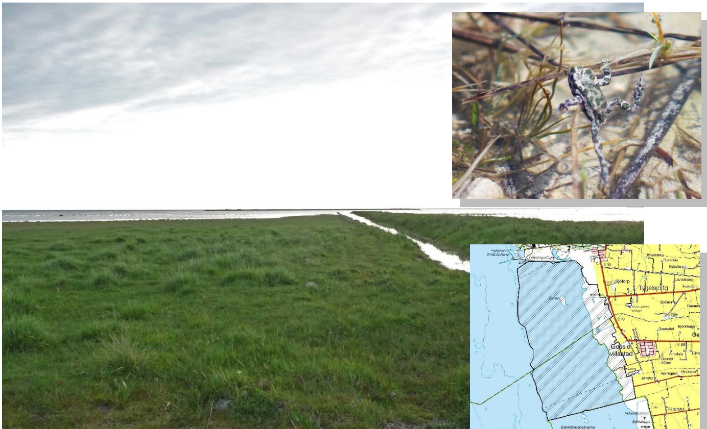
Sjotorps ängar i Tygelsjö-Gessie och en ung grönfläckig padda.