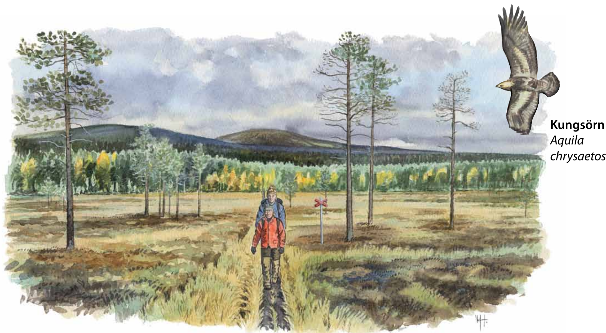
Kungörn Aquila chrysaetos

Här invid gränsen till Norge, mitt mellan Fulufjället och Sälenfjällen, reser sig fyra små fjäll som tillsammans bildar Skarsåsfjällens naturreservat. Faxfjället, Skarsåsfjället, Mellanfjället och Näs fjället är alla mjukt rundade lågfjäll där Näs fjället är högst med sina 904 meter. Här råder stillhet och ro i en skog som fått stå orörd under lång tid.