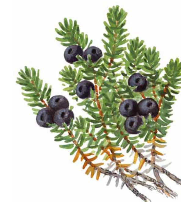
Kråkbär Empetrum nigrum

Illustrationer: Martin Holmer. Text, karta och layout: Naturcentrum AB.