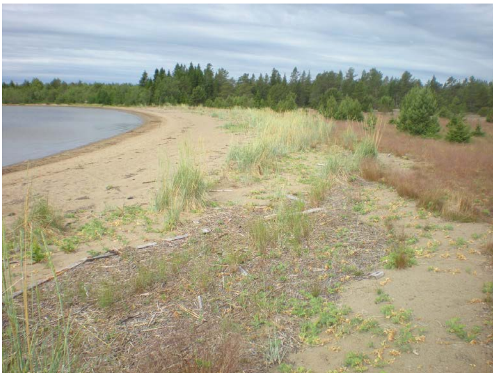
Storsand, en förhållandevis vidsträckt sandstrand med bakomliggande sandhed som delvis har koloniserats av tallar. Foto. Jonas Grahn.

bland annat strandråg och strandvial. Större sandstränder är inte vanliga i Västerbottens län och utgör generellt sett viktiga livsmiljöer för olika insektsarter inte minst intressanta och hotande arter. Stranden är också viktig ur ett friluftslivsperspektiv. Storsand används idag som badplats och är tillgänglig via en enklare väg från närbelägna fritidshus. Det finns några parkeringsfickor iordningställda nära denna bebyggelse. I anslutning till sandstranden utmynnar Kolvikbäcken. Invid mynningsområdet finns en gran- och tallskog som har bedömts ha höga naturvärden. Denna del är också Natura 2000 område. Vattenområdet utanför Storsand utgörs även det av grundområden som bedömts ha en fin marin miljö. Här har också kransalgen borsträfsse noterats.