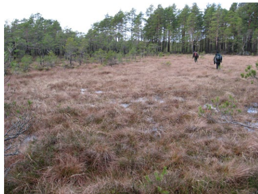
Norra Abortärnmossen ovan och Orrmossen till höger.

På Kråksjöåsen kan du vandra i medeltida munkars fotspår genom myrlandskapet. Stigen på rullstensåsen har gamla anor och leder ut i en mosaik av skog och myrar som är kännetecknande för Kojemossens naturreservat.