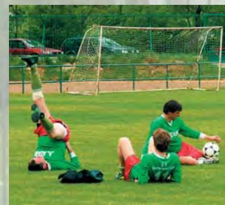
Staří lvi nabírají síly