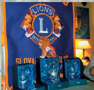
Poháry pro vítěze

Členové LEO Clubu Nitra přišli s výborným nápadem na uspořádání turnaje v malé kopané pro LEO Cluby ze středoevropských distriktů. Na přiblížení atmosféry této akce přinášíme malou fotogalerii, samostatný článek o turnaji, psaný organizátory, je uveden na 18. straně.