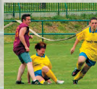
Boj to byl urputný...