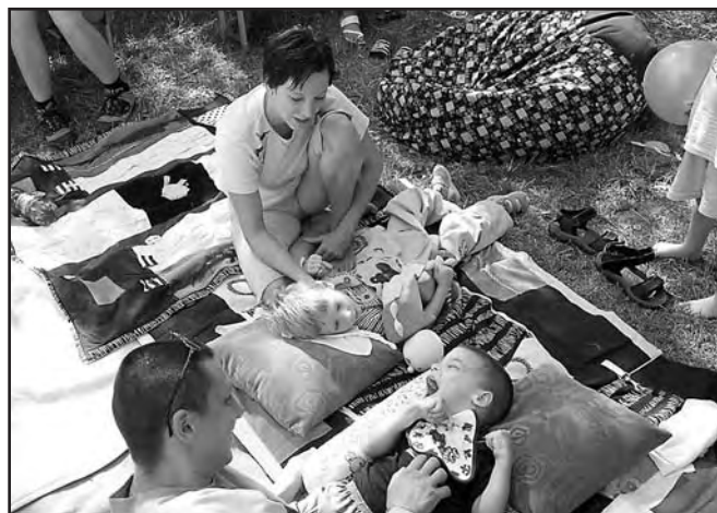
Děti s rodiči

hoto 5. benefičního koncertu byl výtěžek 12 500,- Kč předán Středisku rané péče na zakoupení rehabilitačních pomůcek pro děti, které mají od narození zrakovou vadu, příp. další postižení a pečují o ně rodiče.