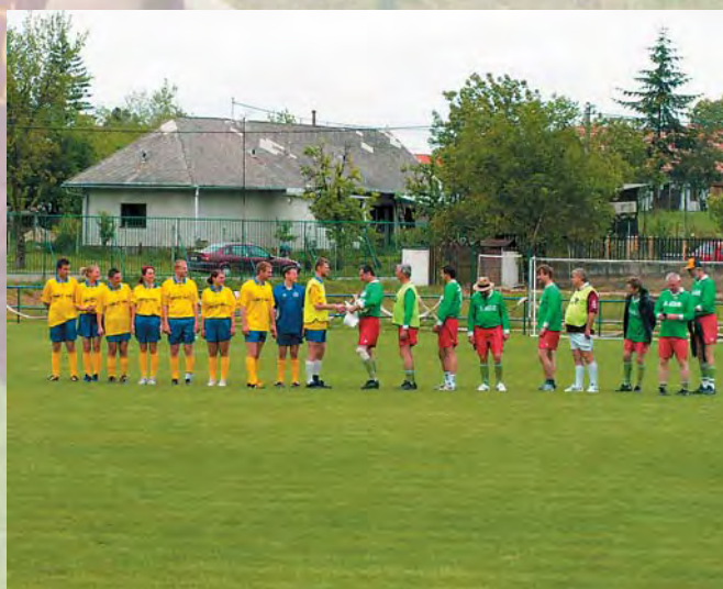
Před klíčovým zápasem LEO Club Nitra vers. "Staří lvi" LCI D122