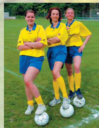
Fotbal je krásný sport...