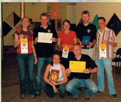
Foto po večerním vyhodnocení