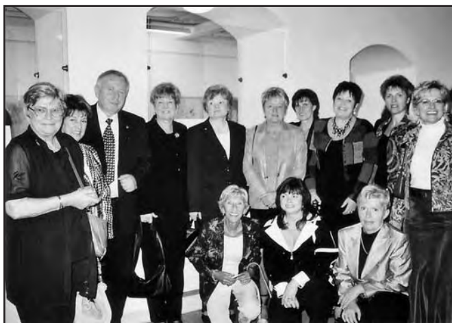
Dámy LC Plzeň s guvernérem distriktu

Za účasti vedení Fakultní nemocnice a hlavních mediálních partnerů regionu byl na Oční klinice FN Plzeň předán dne 30. 9. 2004 finanční dar klubu na ozvučení lůžek pacientů, kteří po operacích nevidí nebo vidí jen částečně a tudíž hezké slovo nebo hudba dle vlastního výběru jim zpříjemní pobyt v nemocnici. Hodnota finančního daru činila 123 tis. Kč, prostředky byly získány z výtěžku 8. garden party a dvou benefičních koncertů. Nápad, který se povedlo realizovat v novém objektu FN, byl velice dobře přijat, navíc členky zajistily i firmu, která instalaci provedla v minimálních režijních cenách. Media informovala pohotově veřejnost, protože o naše největší oční zdravotnické zařízení v Západočeském kraji, které je srovnatelné odborností a vybavením diagnostickou a léčebnou technikou s klinikami nejvyspělejších zemí, je velký zájem.