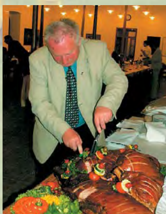
Na závěr bylo vynikající selátko