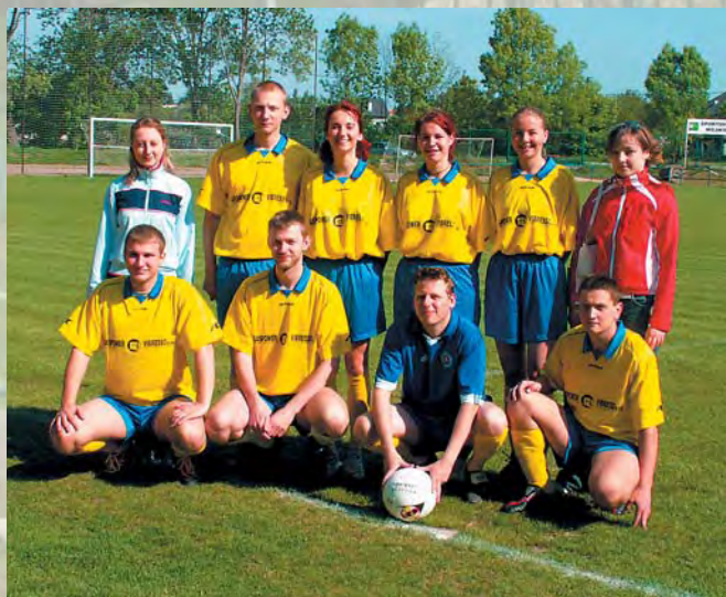
Tým Leo Clubu Nitra