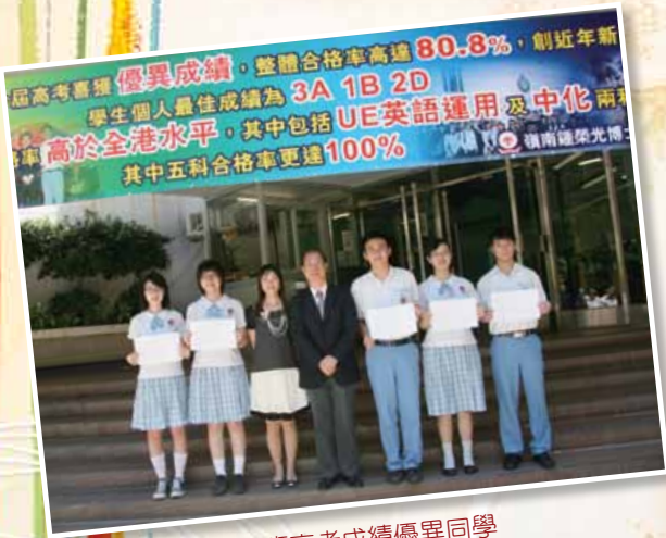
文科班高考成绩優異同學