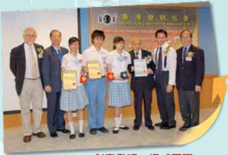
創意發明，揚威國際

在去年九月的校訊，本人曾提及在教改下本校已勾劃出未來數年發展之宏圖，並於文中說明學校將朝著建立靈活活現之學生資料冊 (LIVE Portfolio) 作規劃。今期校訊，讓我就發展宏圖中第二個重點作一些申述，俾使家長及外界人士對學校之發展有進一步的認識。