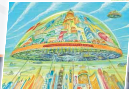
科幻畫——空中國際衛生醫療中心