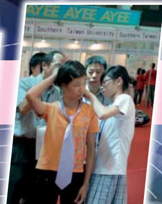
快捷領帶即場示範