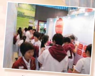
參觀機場世博展覽