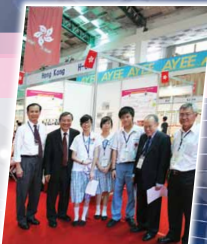
大會評判與本校代表合照