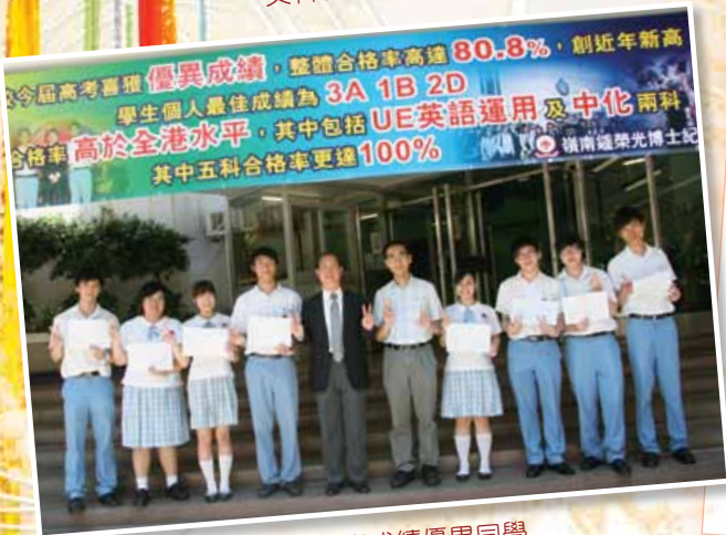
理科班高考成绩優異同學