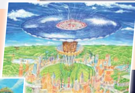
科幻畫——環保空氣過濾發電塔