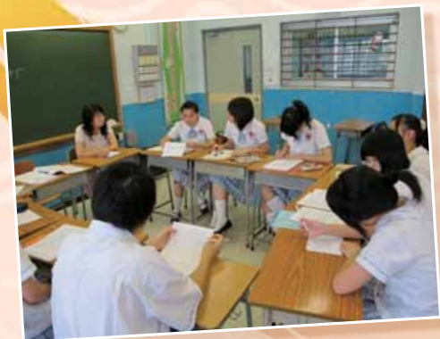
出發往上海世博前會議

今年是我第一次正式參與籌劃德育及公民教育週的活動。在過往三年，當公民週來臨的時候，我腦海中都會出現幾個問題：到底甚麼是德育及公民教育？德育及公民教育的範圍包括些甚麼？今年，我終於找到答案了。