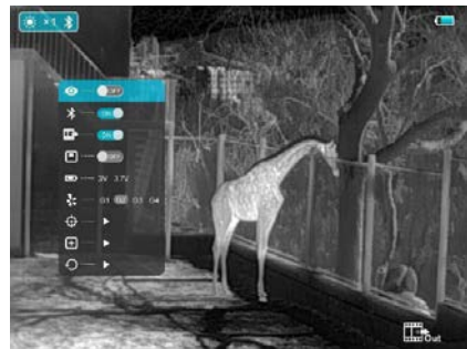
3. kép: A haladó menü