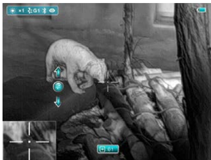
5. kép: Inaktív pixelek korrekciója