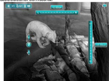
4. kép: A belövés funkció kezelőfelülete