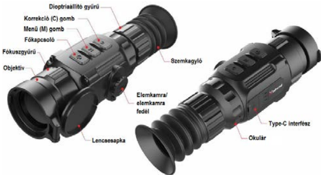
1. kép: A készülék részlei

Az Xsight SCL egy költséghatékony hőkamera céltávcső, ami többféle fegyvertípusra felszerelhető. Kís tömeg, kompakt méret és egyszerű hordozhatóság jellemzi. Az Xsight SCL a behelyezett elemekkel hosszán és feltöltésmentesen működik használható sűrű ködben, poros környezetben, akár éjszakai fényviszonyok közepette is.