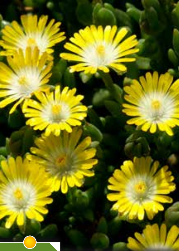
Hauteur 10 cm floraison de avril à octobre. DELOSPERMA 'Jewel of Desert Peridot' ®