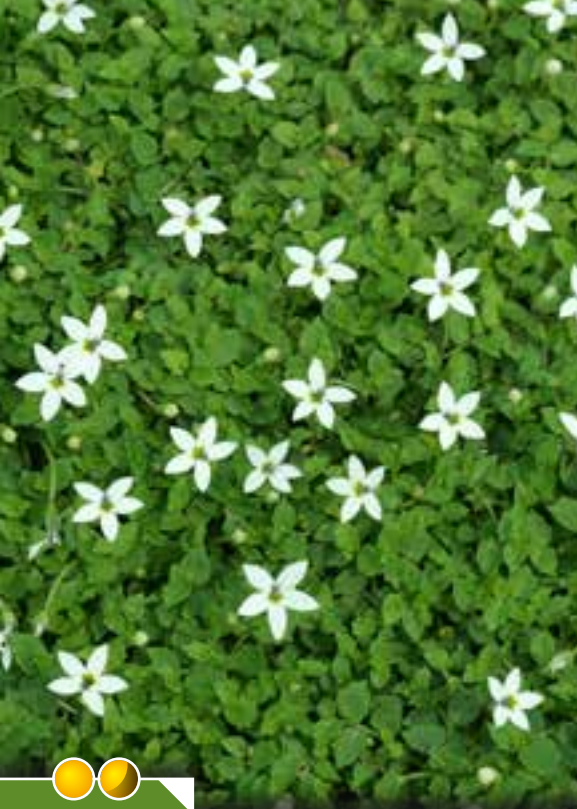
Hauteur 3 cm, floraison de mai à juillet. PRATIA pedunculata 'Alba'