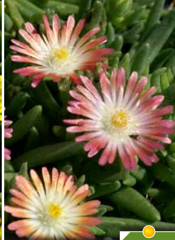
Hauteur 10 cm floraison de avril à octobre. DELOSPERMA 'Jewel of Desert Ruby' ®