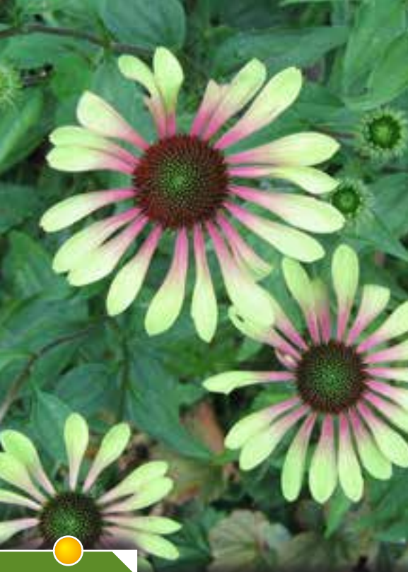
Hauteur 80 cm, floraison de juin à septembre. ECHINACEA 'Green Envy' ®