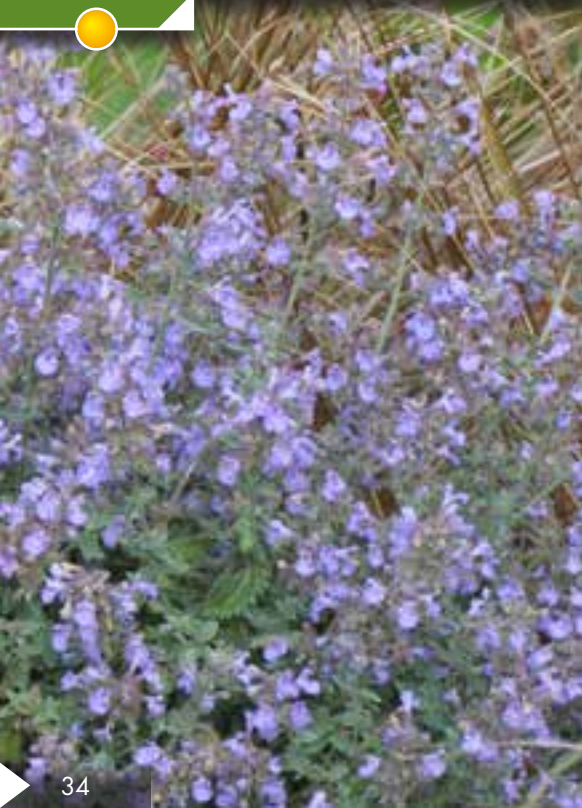
Hauteur 120 cm, floraison de juin à octobre. NEPETA parnassica