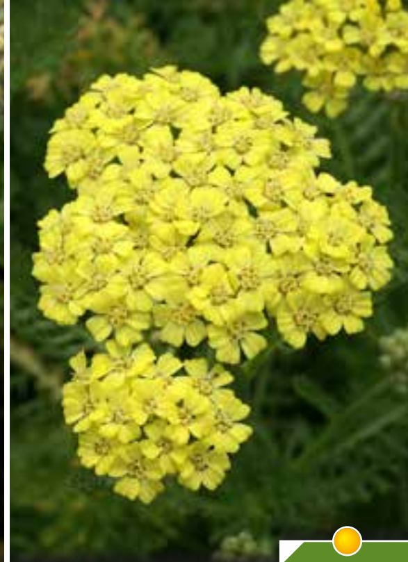
Hauteur 40 cm, floraison de juin à septembre. ACHILLEA 'Desert Eve Light Yellow'