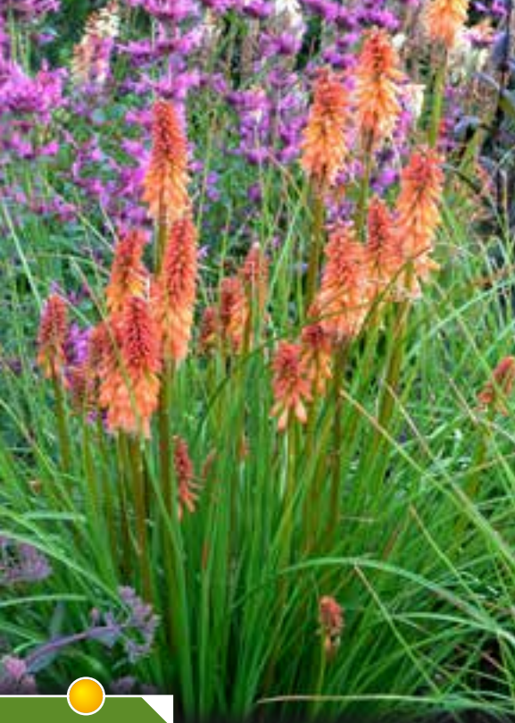
Hauteur 50 cm, floraison de juin à octobre.