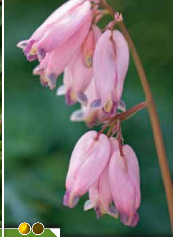
Hauteur 30 cm, floraison de avril à juillet. DICENTRA formosa 'Spring Magic'