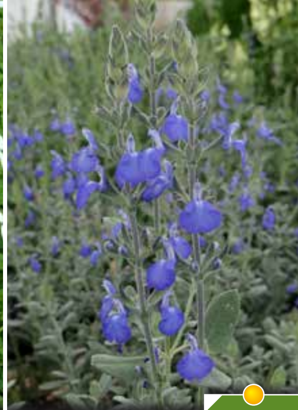
Hauteur 40 cm, floraison de mai à novembre. SALVIA chamaedryoides var. isochroma