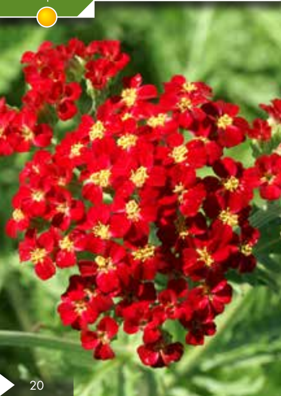
Hauteur 70 cm, floraison de juin à septembre. ACHILLEA 'Walther Funcke'