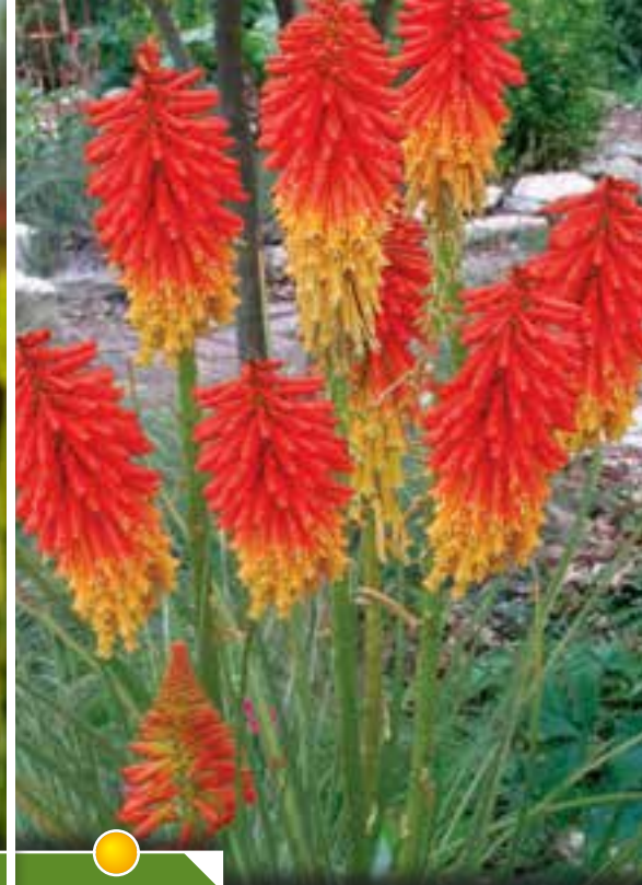
Hauteur 50 cm, floraison de juin à octobre.