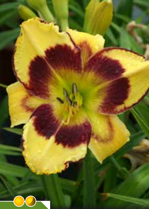
Hauteur 65 cm, floraison de juin à juillet. HEMEROCALLIS 'Calico Jack'