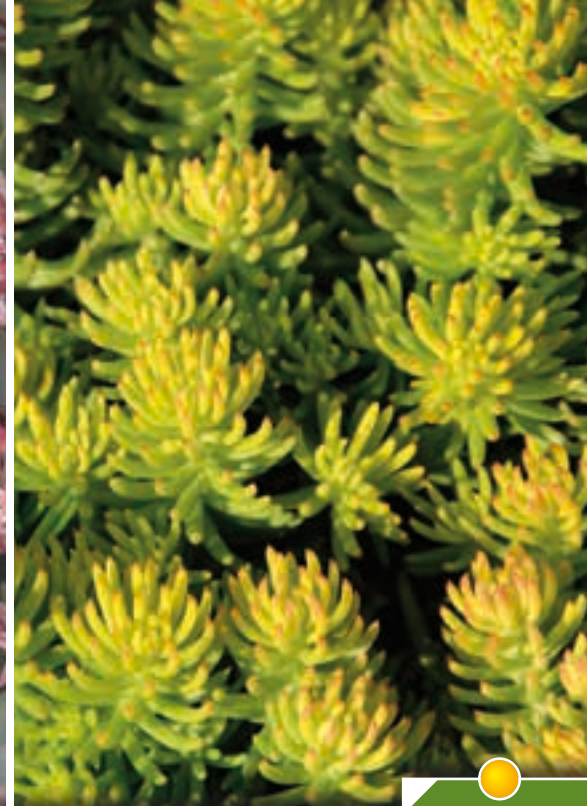
Hauteur 15 cm, floraison de juin à août. SEDUM reflexum 'Yellow Cushion'