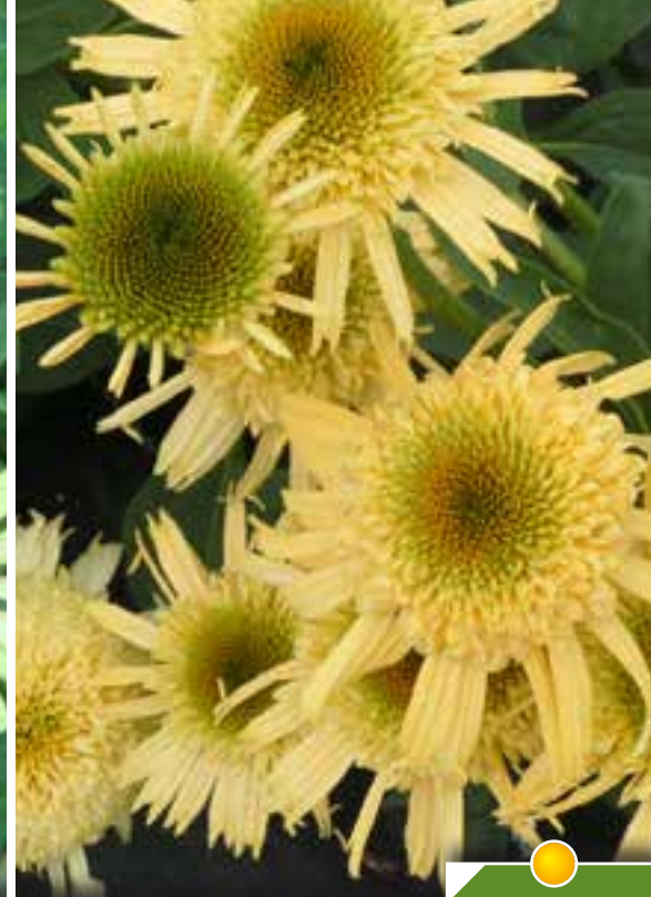
Hauteur 70 cm, floraison de juin à septembre. ECHINACEA 'Secret Joy' ®