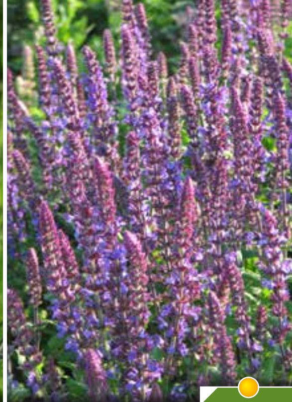
Hauteur 40 cm, floraison de mai à août. SALVIA nemorosa 'New dimension Blue'