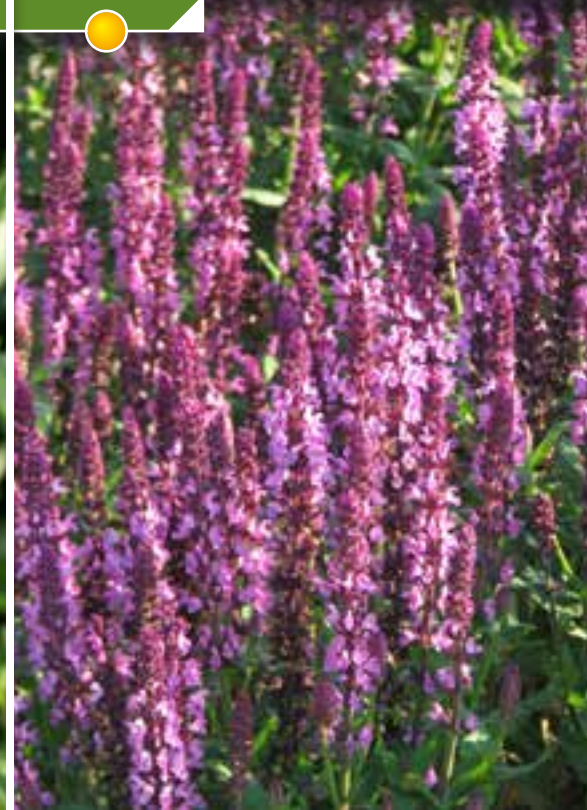
Hauteur 100 cm, floraison de mai à novembre. SALVIA 'Royal Bumble'