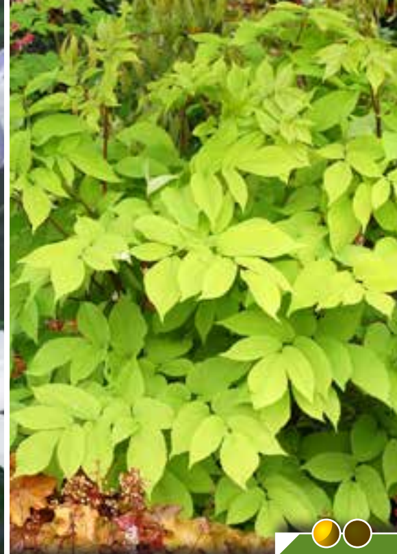
Hauteur 100 cm, floraison de août à septembre. ARALIA cordata 'Sun King'