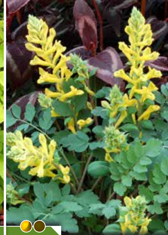
Hauteur 20 cm, floraison de avril à août. CORYDALIS 'Canary Feathers' ®