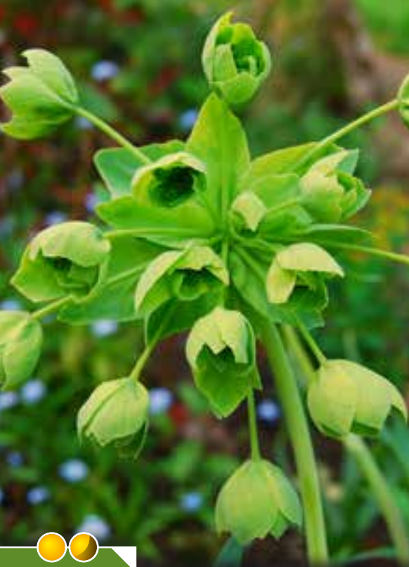
Hauteur 100 cm, floraison de avril à juin. MATHIASELLA bupleuroides 'Green Dream'