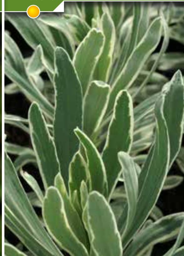
Hauteur 45 cm, floraison de mars à mai. EUPHORBIA martini 'Ascot Rainbow' ®