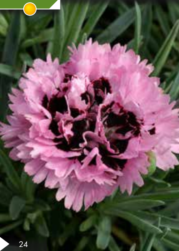
Hauteur 25 cm floraison de avril à août. DIANTHUS 'Sherbet' ®