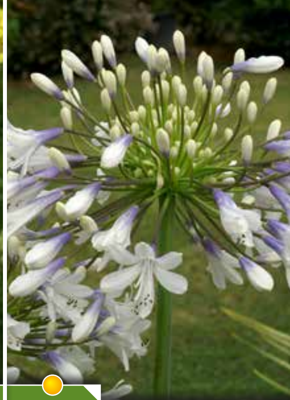
Hauteur 100 cm, floraison de juin à août. AGAPANTHUS 'Queen Mum'