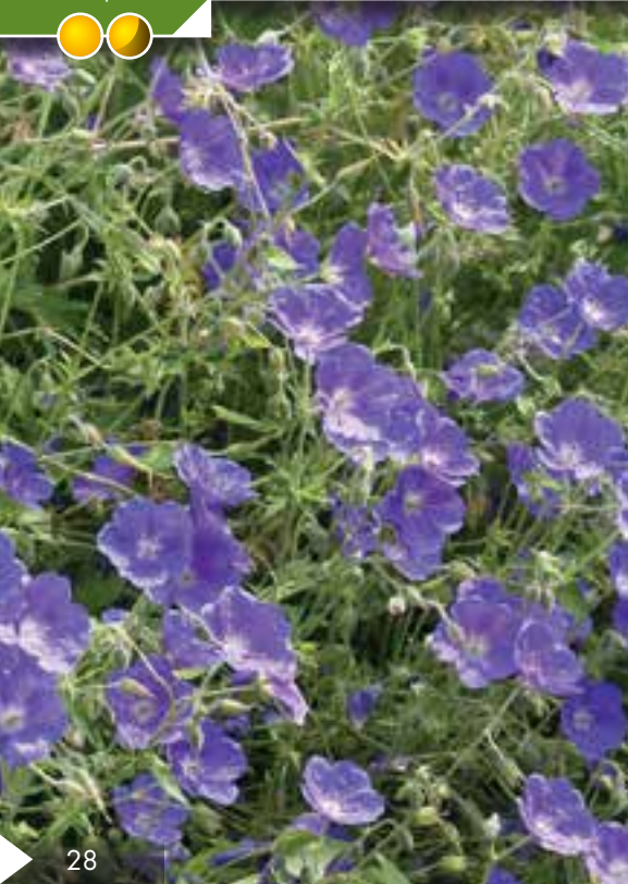
Hauteur 35 cm, floraison de juillet à octobre. GERANIUM 'Silvia's Surprise' ®