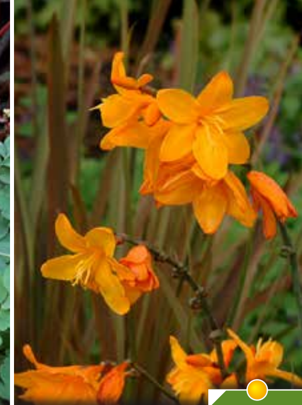
Hauteur 35 cm, floraison de juin à août. CROCOSMIA 'Twilight Fairy Gold'