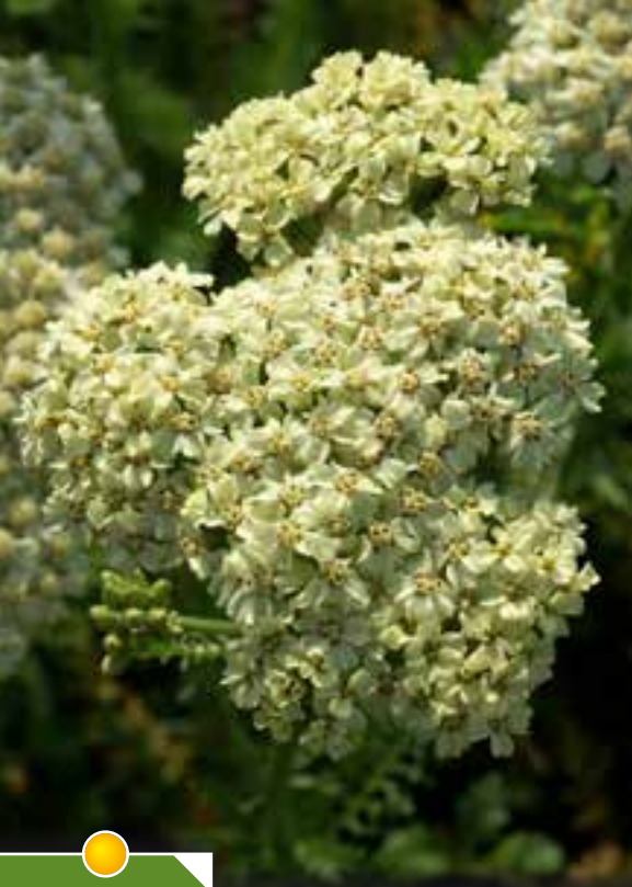
Hauteur 40 cm, floraison de juin à septembre. ACHILLEA 'Desert Eve Cream'