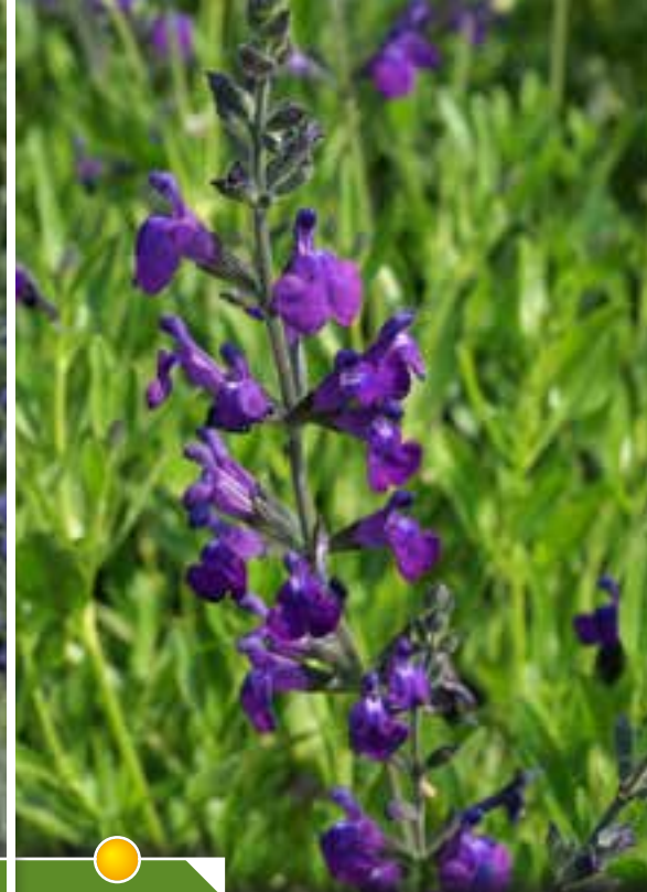
Hauteur 40 cm, floraison de mai à novembre. SALVIA lycioides