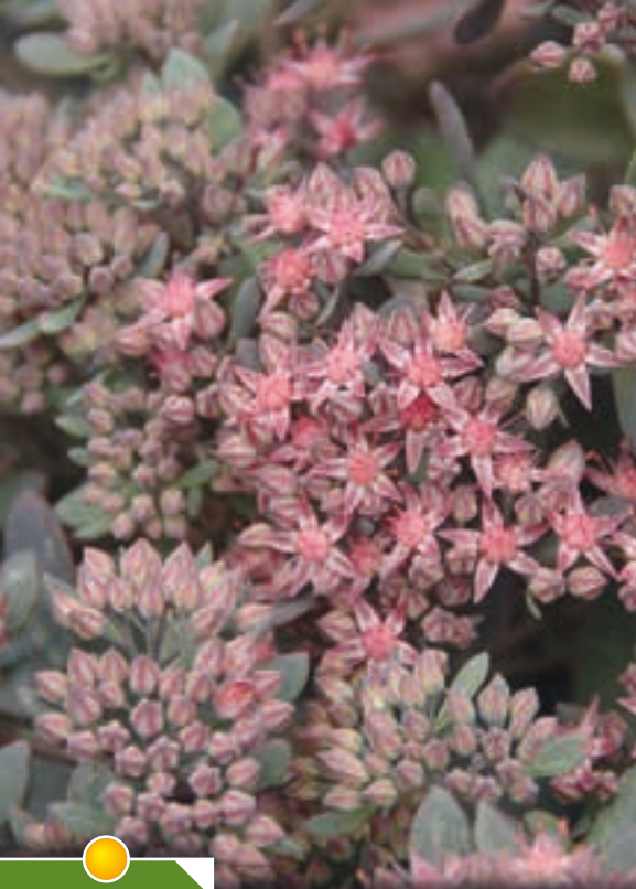
Hauteur 15 cm, floraison de août à octobre. SEDUM 'Red Canyon'