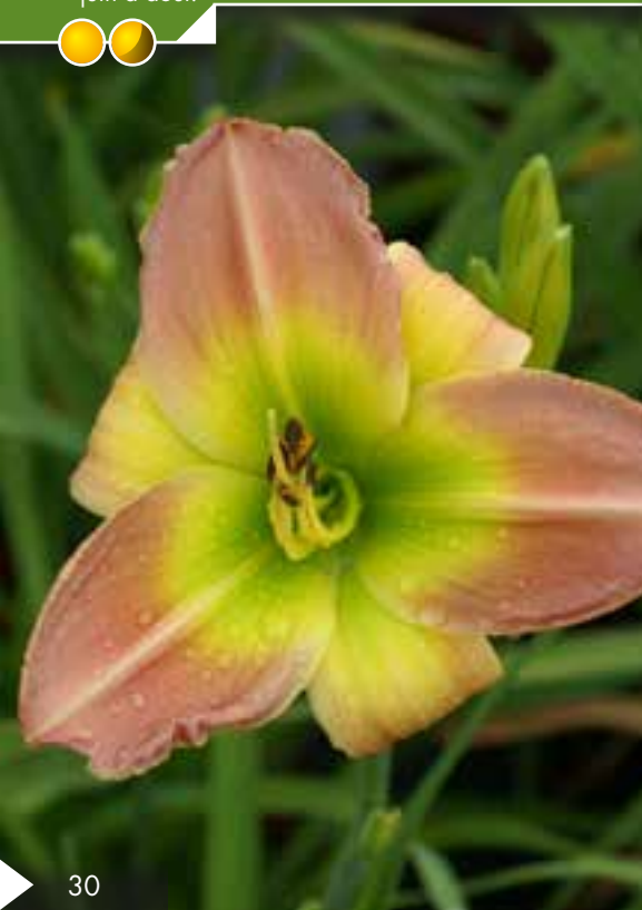
Hauteur 65 cm, floraison de juillet à septembre. HEMEROCALLIS 'El Desperado'