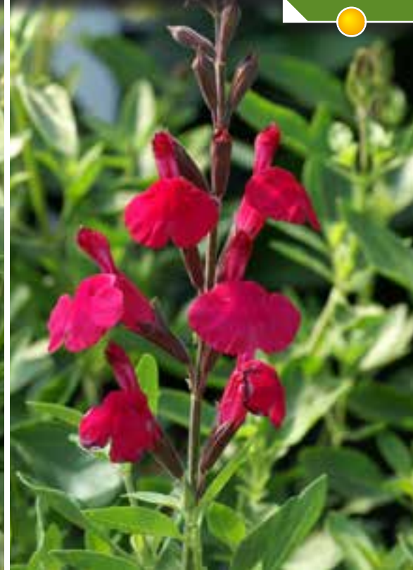
Hauteur 40 cm, floraison de mai à août. SALVIA nemorosa 'New dimension Rose'