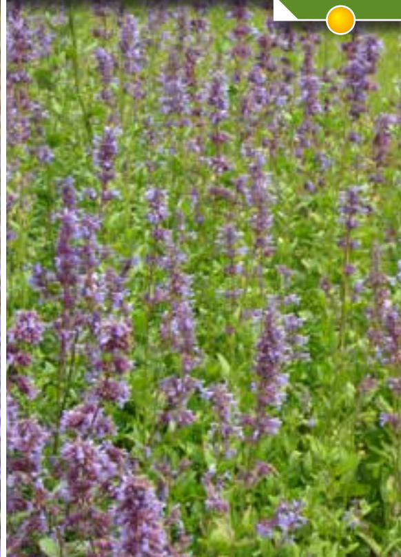
Hauteur 50 cm, floraison de juin à octobre. PENSTEMON Vesuvius