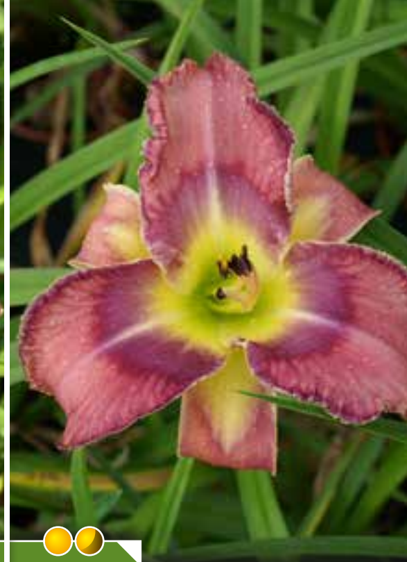
Hauteur 65 cm, floraison de juin à août. HEMEROCALLIS 'Mildred Mitchell'