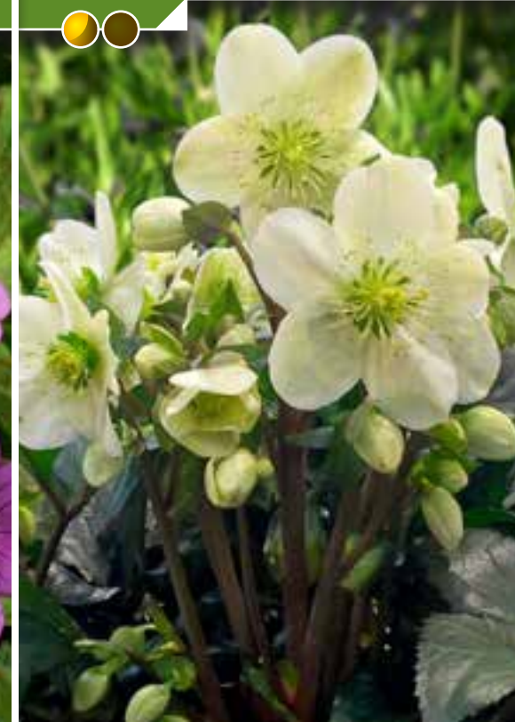
Hauteur 30 cm, floraison de janvier à avril. HELLEBORUS 'Magic Leaves' ®