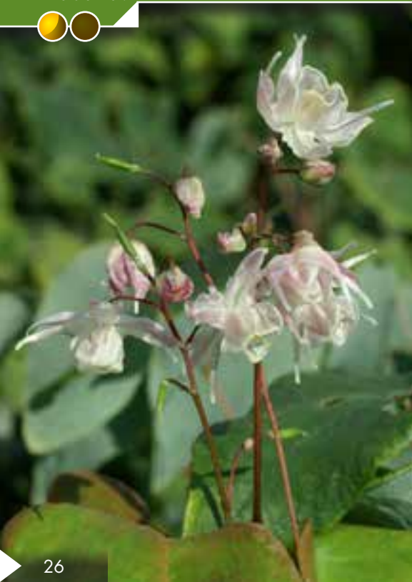
Hauteur 20 cm, floraison de juin à septembre. ERODIUM 'Stephanie'