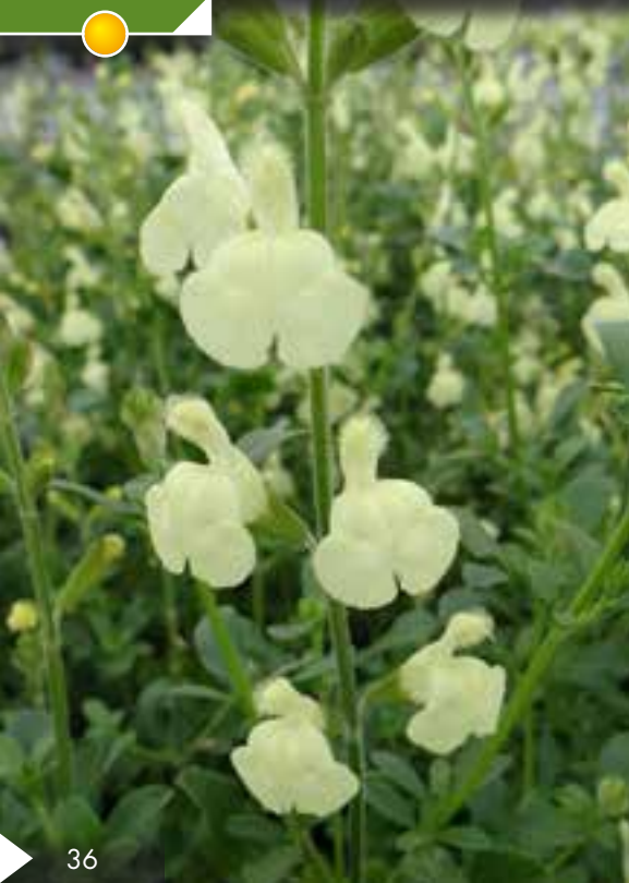
Hauteur 60 cm, floraison de mai à novembre. SALVIA jamensis 'Raspberry Royale'