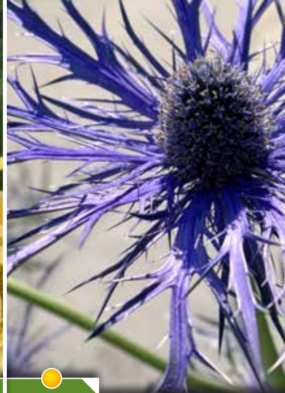
Hauteur 80 cm, floraison de juin à août. ERYNGIUM 'Pen Blue'