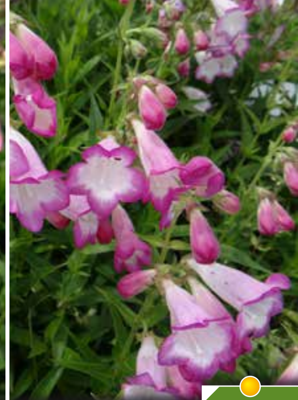
Hauteur 50 cm, floraison de juin à octobre. PENSTEMON 'Pensham Laura'