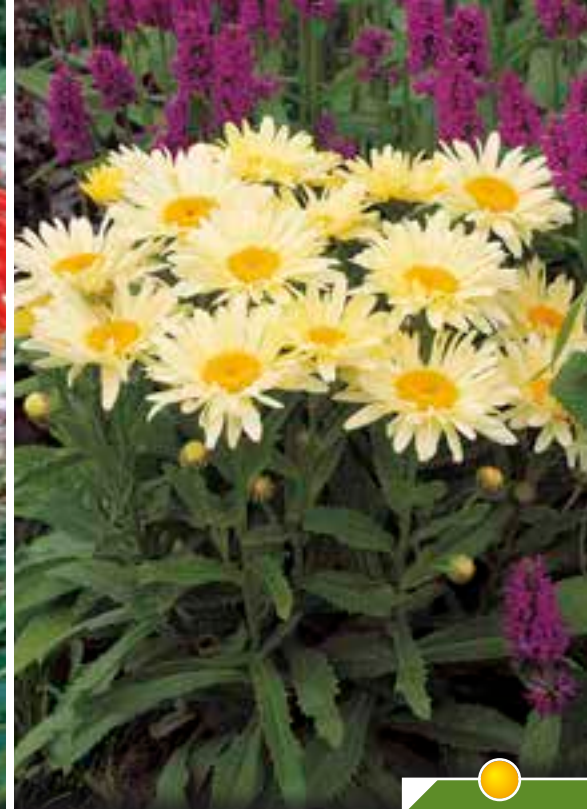
Hauteur 50 cm, floraison de juin à septembre.