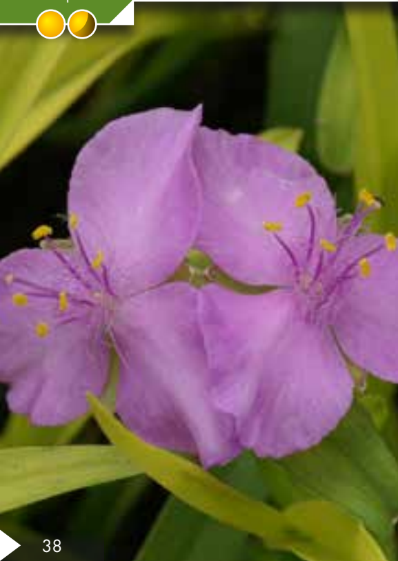
Hauteur 25 cm, floraison de avril à juin. VINCA major 'Wojo's Jem'