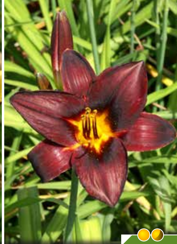
Hauteur 70 cm, floraison de juin à août. HEMEROCALLIS 'Chocolate Candy'