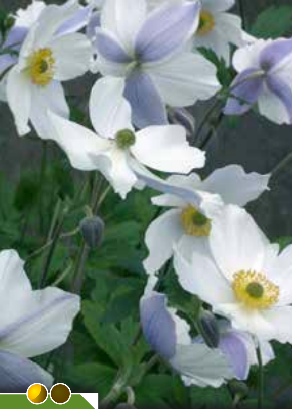
Hauteur 60 cm, floraison de mai à novembre. ANEMONE 'Wild Swan' ®