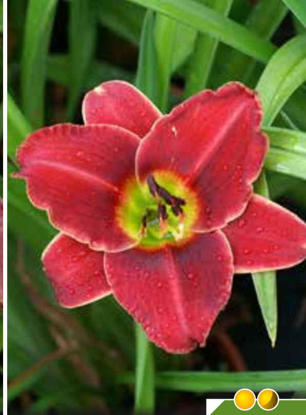
Hauteur 60 cm, floraison de juillet à septembre. HEMEROCALLIS 'Roses in Snow'