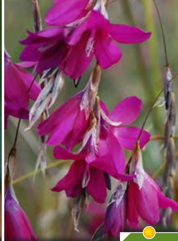
Hauteur 90 cm, floraison de juillet à août. DIERAMA 'Blackberry Bells'