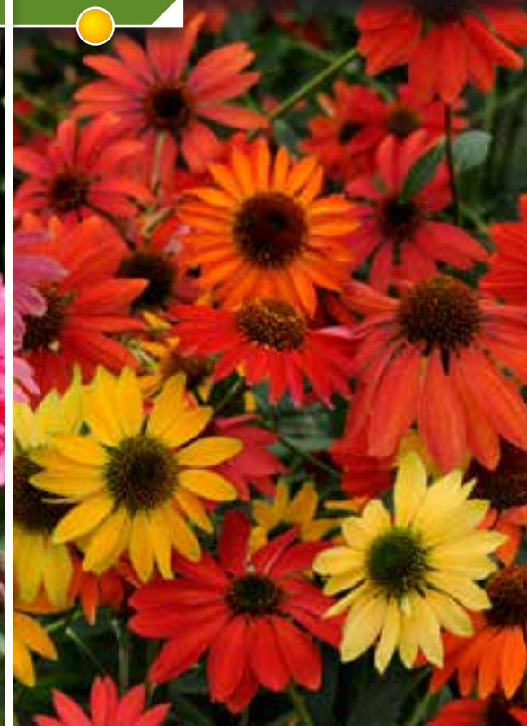
Hauteur 70 cm, floraison de juin à septembre. ECHINACEA 'Coupe Soleil'