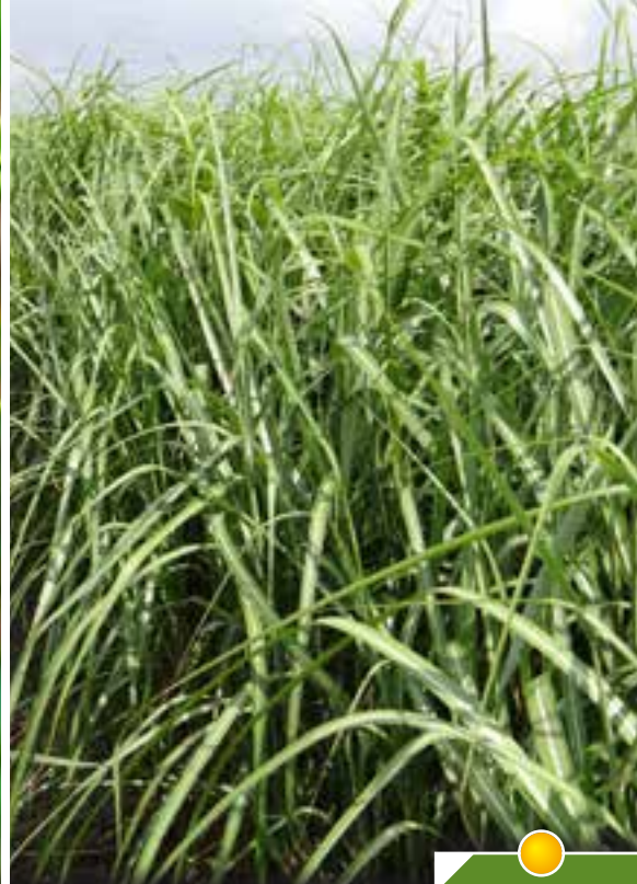
Hauteur 200 cm, floraison de août à décembre. MISCANTHUS sinensis 'Berlin'