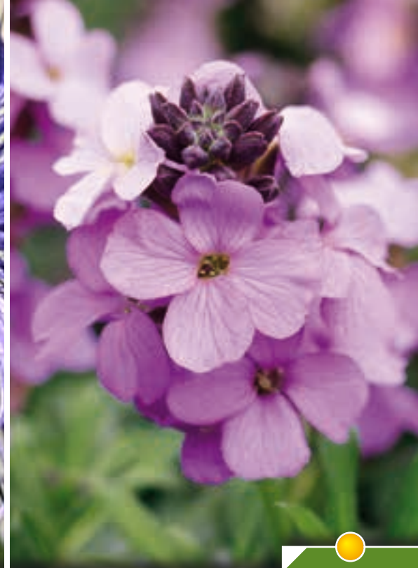
Hauteur 30 cm, floraison de février à juin. ERYSIMUM 'Poem Lavender'