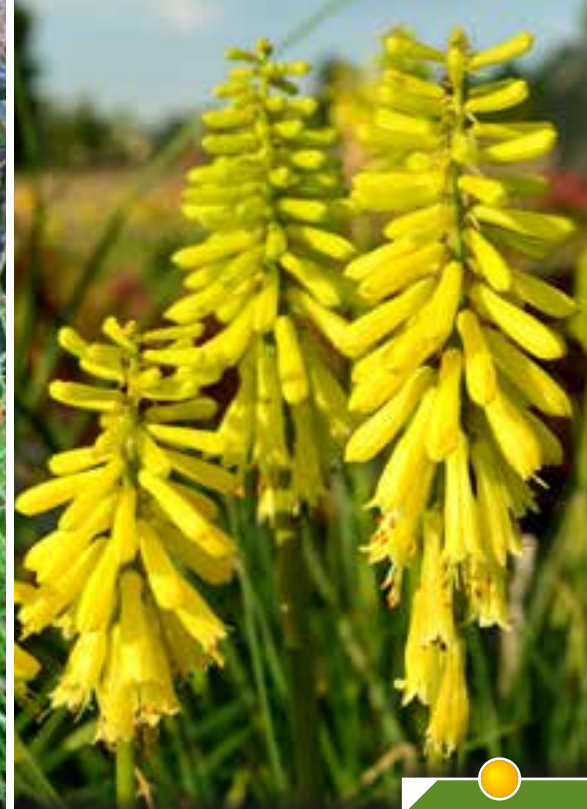
Hauteur 50 cm, floraison de juin à octobre.