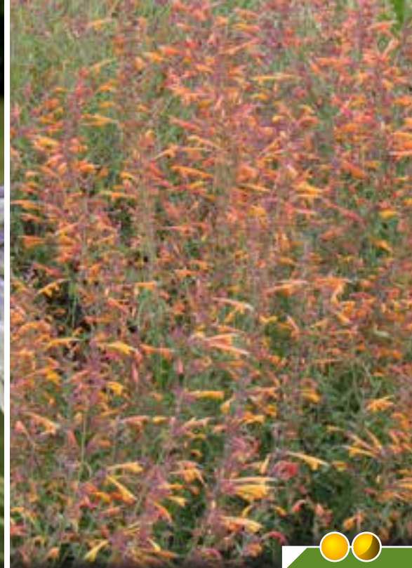
Hauteur 60 cm, floraison de juin à octobre. AGASTACHE aurantiaca