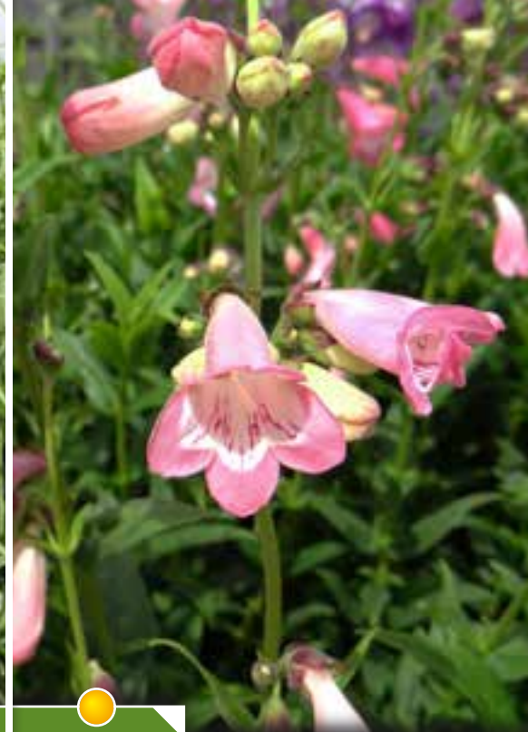
Hauteur 50 cm, floraison de juin à octobre. PENSTEMON 'Fujiyama'