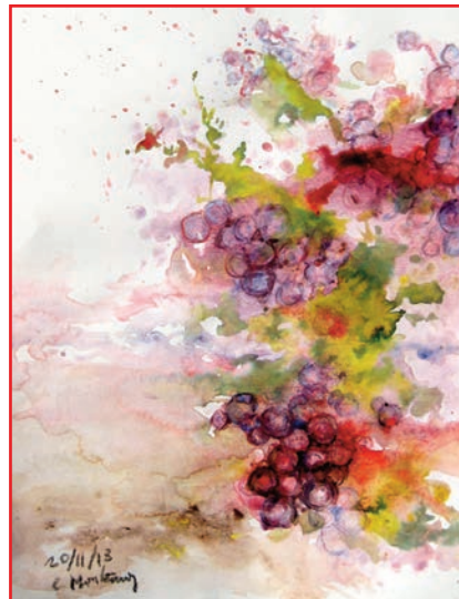
Un dels llenços de Carlos Montesinos.

de la sòlida terra en el líquid que és el vi.