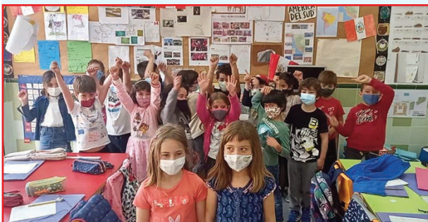
Dalt i baix alumnat de 1r Cicle de Primària de viatge arreu del món.