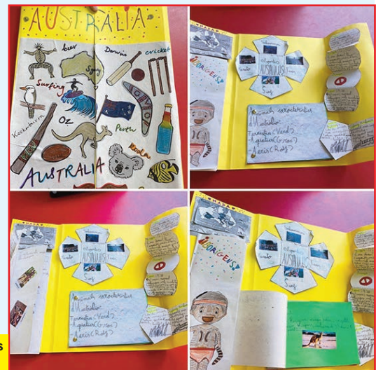
Llibres dels viatges.