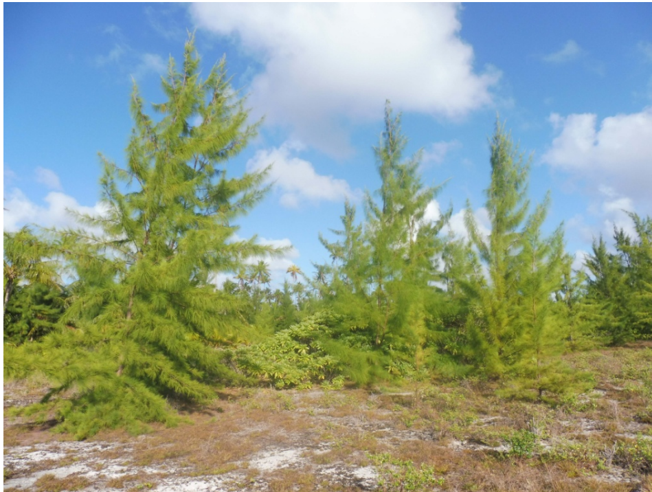
Photo 14. Neurolaena lobata (syn. Pluchea symphytifolia ), arbuste introduit et naturalisé sur le motu Nord près de la piste d'aviation, classé « espèce menaçant la biodiversité en Polynésie française » par le Code de l'Environnement.