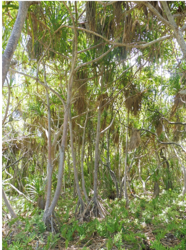
Photo 6. Fourrés à Pemphis acidula (Lythraceae, « 'ā'ie ») sur un des petits motus de l'Est.