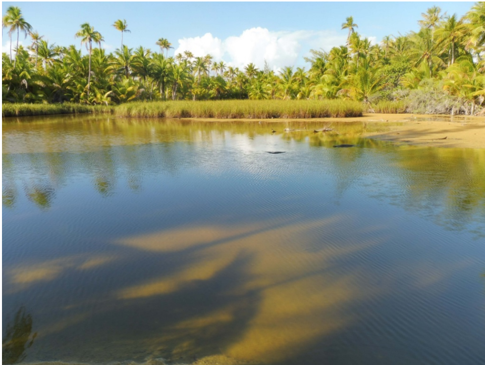
Photo 2. Marécage à Cladium mariscus subsp. jamaicense (Cyperaceae) avec de rares fougères Cyclosorus interruptus (Thelypteridaceae) à l'extrémité est du motu Nord.