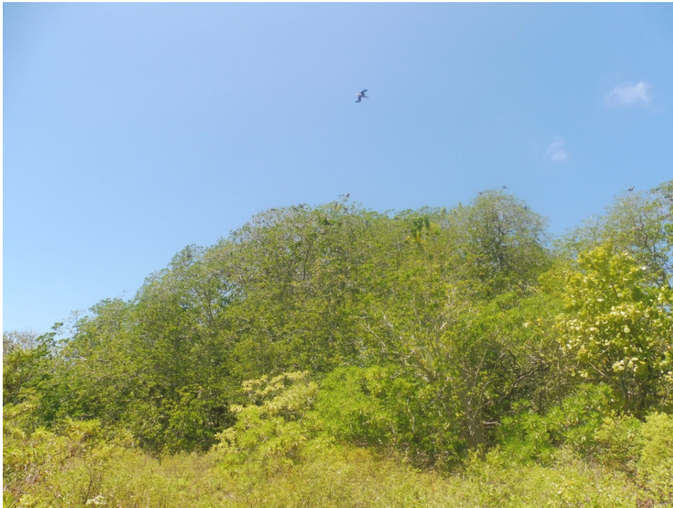
Photo 4. Forêt dense à Pisonia grandis avec en sous-bois un tapis de fougère Microsorium grossum (Polypodiaceae, « metua pua'a »).