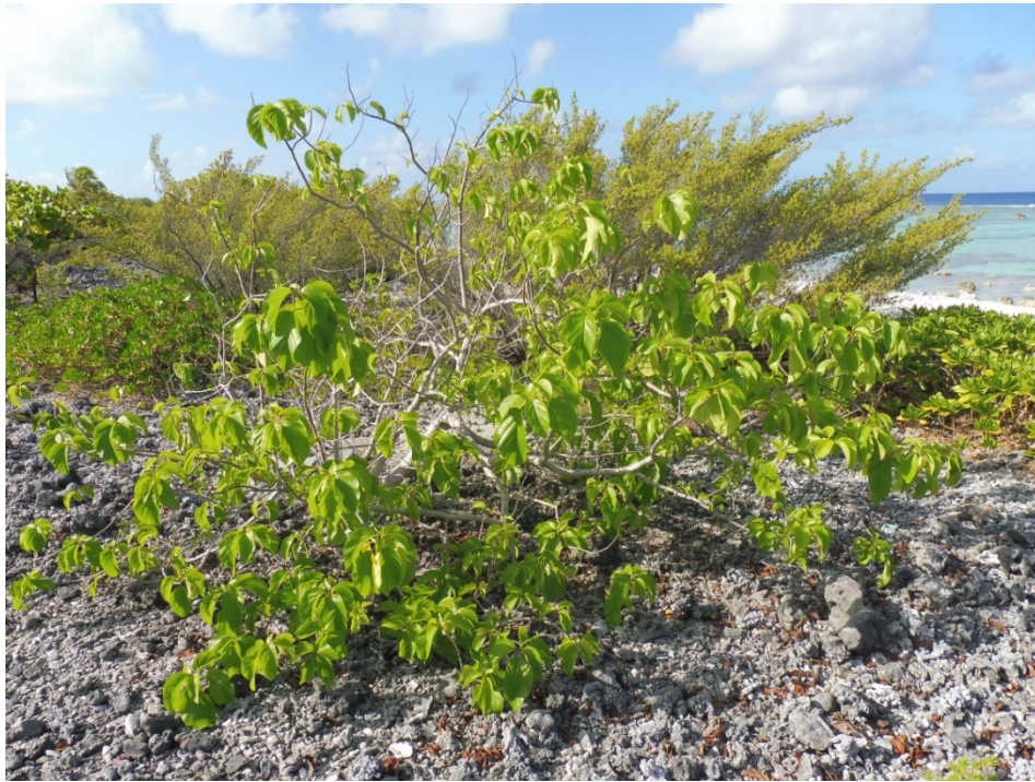
Photo 10. Heliotropium anomalum var. anomalum (Boraginaceae), petite herbacée indigène, relativement rare sur le motu Nord.