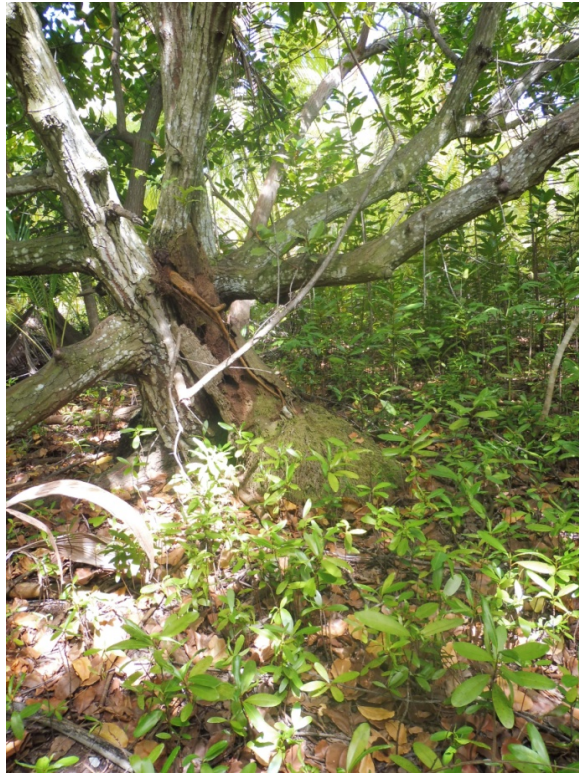
Photo 8. Végétation basse et ouverte avec le petit arbre Guettarda speciosa (Rubiaceae, « tāfano »), les arbustes Scaevola taccada (Goodeniaceae, « naupata ») et Timonius uniflorus (Rubiaceae) et les herbacées Boerhavia tetrandra (Boraginaceae, « nunanuna ») et Lepidium bidentatum (Brassicaceae, « nau ») sur le motu Sud.

Photo 7. Grand arbre indigène Calophyllum inophyllum (Calophyllaceae, « tamanu »), probablement une introduction polynésienne sur l'atoll de Tupai, avec un tapis de plantules en sous-bois indiquant une bonne régénération.