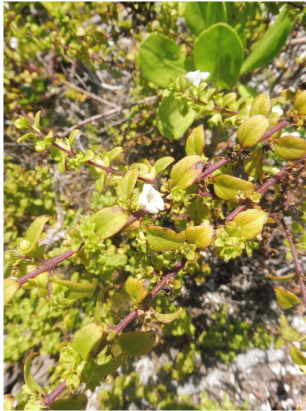
Photo 12. Figuier Ficus tinctoria subsp. tinctoria (Moraceae, « mati »), petit arbre d'introduction polynésienne, rare sur le motu Sud.