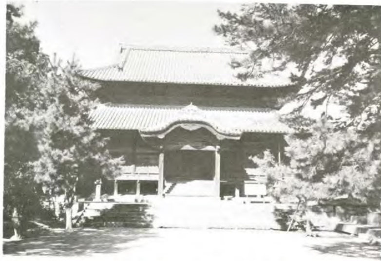
周防國分寺金堂 (重要文化財佛像などを安置)