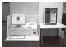
自動貸出機と本の除菌BOX

幅広い年齢層を対象としています。学生の利用も多く、用途に合わせた様々なサービスを行っています。