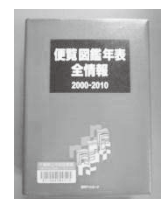
便覧図鑑年表全情報

国内で刊行された図鑑等 1 万数千点の概要を主題ごと、資料のタイプごとに一覧できる。