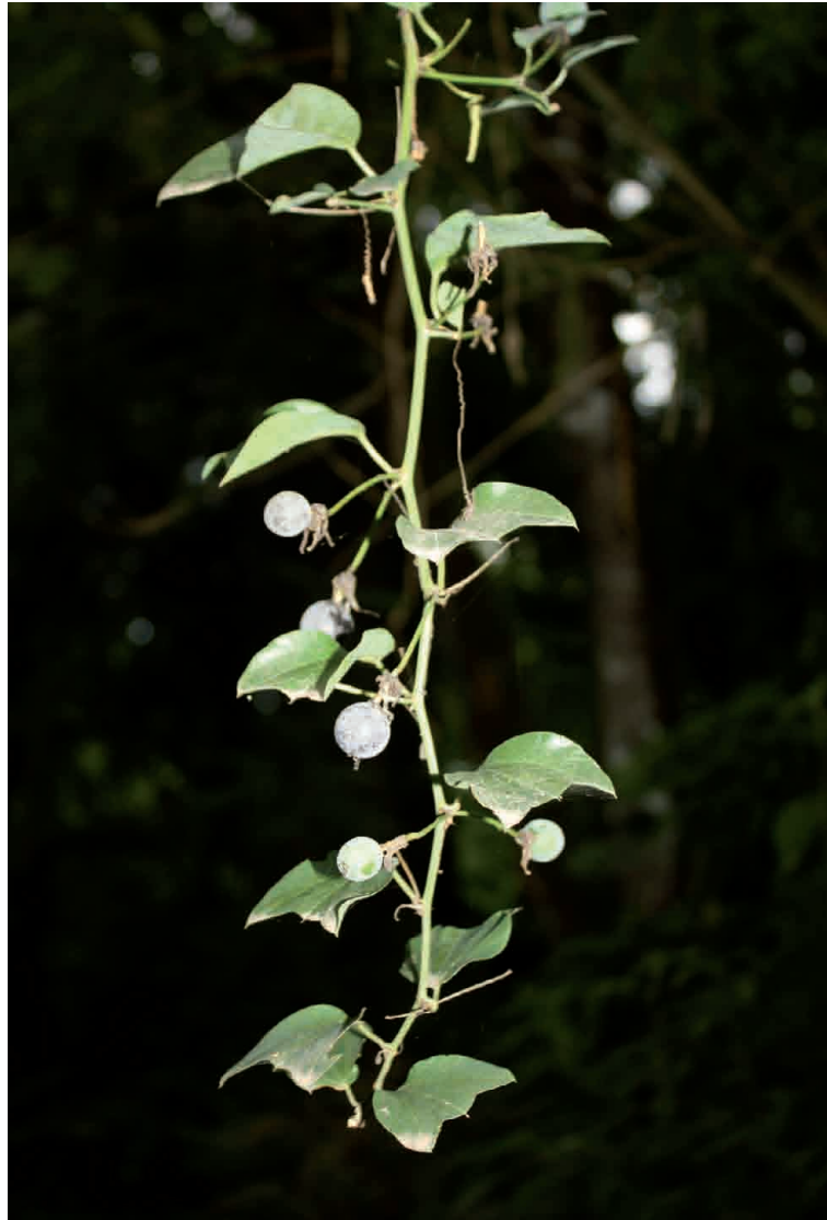
Figura 2. Passiflora urnifolia . Rama con frutos (noviembre). Parque Alisos, 1050 m s.n.m. Fotografía: H. Ayarde.