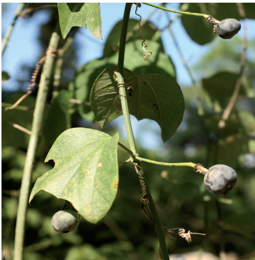
Figura 4. Passiflora urnifolia . Frutos (diciembre). Parque Alisos, 940 m s.n.m.