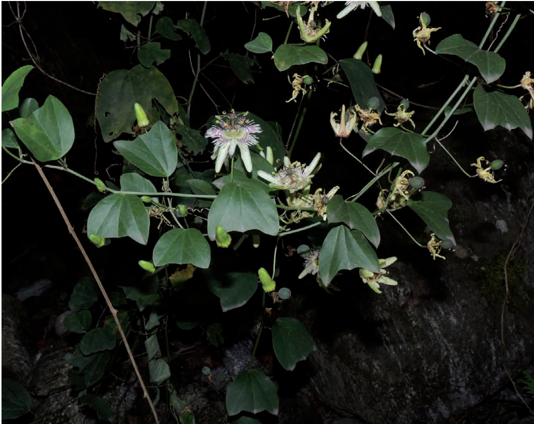
Figura 1. Passiflora urnifolia . Rama florífera y aspecto vegetativo (septiembre), Parque Alisos, 950 m s.n.m.

El autor de la especie, Henry Hurd Rusby, fue un farmacéutico, médico y botánico estadounidense del siglo XIX, quien en la segunda mitad de 1921 dirigió una célebre expedición botánica a la Amazonía boliviana (The Mulford Biological Exploration of the Amazon Basin), en la cual se colectaron numerosas entidades novedosas para la ciencia. El nombre del género proviene de passi , que significa «pasión, sufrimiento» y flora , «flor», y se refiere a que diversas parte de la planta y la flor de la especie más conocida se creía representaban diferentes personas y objetos relacionados con la crucifixión de Cristo, y por ello se la conoce aún hoy como Flor de la Pasión. El epíteto específico proviene de urna («ánfora, jarra») y folia («hoja») y hace alusión a la forma particular que tienen sus hojas, que se mejan un recipiente.