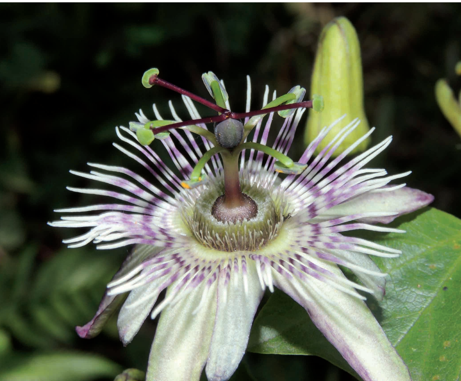
Figura 3. Passiflora urnifolia . Flor abierta.