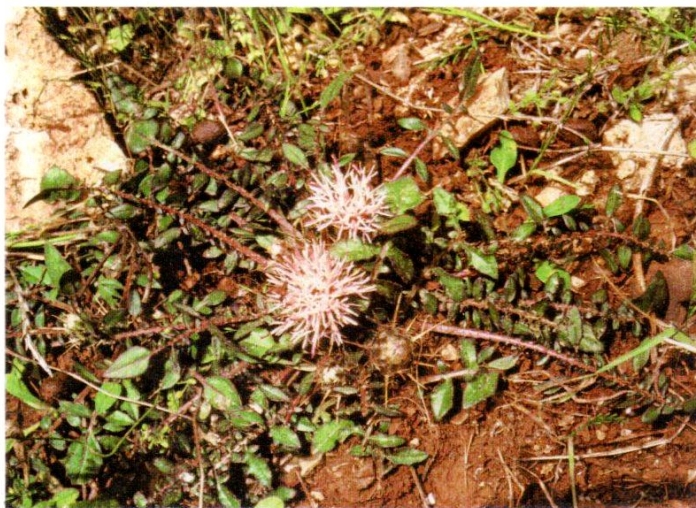
Centaurea raphanina mixta