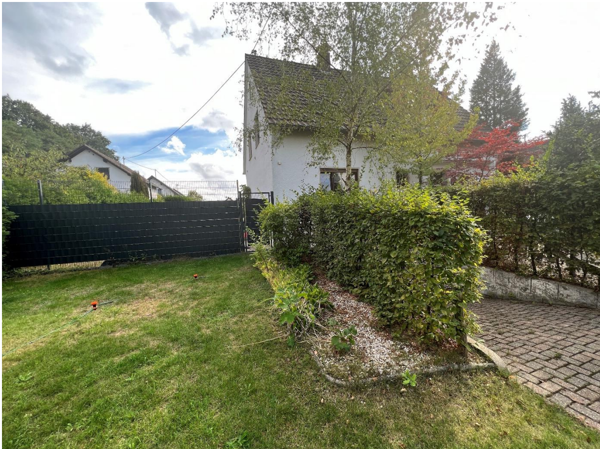
Abbildung 3 Vorgartenbereich, Blick nach Süd, 07.09.22