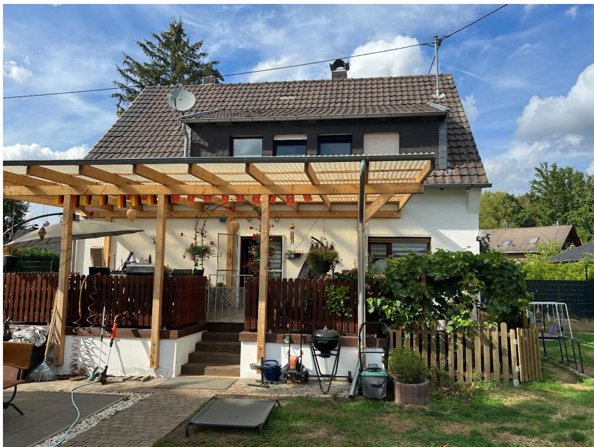
Abbildung 5 Rückwärtige Ansicht, Blickrichtung Nord, 07.09.22

Die Gesamtfläche des Grundstücks beträgt etwa 1751 m 2 , wovon derzeit ungefähr 141 m 2 überbaut sind. Im Rahmen der Projektrealisierung sollen insgesamt etwa 929 m 2 versiegelt werden.