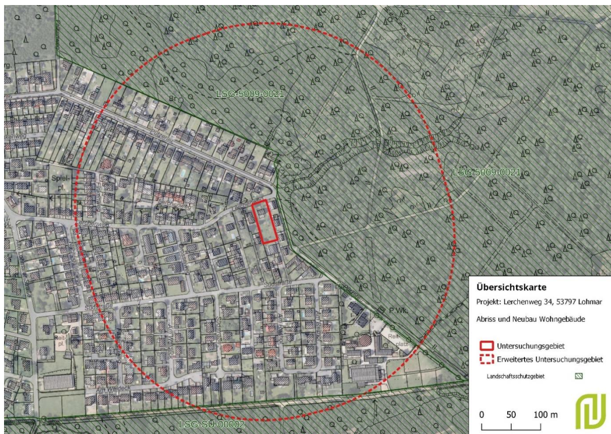
Abbildung 7 Übersichtskarte, eigene Darstellung nach Geobasis NRW