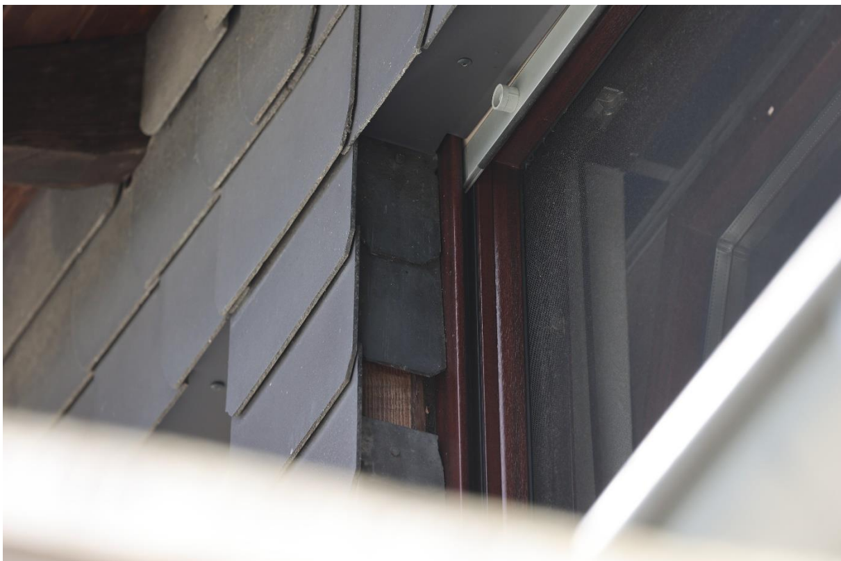
Abbildung 9 Detailansicht Dachbereich Hauptgebäude, 07.09.22