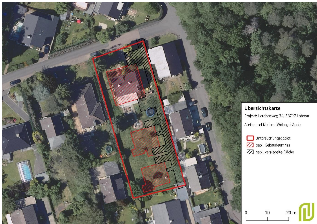
Abbildung 1 Übersichtskarte mit gepl. Gebäudeumriss, eigene Darstellung nach Geobasis NRW