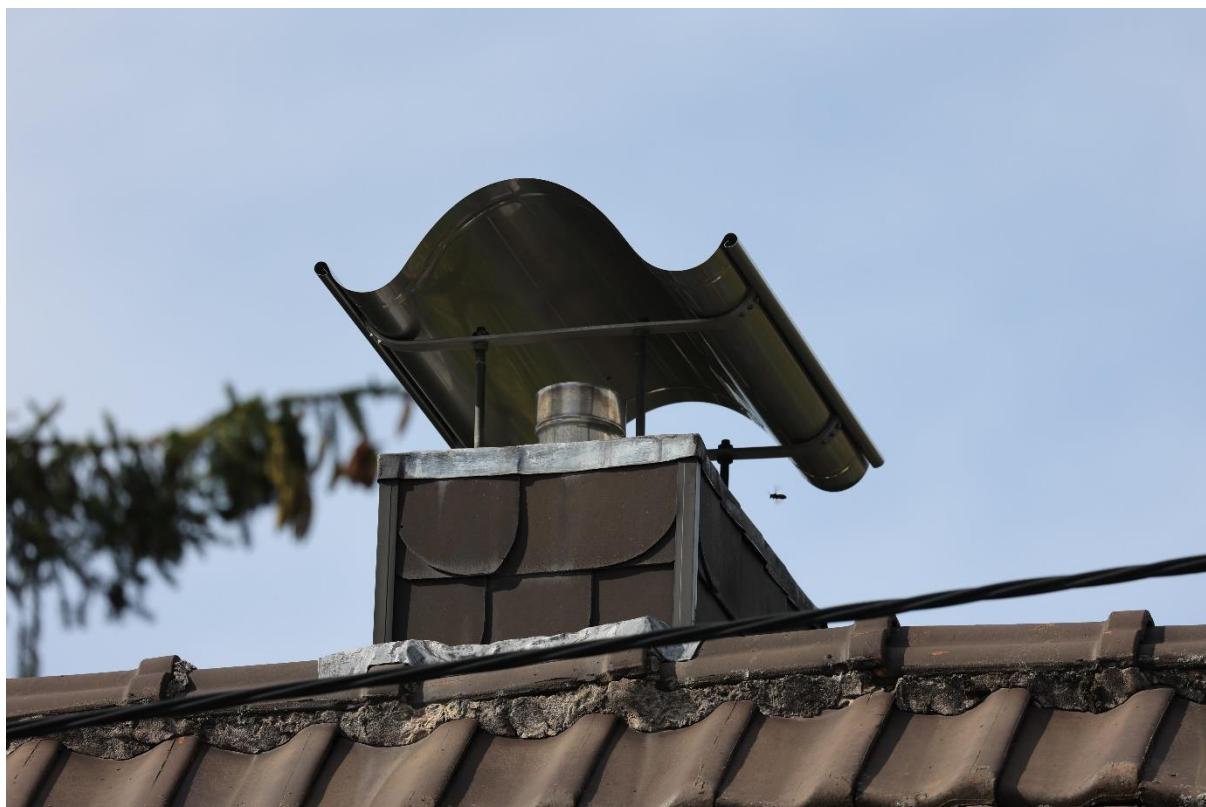
Abbildung 10 Abbildung 11 Kamin mit einfliegender Hornisse, 07.09.22