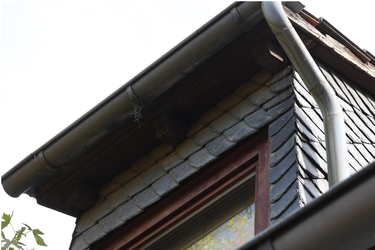
Abbildung 8 Detailansicht Dachbereich Hauptgebäude, 07.09.22