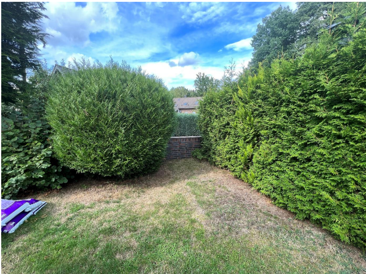
Abbildung 4 Vorgartenbereich, Blick nach Nord, 07.09.22