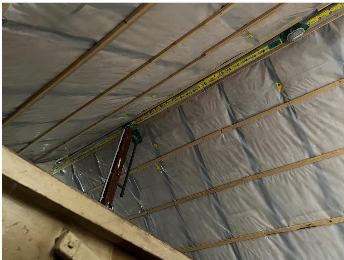
Abbildung 11 Dachstuhl Innenansicht, 07.09.22