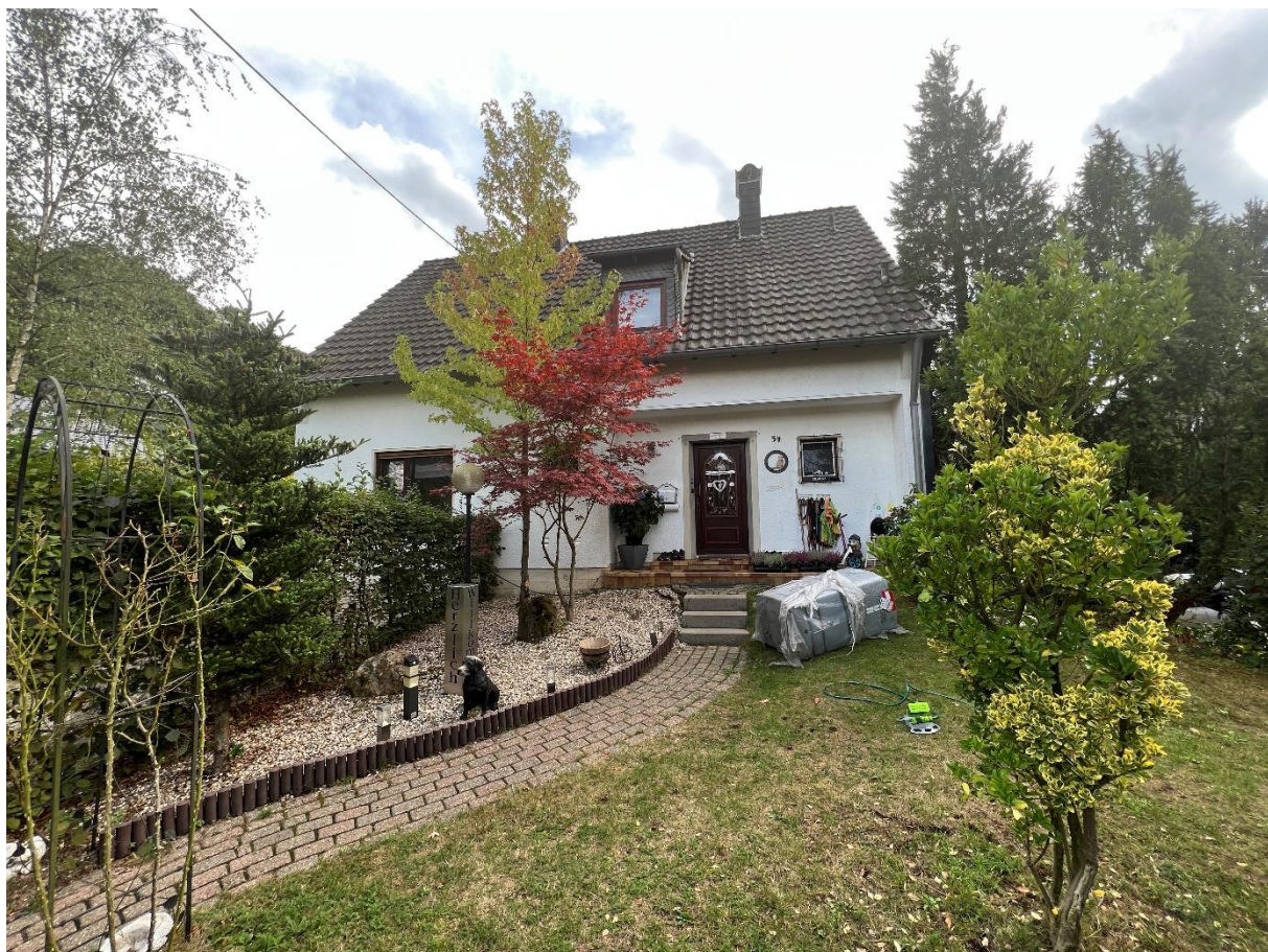
Abbildung 2 Eingangsbereich, Blick nach Süd, 07.09.22