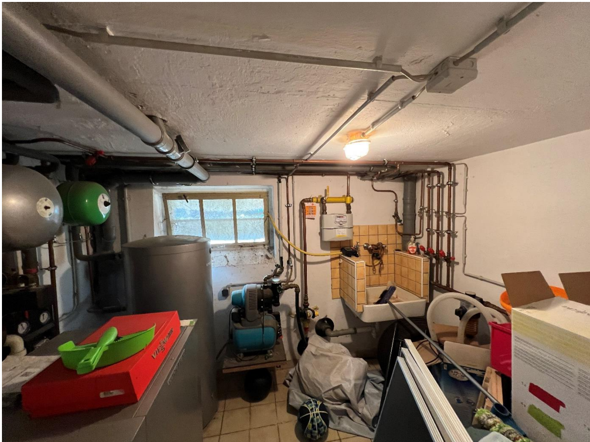
Abbildung 12 Keller Innenansicht, 07.09.22