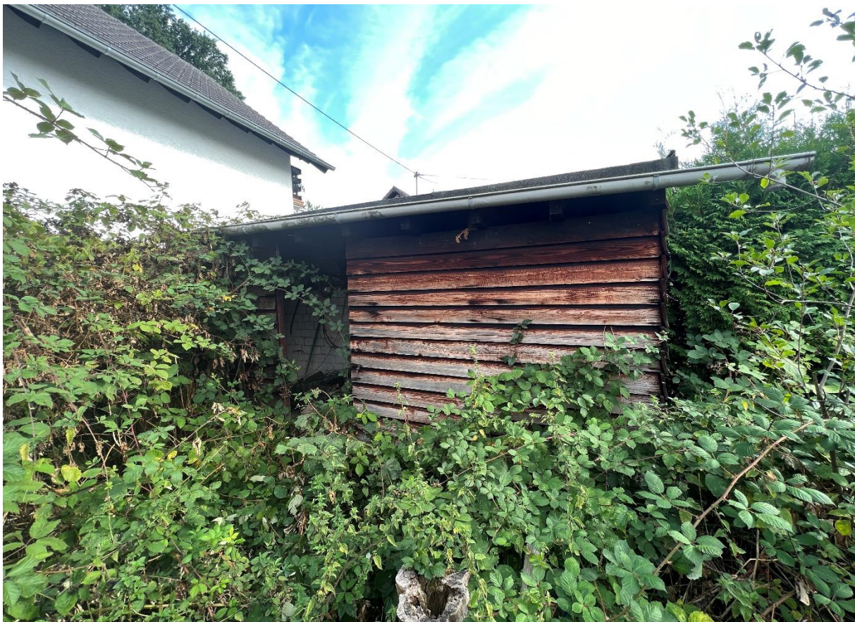
Abbildung 13 Gartenschuppen, 07.09.22