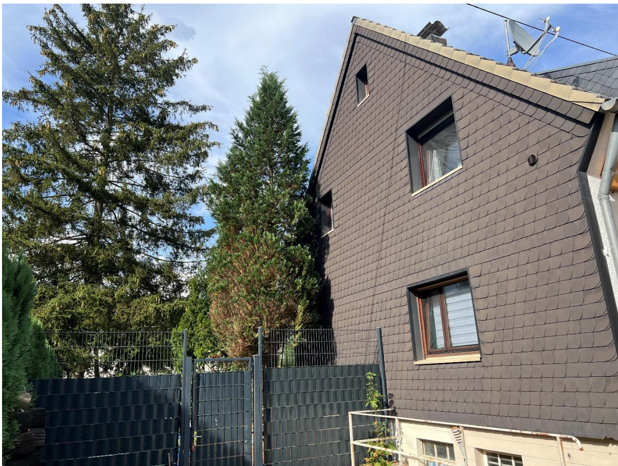
Abbildung 15 Blick auf die Westseite des Hauses, Blickrichtung NNO, 07.09.22