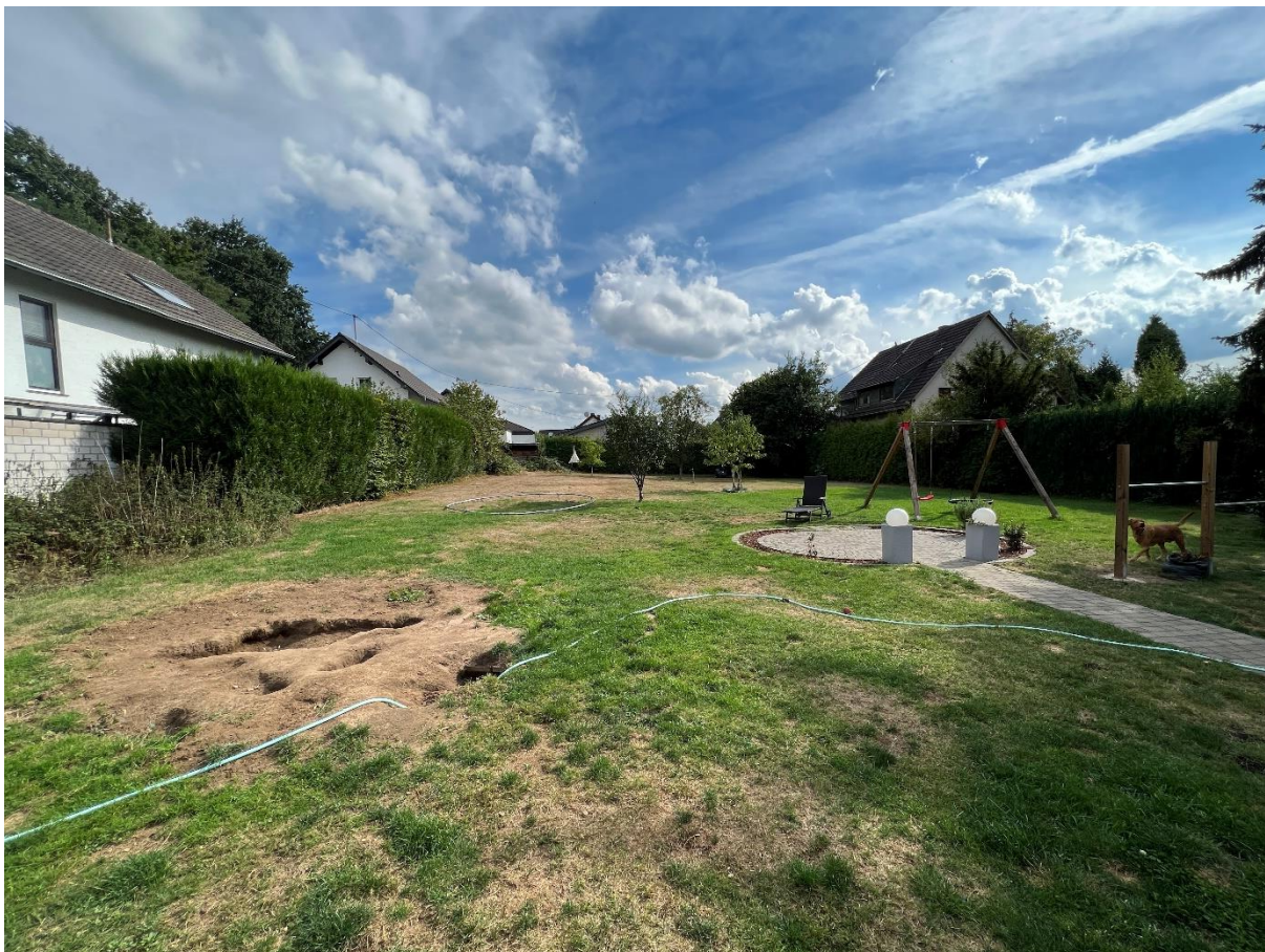
Abbildung 14 Garten, Blickrichtung SSO, 07.09.22