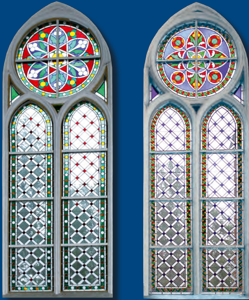
Viļakas Jēzus Sirds Romas katoļu draudzes dievnama logu vitrāžas