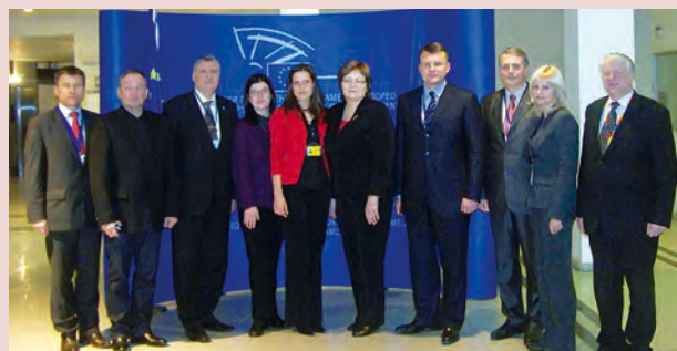
Kopā ar Latvijas pašvaldību pārstāvjiem ES Reģionu komitejā

Šo piecu gadu laikā no eiroompoptimistes esmu pārtapusi par kritisku eiroomprealisti, atliek vien cerēt, ka turpmākie gadi mani nepadarīs par eiropesimisti.