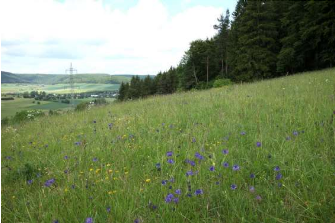
Nr. 9 Kalk-Magerrasen [6210]: Sehr artenreicher Halbtrockenrasen an der Mühlhalde östlich Gutmadingen mit Kugel-Teufelskralle ( Phyteuma orbiculare ) – im Bild –, Heideröschen ( Daphne cneorum ) und Hochgebirgs-Hahnenfuß ( Ranunculus breyninus ). Siegfried Demuth, 1.6.2012.