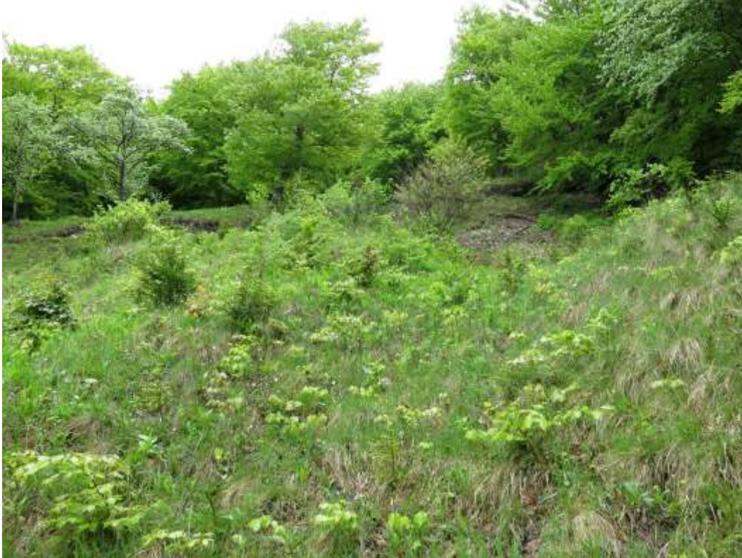
Nr. 15 Kalk-Magerrasen [6210]: Montane Blaugras-Halde (Laserpitio-Seslerietum) auf Mergelsteilhang mit Immergrüner Segge ( Carex sempervirens) und Scheiden-Kronwicke ( Coronilla vaginalis), Länge südöstlich Gutmadingen.