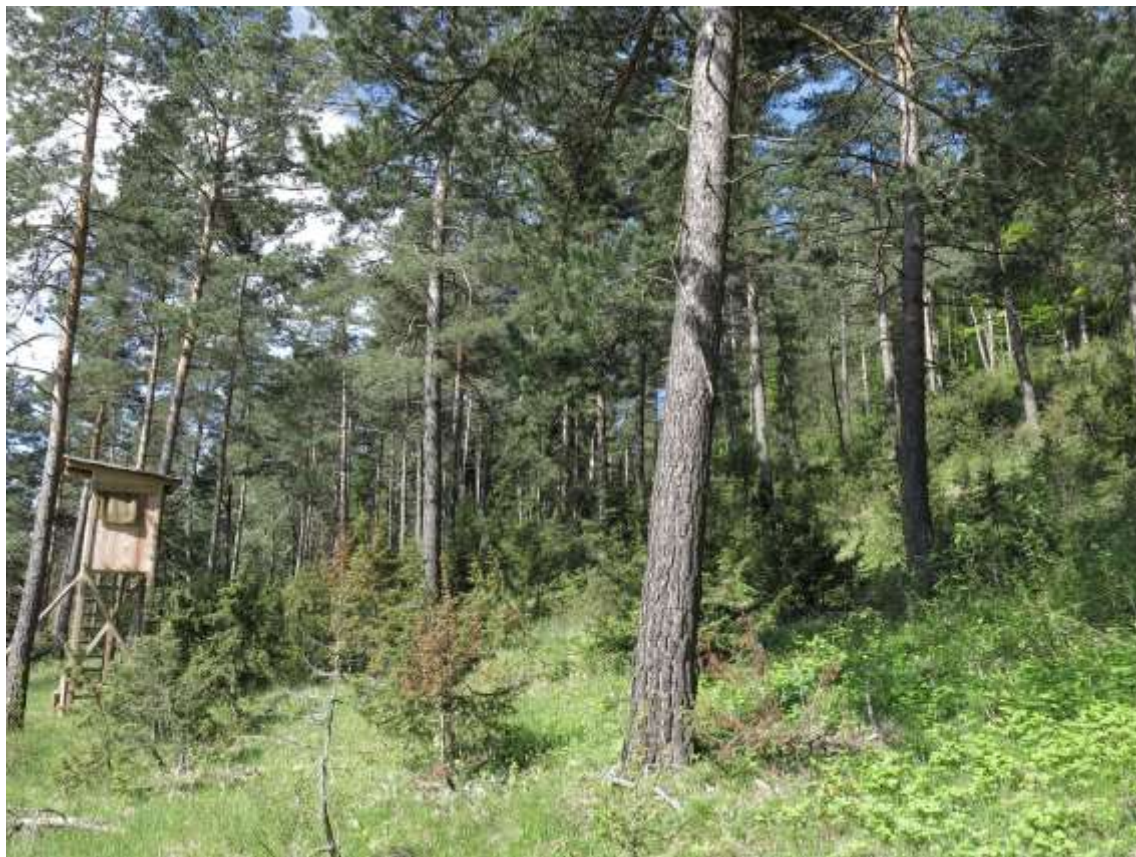
Nr. 7 Wacholderheide [5130]: Wacholderheide am Himmelberg nördlich Ippingen mit Wald-Kiefer ( Pinus sylvestris).