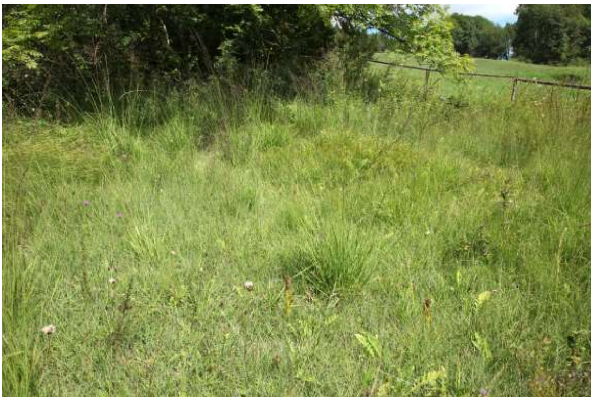
Nr. 24 Kalkreiche Niedermoore [7230]: Niedermoor mit Vegetation eines Kleinseggen-Rieds basenreicher Standorte im Gewann Beerenzipfel nördlich Ippingen mit Fleischrotem Knabenkraut ( Dactylorhiza incarnata ) und Breitblättrigem Wollgras ( Eriophorum latifolium ). Siegfried Demuth, 8.8.2012.