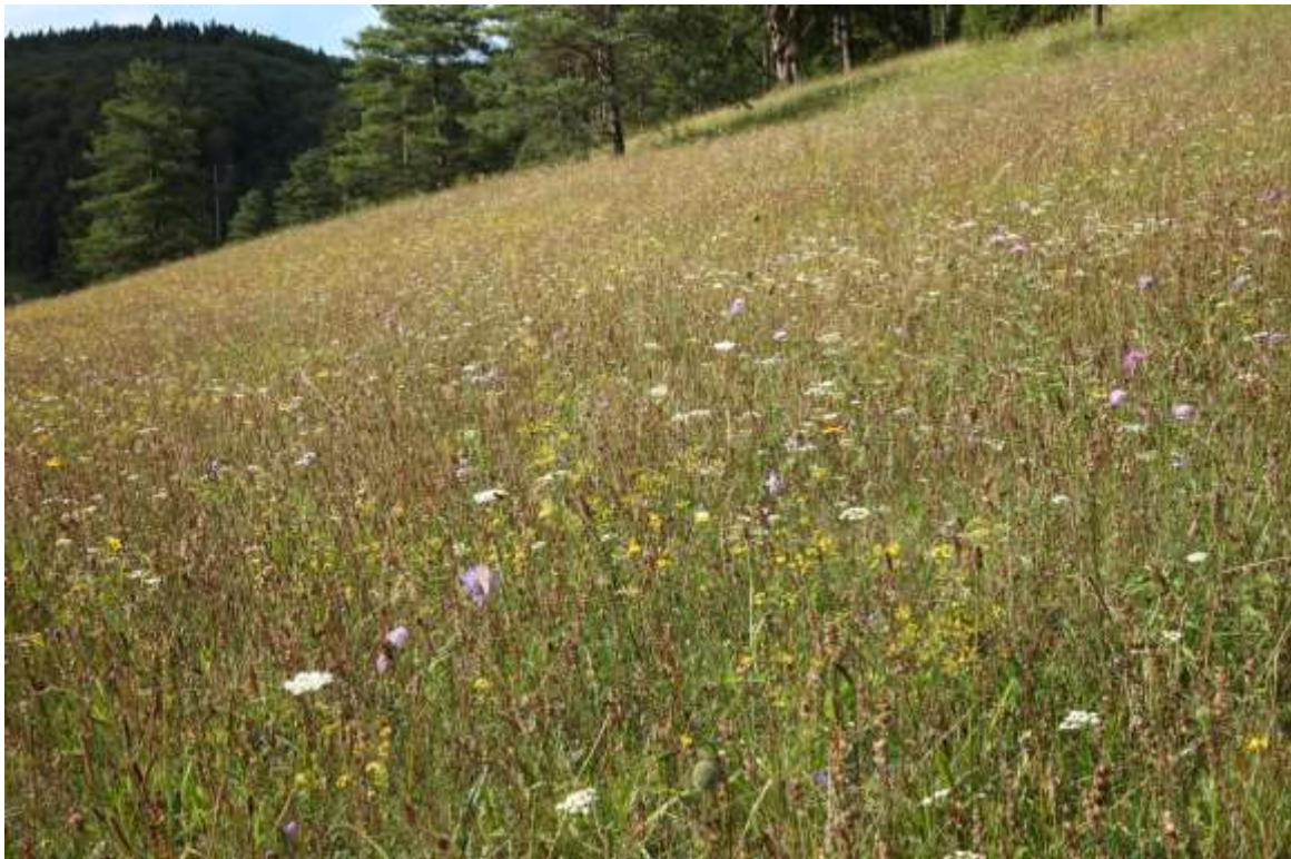
Nr. 13 Kalk-Magerrasen [6210]: Sehr artenreicher Halbtrockenrasen im Amtenhauser Tal mit Vorkommen des Kreuz-Enzians ( Gentiana crutiata ). Siegfried Demuth, 8.8.2012.