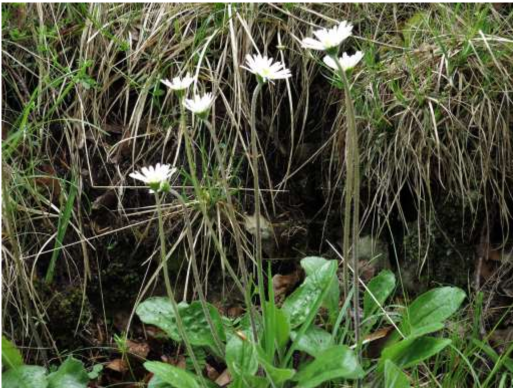
Nr. 16 Alpenmaßliebchen ( Aster bellidiastrum), eine typische Art der montanen Blaugras-Halde; eine Art der Vorwarnliste auf der Roten Liste Baden-Württembergs.