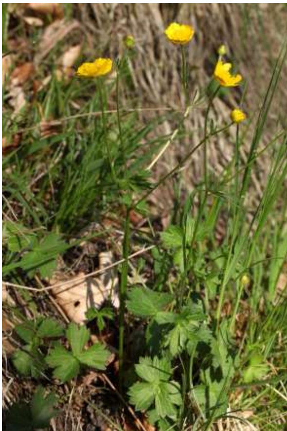
Nr. 12 Hochgebirgs-Hahnenfuß ( Ranunculus breyninus), ein Eiszeitrelikt; typische Art der Halbtrockenrasen und lichten Kiefernwälder auf der Baaralb. In Baden-Württemberg gefährdet.