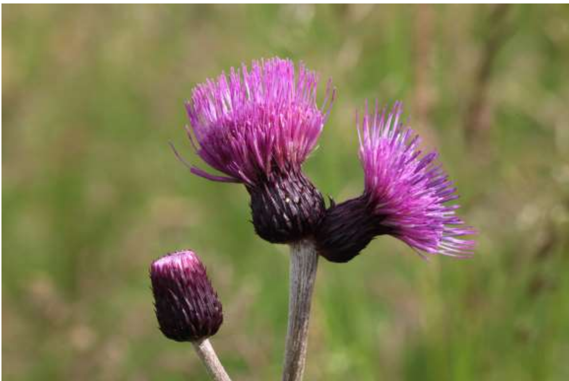
Nr. 26 Bach-Kratzdistel ( Cirsium rivulare ), Vorkommen in der Kalk-Tuffquelle im Klausemer Tal sowie auf quelligen Standorten in einigen Magerwiesen