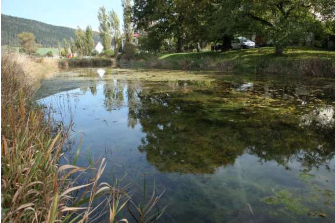
Nr. 1 Kalkreiche, nährstoffarme Stillgewässer mit Armeleuchteralgen [3140]: Donau-Altwasser bei Hintschingen.