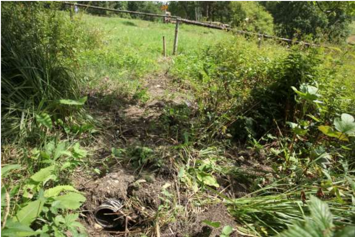
Nr. 25 Kalkreiche Niedermoore [7230]: Niedermoor im Gewann Beerenzipfel nördlich Ippingen mit Rohr zum einleiten von Quellwasser aus einer angrenzenden Wiese. Siegfried Demuth, 8.8.2012.