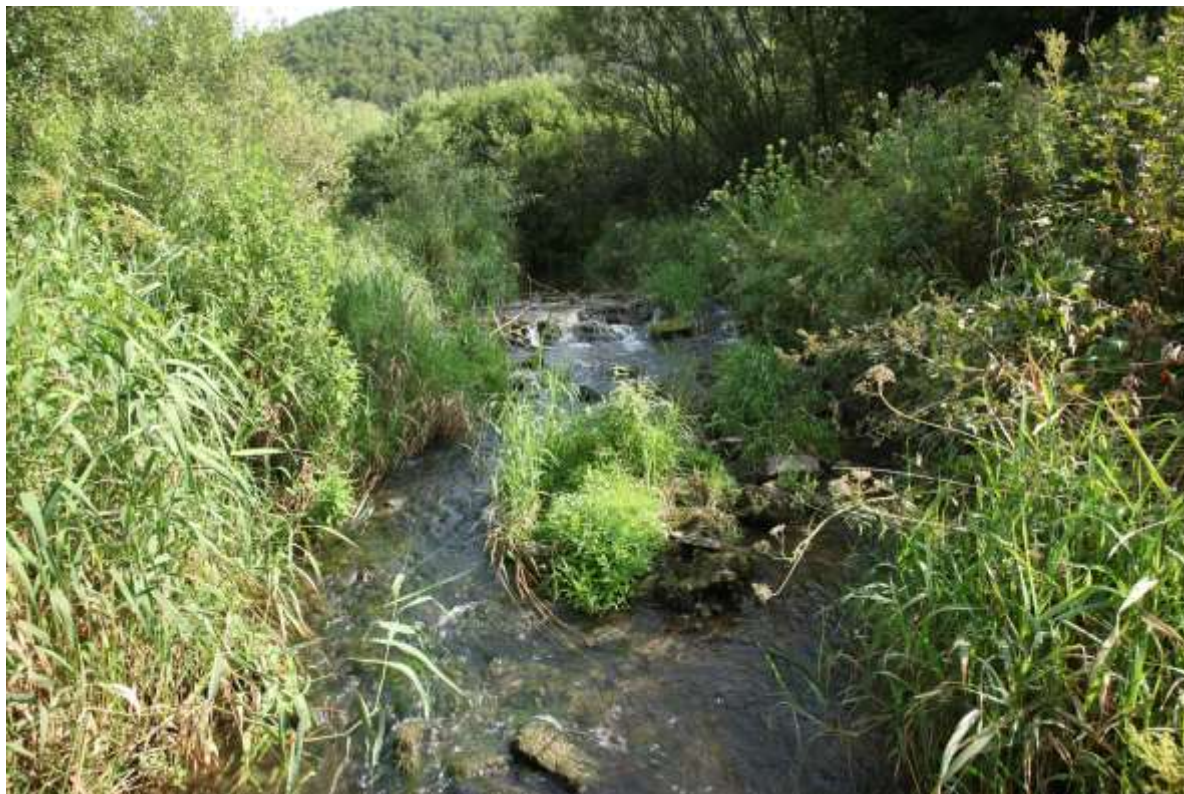
Nr. 3 Fließgewässer mit flutender Wasservegetation [3260]: Krähenbach. Siegfried Demuth. 9.8.2012