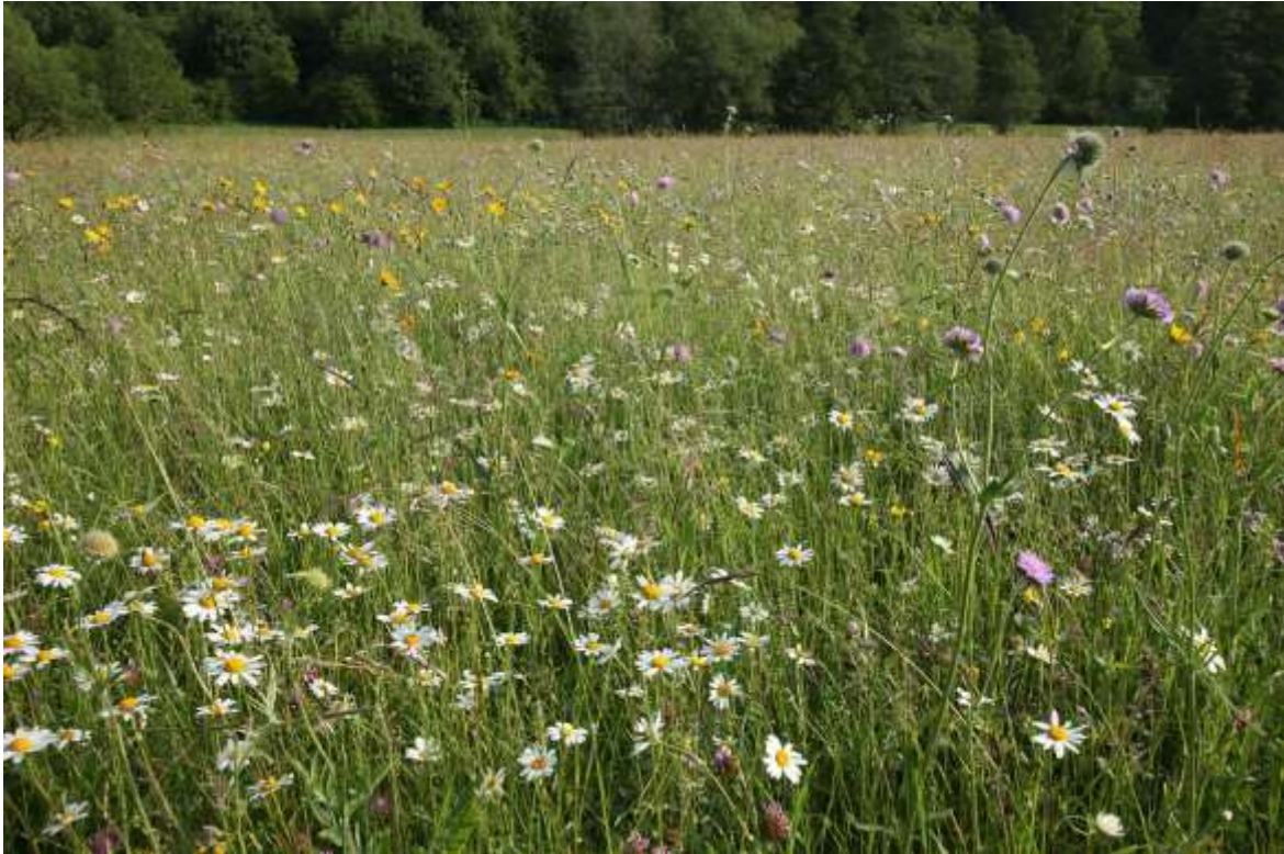
Nr. 19 Magere Flachland-Mähwiesen [6510]: Typische Glatthafer-Wiese mit Erhaltungszustand B mit Perücken-Flockenblume ( Centaurea pseudophrygia) in der Donauaue östlich Immendingen.