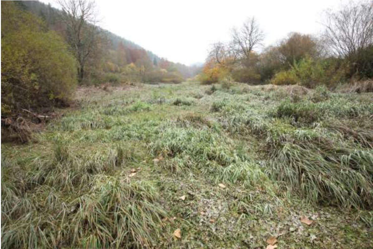
Nr. 5 Schlammige Flussufer mit Pioniervegetation [3270]: Versickerungsstrecke der Donau östlich Immendingen bei Niedrigwasser.