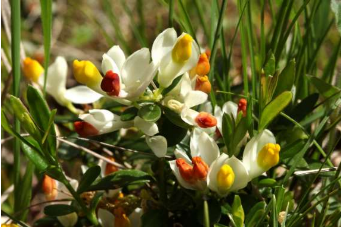
Nr. 11 Zwergbuchs ( Polygala chamaebuxus), ein Eiszeitrelikt; typische Art der Halbtrockenrasen und lichten Kiefernwälder auf der Baaralb. In Baden-Württemberg gefährdet.