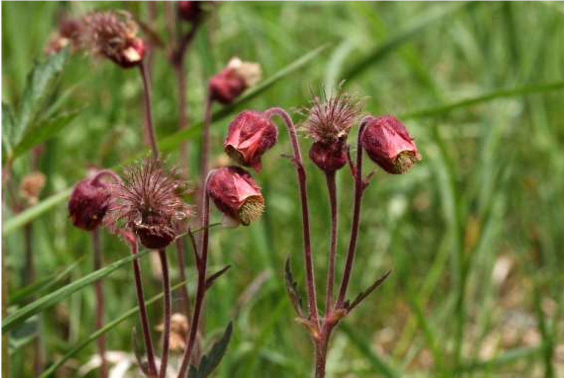
Nr. 21 Bach-Nelkenwurz ( Geum rivale), typischer Feuchtezeiger in der Kohldistel-Glatthafer-Wiese; Vorkommen vor allem in der Donauaue und im Pfaffental.