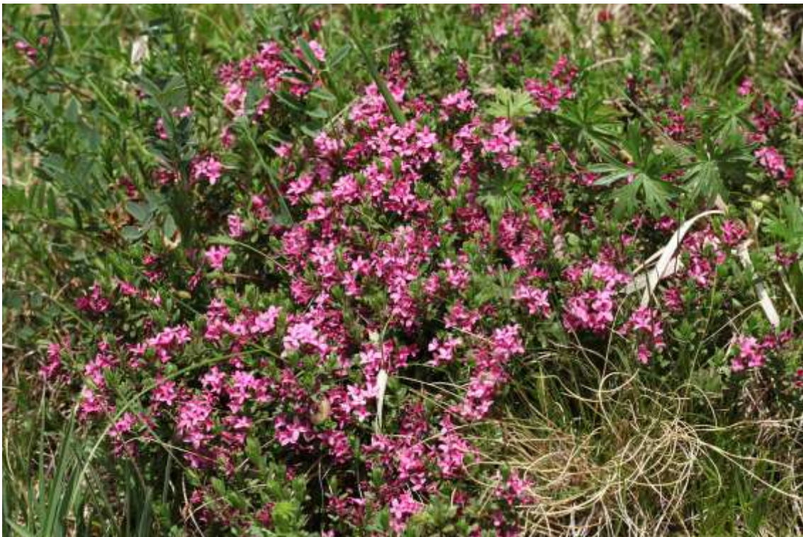
Nr. 10 Heideröschen ( Daphne cneorum), ein Eiszeitrelikt; typische Art der Halbtrockenrasen und lichten Kiefernwälder auf der Baaralb. In Baden-Württemberg stark gefährdet, 11.5.2012.