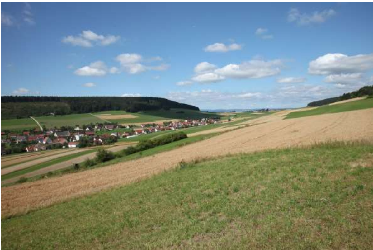
Bild 28 Teilgebiet „Waldgebiet Möhringer Berg II und Bächetal“ mit Blick auf Ippingen. Siegfried Demuth, 8.8.2012.