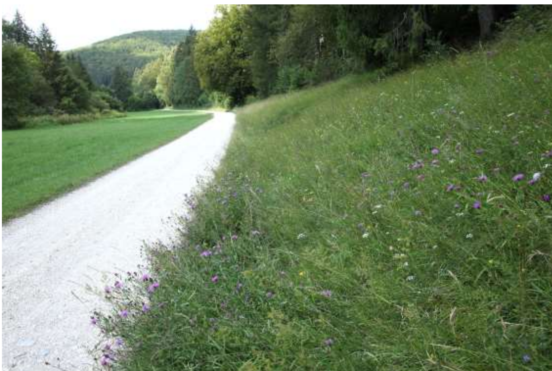
Nr. 14 Kalk-Magerrasen [6210]: Halbtrockenrasen auf Böschung entlang eines Waldrands im Pfaffental.