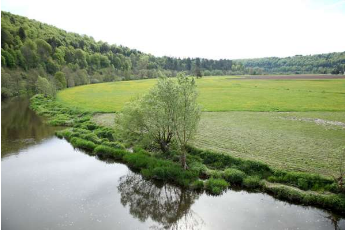
Nr. 29 Teilgebiet „Donautal“ mit Blick auf die Donauaue östlich Immendingen.