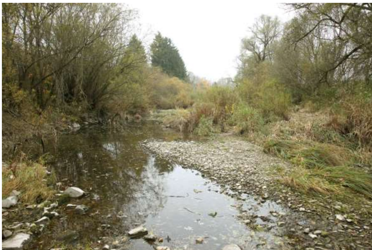
Nr. 4 Schlammige Flussufer mit Pioniervegetation [3270]: Versickerungsstrecke der Donau östlich Immendingen bei Niedrigwasser.