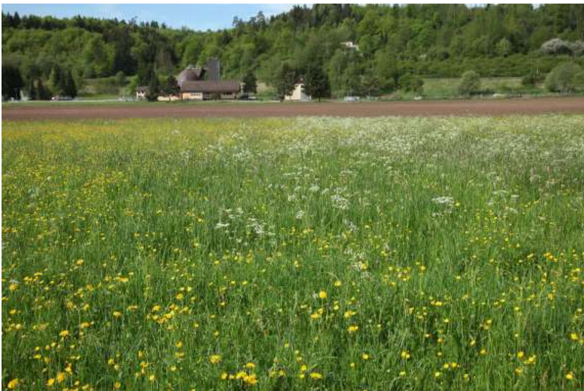
Nr. 22 Linke Bildhälfte: Magere Flachland-Mähwiesen [6510]: Typische Glatthafer-Wiese mit Perücken-Flockenblume ( Centaurea pseudophrygia); rechte Bildhälfte: Fettwiese mittlerer Standorte mit viel Wiesen-Kerbel ( Anthriscus sylvestris) als Nährstoffzeiger (kein LRT). Donauaue östlich Immendingen.