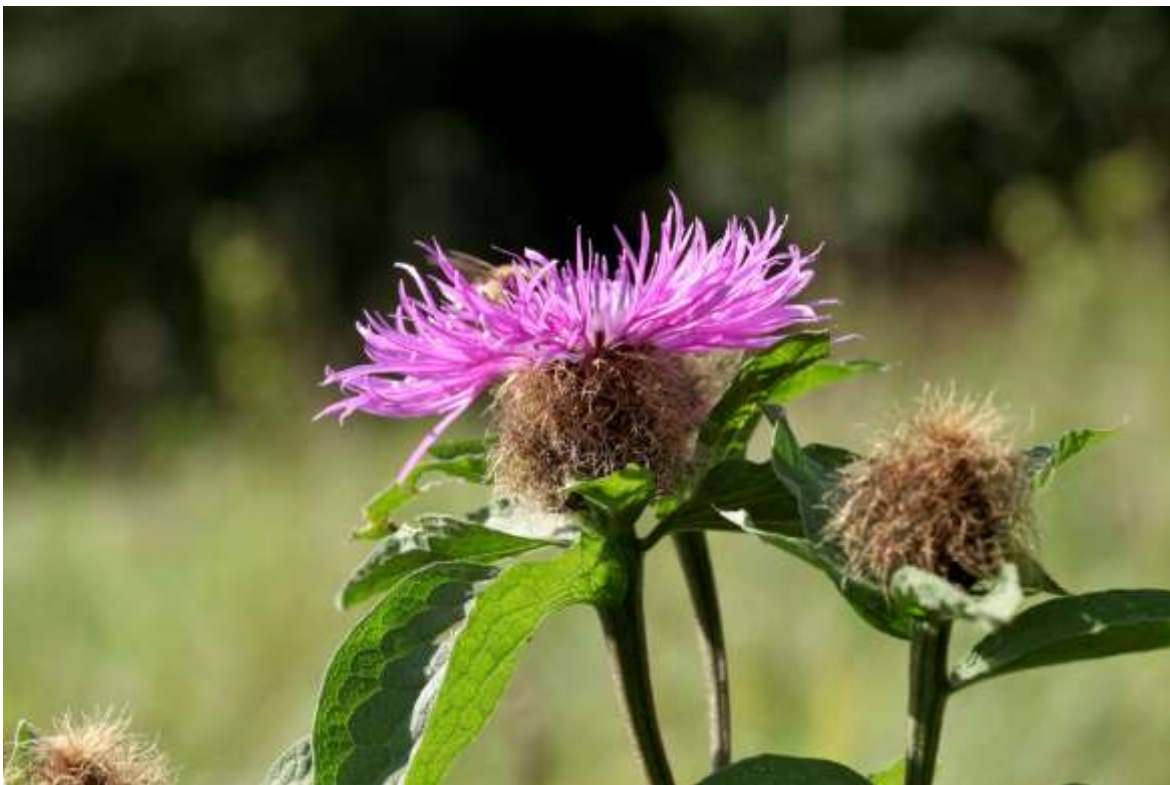
Nr. 20 Perücken-Flockenblume ( Centaurea pseudophrygia ), typische Art in den Beständen der Glatthafer-Wiesen in der Donauaue östlich Immendingen; in Baden-Württemberg gefährdet. Siegfried Demuth, 9.8.2012.