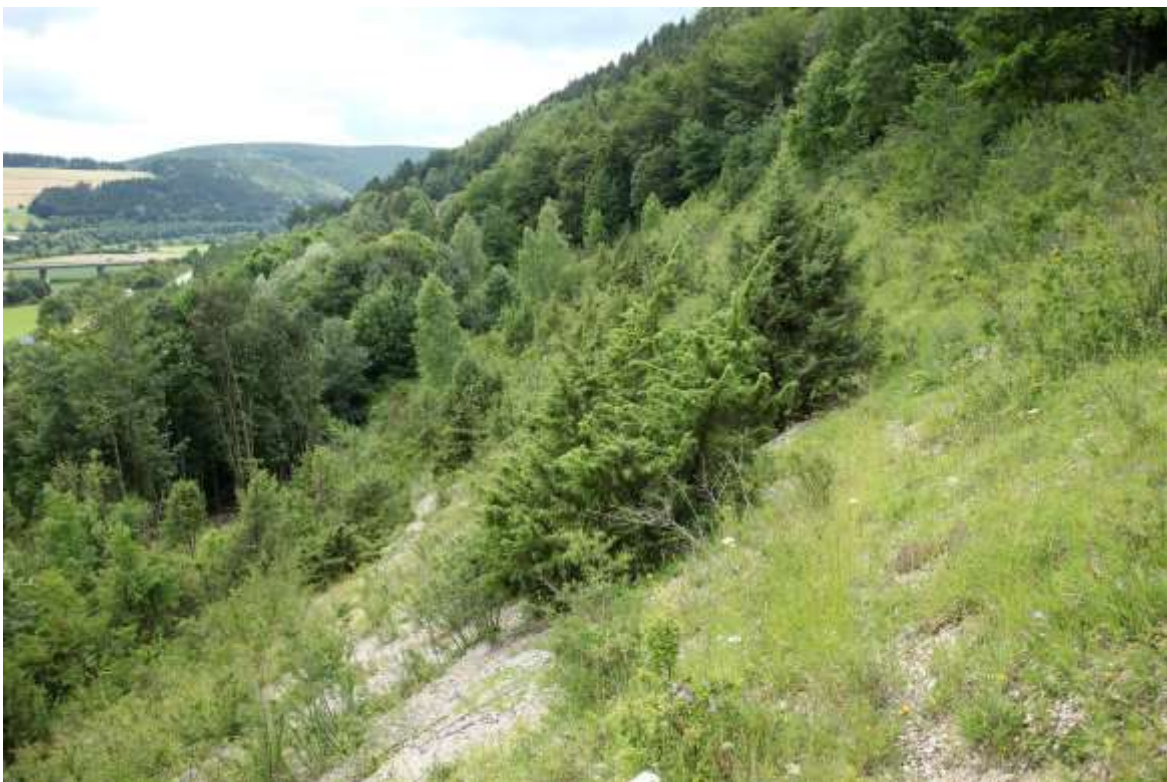
Nr. 6 Wacholderheide [5130] mit Kalkschutthalde [8160*]: Maurershalde westlich Hintschingen.