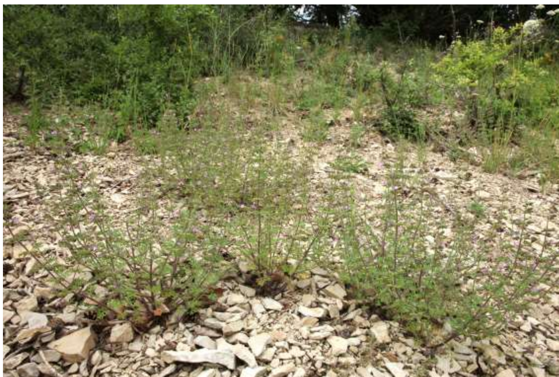
Nr. 8 Kalk-Pionierasen [6110*]: Kalk-Pionierasen auf Steinschutthalde mit Trauben-Gamander ( Teucrium botrys) an der Maurershalde westlich Hintschingen.