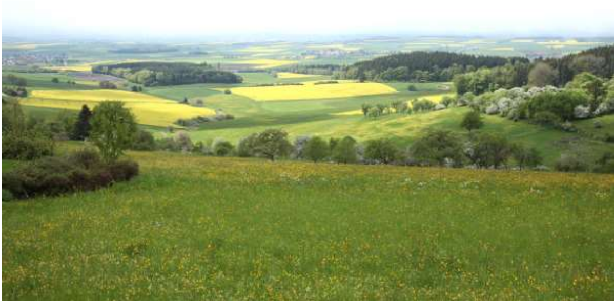
Nr. 27 Teilgebiet „Haugenrain“ bei Öfingen mit Blick auf die Baar und den Schwarzwald.