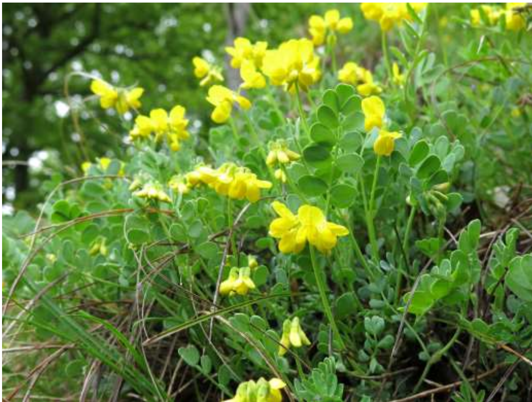
Nr. 17 Scheiden-Kronwicke ( Coronilla vaginalis), eine typische Art der montanen Blaugras-Halde, nach der Roten Liste Baden-Württemberg gefährdet.