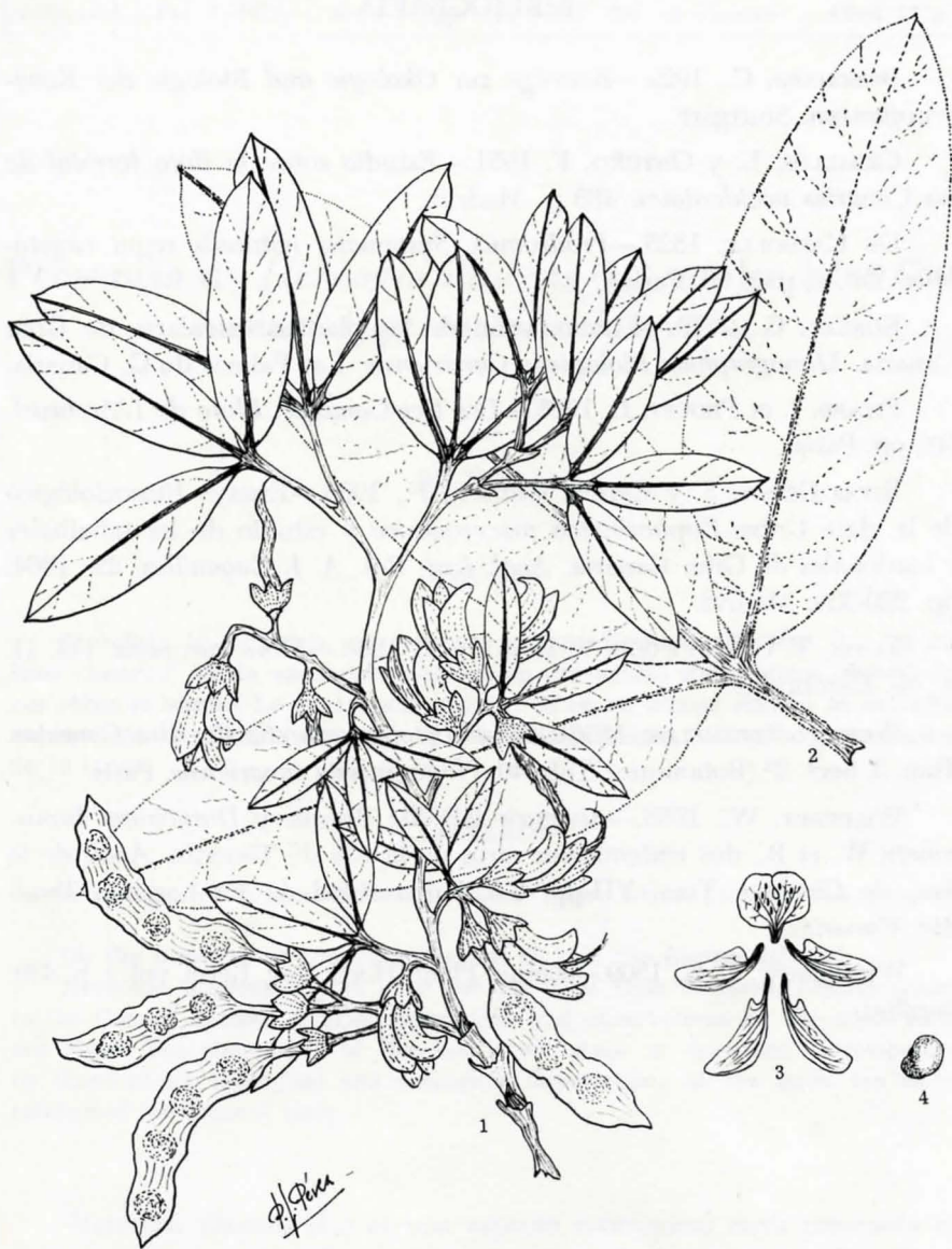
Lám.: I.— Anagyris latifolia Brouss. 1: rama florífera y fructífera. 2: hoja muy desarrollada de un brote joven. 3: morfología de la corola. 4: semilla. (X 3/5).