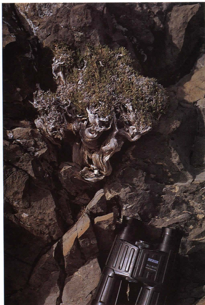
Fig. 2. Ejemplar viejo comido por las cabras, Montaña Cardones.