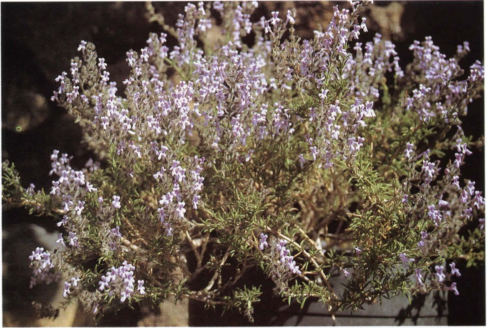
Fig. 4. Ejemplar cultivado en flor. Jandía, Junio de 1992.

La conservación de Salvia herbanica pasa necesariamente por la protección efectiva de sus poblaciones naturales. Todas las poblaciones conocidas, a excepción de las de Cuchillo de Valle Largo, se encuentran dentro de los límites de espacios naturales protegidos, lo que debería de hacer más fácil la aplicación de medidas de protección. En la futura redacción del Plan de Uso y Gestión del Parque Natural de Pozo Negro, en el que se encuentran 5 de las 7 localidades de Salvia herbanica , deben contemplarse tales medidas. A nuestro juicio, el vallado de pequeñas áreas al pie de los riscos en los que crece la especie, es la medida más efectiva, ya que, al mantener las cabras fuera, permite la regeneración y expansión de la misma.