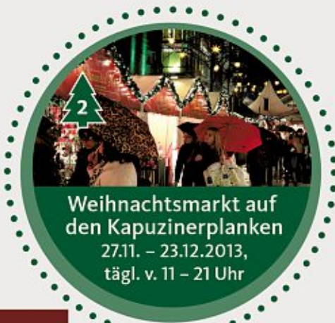
2 Weihnachtsmarkt auf den Kapuzinerplanken 27.11. – 23.12.2013, tägl. v. 11 – 21 Uhr