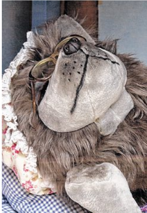
// Der „böse Wolf“ wartet auf dem Paradeplatz auf Rotkäppchen...

MÄRCHENWALD AUF DEM PARADEPLATZ: Prinzen, Königinnen, altbekannte Figuren und zauberhafte Gestalten: Nach der Premiere im vergangenen Jahr kehrt der Märchenwald der Schaustellerbetriebe Rick zurück auf den Mannheimer Paradeplatz.