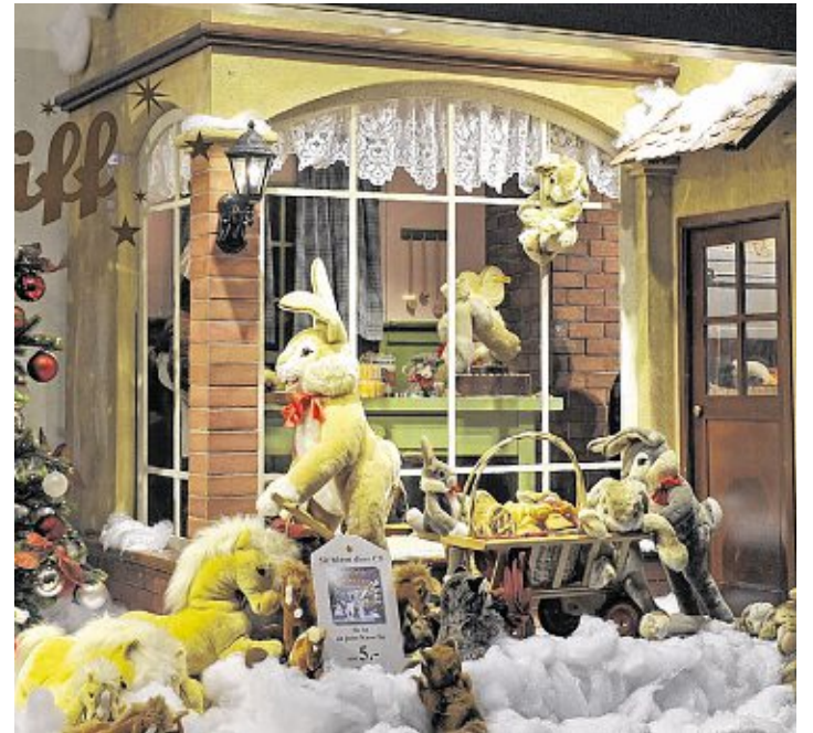
// Immer wieder ein Vergnügen: Über 200 Steiff-Tiere säumen das Schaufenster der Galeria Kaufhof P1 am Mannheimer Paradeplatz.