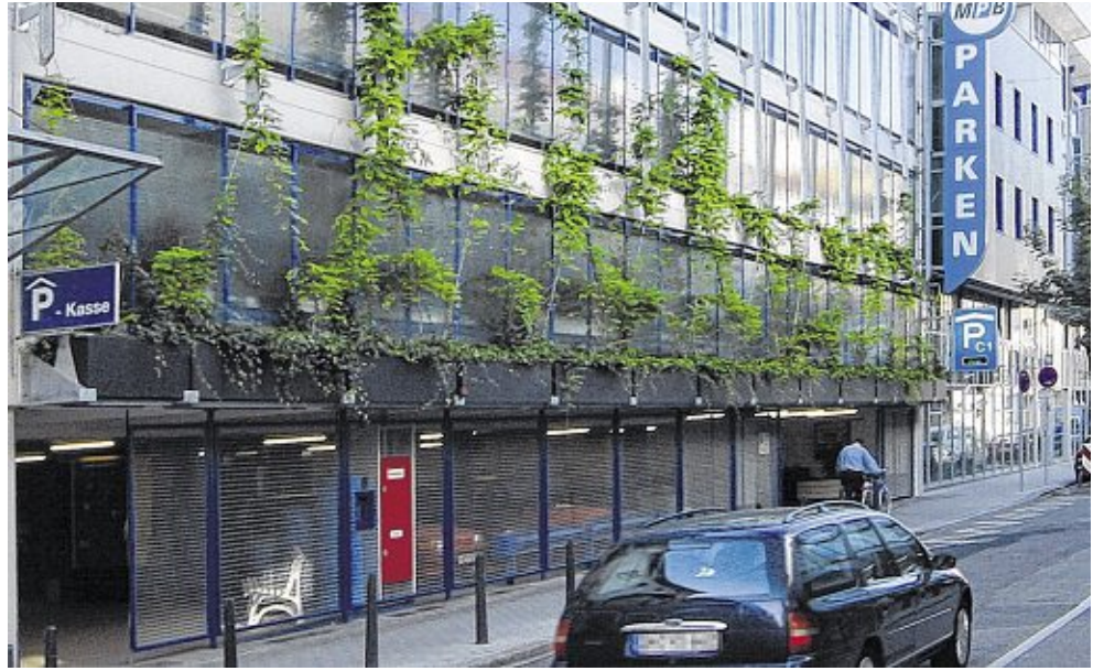
// Zahlreiche Parkhäuser und Tiefgaragen garantieren eine unbeschwernte Anfahrt in die Mannheimer City

Das gilt insbesondere für die Vorweihnachtszeit, denn für diese Tage stellen die Parkhausbetriebe ein ganz besonderes Angebot zur Verfügung: Sie bieten an allen Adventssamstagen in den Parkhäusern in D5, U2, H6 und im Collincenter Stellplätze an – und zwar völlig kostenlos. Und auch den kostenlosen Park&Ride-Service ab dem Mannheimer Friedensplatz wird es an den Dezembersamstagen wieder geben. Dort stehen 1900 kostenlose Parkflächen bereit. Mit der Straßenbahn können die Besucher der Innenstadt dann kostenlos bis zum Paradeplatz fahren. Ein entspannter Geschenkekauf ist damit garantiert.