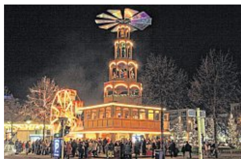
// Die Riesen-Pyramide weist weithin sichtbar den Weg zum Weihnachtsmarkt.