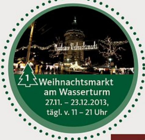
1 Weihnachtsmarkt am Wasserturm 27.11. – 23.12.2013, tägl. v. 11 – 21 Uhr