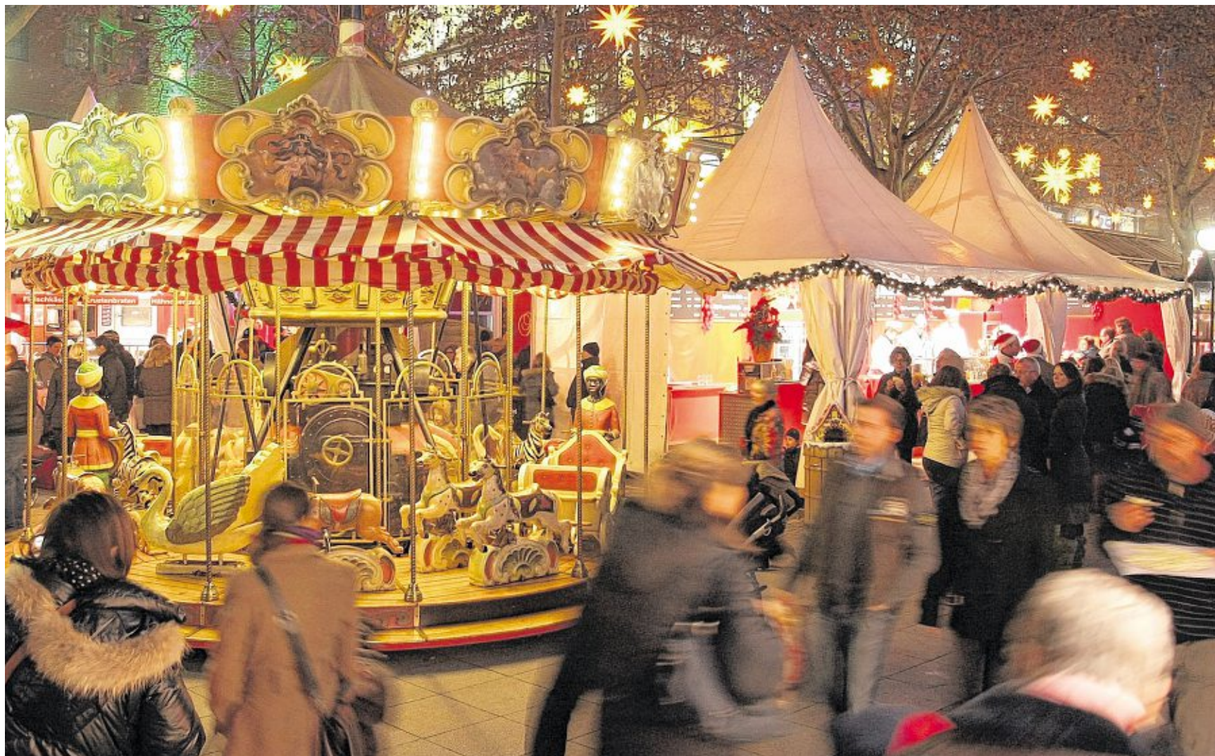
// Klein, aber fein: Der Weihnachtsmarkt auf den Kapuzinerplanken mitten in der City, der von Kunsthandwerkern und kulinarischen Genüssen geprägt ist. Offiziell wird der zweite Mannheimer Weihnachtsmarkt am 27. November um 17.30 Uhr eröffnet. Der Stelzen-Nikolaus schaut am 6. Dezember zwischen 14 und 19 Uhr vorbei.