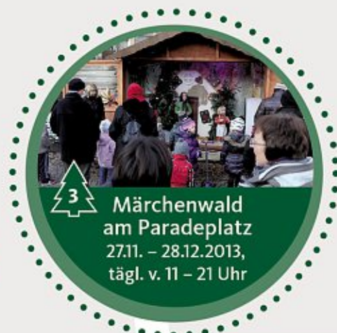
3 Märchenwald am Paradeplatz 27.11. – 28.12.2013, tägl. v. 11 – 21 Uhr