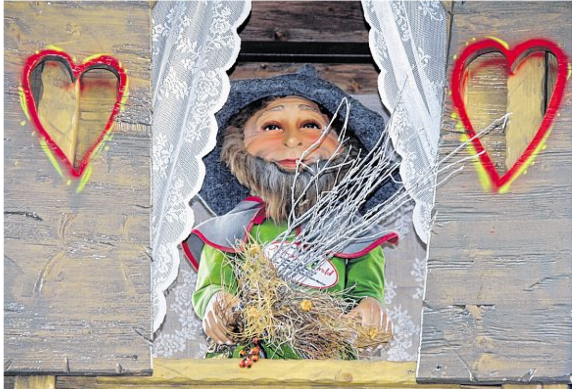
// Zauberhafte Zwerge und weitere bekannte Märchenfiguren bevölkern den Märchenwald.

Darüber hinaus sind attraktive Aktionen geplant. An allen Adventssamstagen (30. November, 7., 14. und 21. Dezember) gibt es als Kooperation zwischen den Veranstaltern des Märchenwaldes, der Werbegemeinschaft Mannheim City und dem Varieté Palazzo um 18 Uhr vor dem Brunnen auf dem Paradeplatz eine halbstündige Show unter dem Motto „Feuer, Flammen, Emotionen“. Teil dieser faszinierenden Darbietung aus Fantasie, Märchen, Walking Acts und Feuerkunst ist Palazzo-Star Freddy Sahin Scholl, auch bekannt aus der TV-Sendung „Das Supertalent“. An den Adventssonntagen treten abwechselnd das ehemalige Mitglied der Söhne Mannheims, Claus Eisenmann, und der „Mannheimer Eros Ramazzotti“, Naro Vitale, auf. Sonntags lockt die Show sodann mit einem Feuerwerk in die Mannheimer Innenstadt. Beginn ist auch hierbei immer um 18 Uhr. Unterstützt durch die Grossmarkt