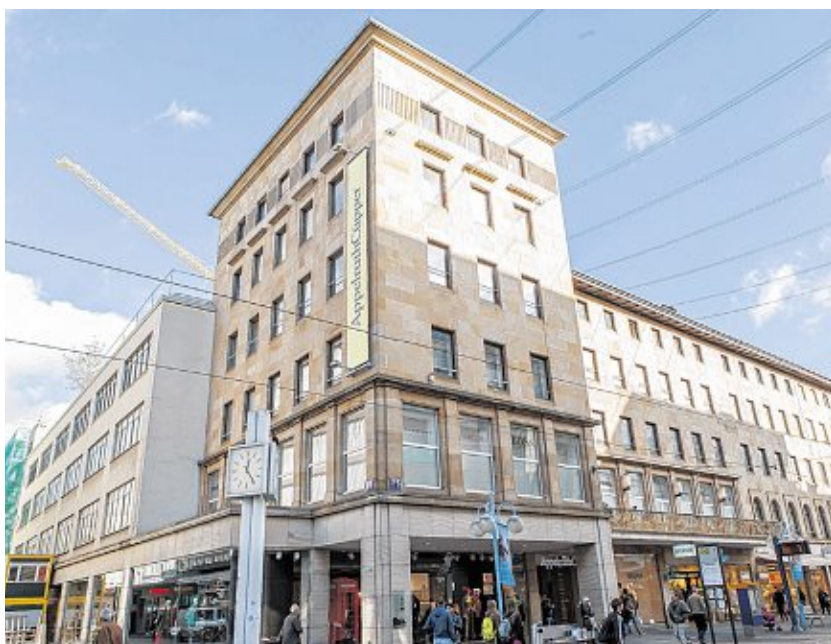
// AppelrathCüpper (P6) baut um.

Am 21. November eröffnet die Drogerie Müller in Mannheim. Auf rund 1960 Quadratmetern Fläche und drei Ebenen bietet Müller ein großes Sortiment mit insgesamt 185 000 verschiedenen Artikeln. Die Abteilungen Drogerie, Naturshop, Parfümerie, Schreib- und Spielwaren punkten nicht nur mit angenehmem Ambiente, fachkundiger Beratung sowie einer großen Auswahl an starken Marken, sondern auch mit dauerhaft günstigen Preisen, bei denen sich das Vergleichen für die Kunden lohnt. Mit der Drogerie begann die Erfolgsgeschichte des Unternehmens. Dort finden Kunden alles rund um Pflege, Gesundheit und Wohlbefinden. Im Naturshop gibt es zusätzlich eine große Markenauswahl von Naturkosmetika, internationalen Kultmarken, natürlicher Babypflege, ausgewählten Accessoires und jeder Menge Geschenkartikeln. Die Parfümerie ist ein Paradies der Düfte und in der Schreibwaren-Abteilung finden Kunden alles für Schule oder Büro, zum Verpacken oder Verschenken, Basteln oder Zeichnen. Im Spielwaren-Bereich schließlich gibt es alles, was das Herz von großen und kleinen Kindern begehrt – darunter sicherlich auch passende Weihnachtsgeschenke.