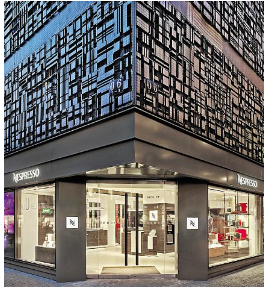
// Die neue Nespresso-Boutique in O6.

Noch mehr Premium-Mode: Die Mannheimer Filiale AppelrathCüpper in P6 baut derzeit seine Ladenfläche um. Bei dieser Gelegenheit wird die Fläche im Erdgeschoss um 170 Quadratmeter vergrößert. Sie wird zur Fressgasse hinaus gehen und einen eigenen Eingang bekommen. Ab Ende November können sich die Kunden hier auf ein besonders vielfältiges Angebot an Accessoires freuen, zudem wird am 29. November der größte Liebeskindshop mit 75 Quadratmetern in Mannheim eröffnet. Im ersten und zweiten Stock werden alle Flächen ebenfalls umgebaut, diese werden etwa ab April 2014 für die Kunden zur Verfügung stehen. Dann verfügt das Haus über insgesamt 3900 Quadratmeter Ladenfläche. AppelrathCüpper bietet Premium-Mode an, spezialisiert auf Damen-Oberbekleidung und Accessoires. Neben den hochwertigen Produkten setzt das Haus vor allem auf umfassende Beratung und kundenorientierten Service.