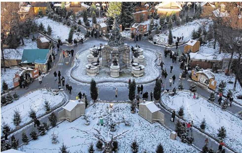
// Zauberhaft: der Märchenwald auf dem Paradeplatz mitten in der City.

WEIHNACHTSZAUBER IN DER MANNHEIMER CITY: Die Innenstadt strahlt, die Einzelhändler verwöhnen ihre Kunden mit besonderen Ideen und Präsenten, die Weihnachtsmärkte, festlich geschmückte Passagen und liebevoll dekorierte Schaufenster machen Lust auf das Advents-Erlebnis in Mannheim.