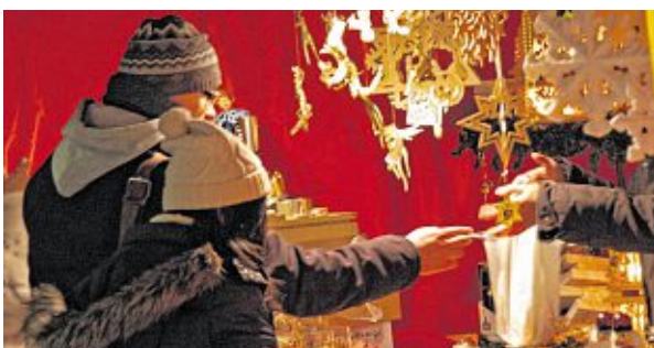
// Kein Weihnachtsmarkt ohne Adventsschmuck und Engel, die gleich scharenweise um den Wasserturm „flattern“.

Eine der größten und schönsten noch erhaltenen Jugendstil-Ensembles Europas bildet die einzigartige Kulisse für leuchtende Hütten und nostalgische Karussells, die nicht nur Kinderherzen höher schlagen lassen. Dass der Mannheimer Weihnachtsmarkt seit Jahren Besucher aus allen Teilen der Republik und dem benachbarten Ausland anzieht, hat gute Gründe, denn er hat sich selbst einen unverwechselbaren Charakter verliehen: Mitmachen lautet die Devise, die Bühne am Wasserturm ist ein tägliches Forum für Freizeitkünstler, Vereine und Schulklassen, die mit Musik, Kleinkunst und weihnachtlichen Weisen die Vorfreude auf das Fest wecken. Wer mit seinen Geschenken doppelt Freude machen will, sollte den Sonderstand „Informieren und Helfen“ ansteuern. Dort verwöhnen gemeinnützige Vereine und Organisationen die Weihnachtsmarkt-Besucher unter anderem mit selbst hergestelltem Gebäck und Marmeladen – der Erlös kommt sozialen Einrichtungen zugute.