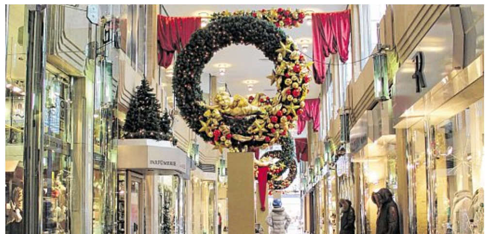
// Die festlich geschmückte Kurfürstenpassage macht Lust auf Weihnachten.

Nicht nur Mannheims Straßen leuchten im Advent im Lichterglanz. Wie jedes Jahr wird auch die Kurfürstenpassage festlich und aufwendig geschmückt – wer genau wissen will, wie es aussehen wird, muss sich allerdings überraschen lassen. Fest steht schon: An allen vier Adventssamstagen gibt es in der Passage Aktionsstände – etwa ein Fotograf, der weihnachtliche Fotos macht – sowie der Verkauf von Glühwein, Punsch und Waffeln. So kommt auch in der edlen Mannheimer Einkaufspassage festliche Stimmung auf.