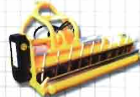
TRITURADORA DE MARTILLOS O CUCHILLAS