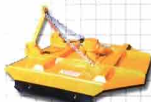
DESBROZADORAS FORESTALES Y AGRÍCOLAS