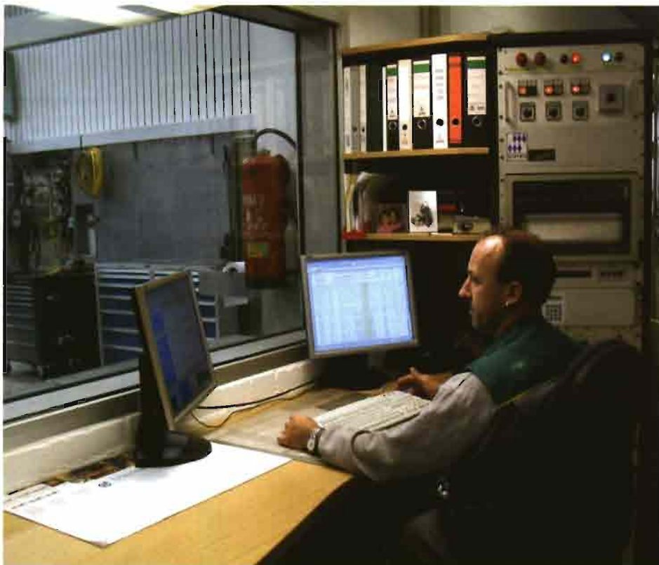
Fendt es una de las marcas que destaca por ofrecer tecnología de vanguardia.