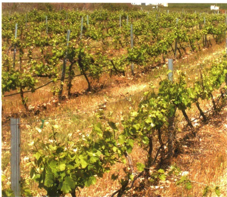
Podemos dejar la flora espontánea o sembrar una cubierta vegetal que además haga de abono verde

En épocas de recolección, gracias a su potencial de transpiración, eliminará el exceso de humedad después de una lluvia otoñal o de finales de verano evitando la peligrosa aparición de podredumbres.