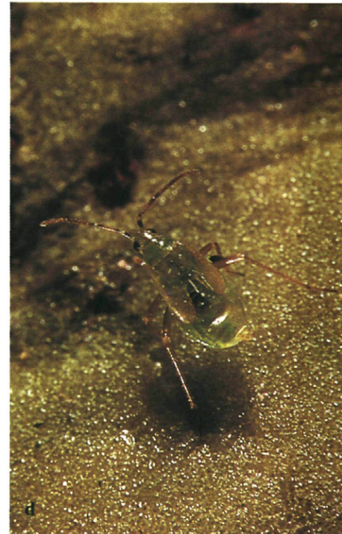
Fig. 4.—Ninfas de los géneros de Dicyphinae hallados en el tomate en Cataluña. (Fotos de A. Masó).