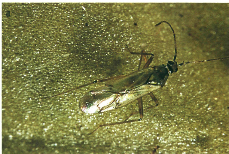
Fig. 3.—Adultos de los géneros de Dicyphinae hallados en el tomate en Cataluña.