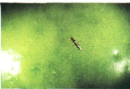
Fig. 1.—Adulto de Dicyphus tamaninii a tamaño real sobre fruto de tomate, decolorado por las picaduras. (Foto de A. Masó).

Hay que tener en cuenta que las descripciones corresponden a observaciones bajo la lupa, puesto que el pequeño tamaño de estos míridos no permite observar a simple vista muchos de los detalles que se señalan (Figura 1).