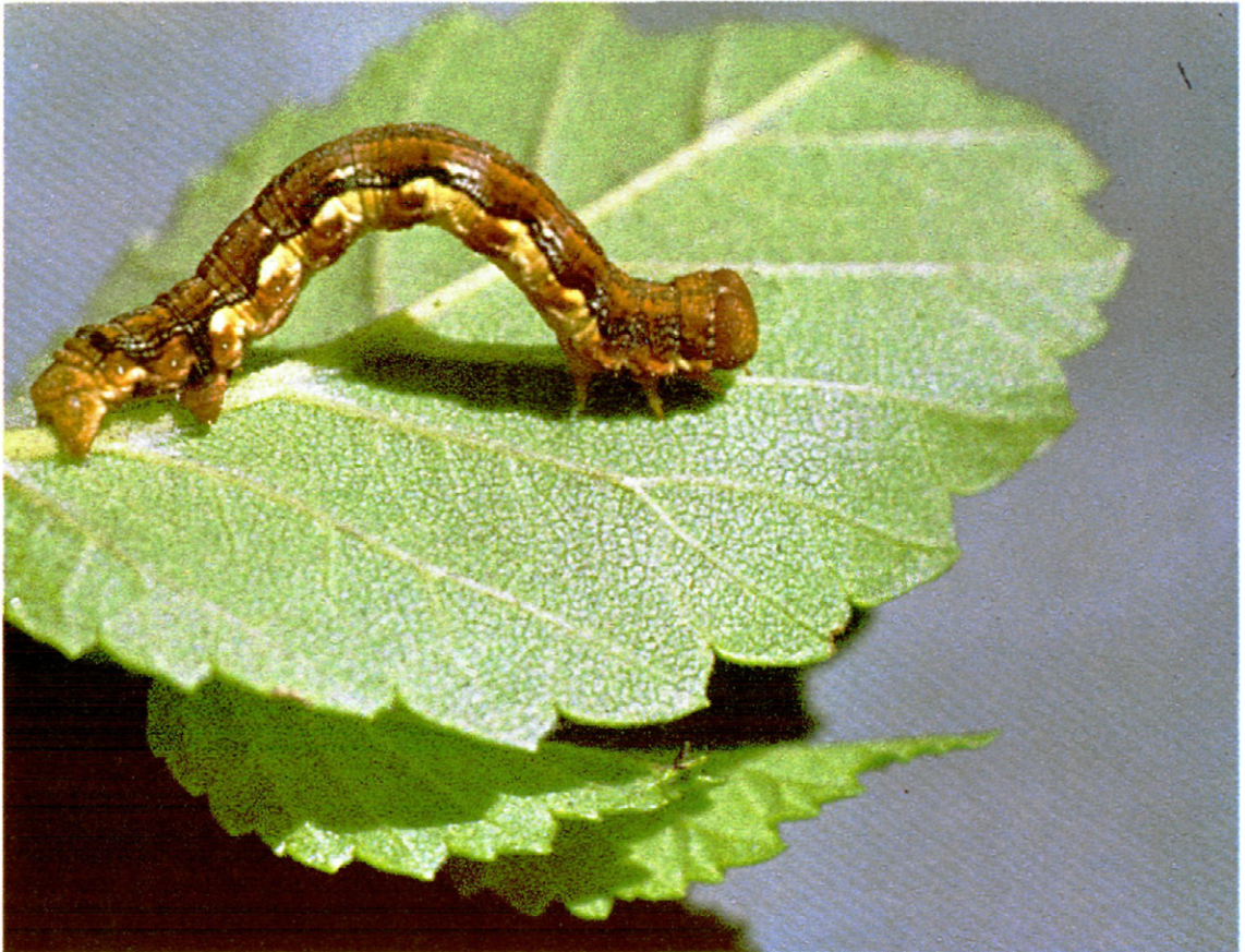
Fig. 8.—Oruga de Erannis defoliaria Clerck., sobre olmo.

Crisálida. —Realiza la crisalidación, enterrada en el suelo, o entre la hojarasca o el musgo; según la mayoría de los auto-