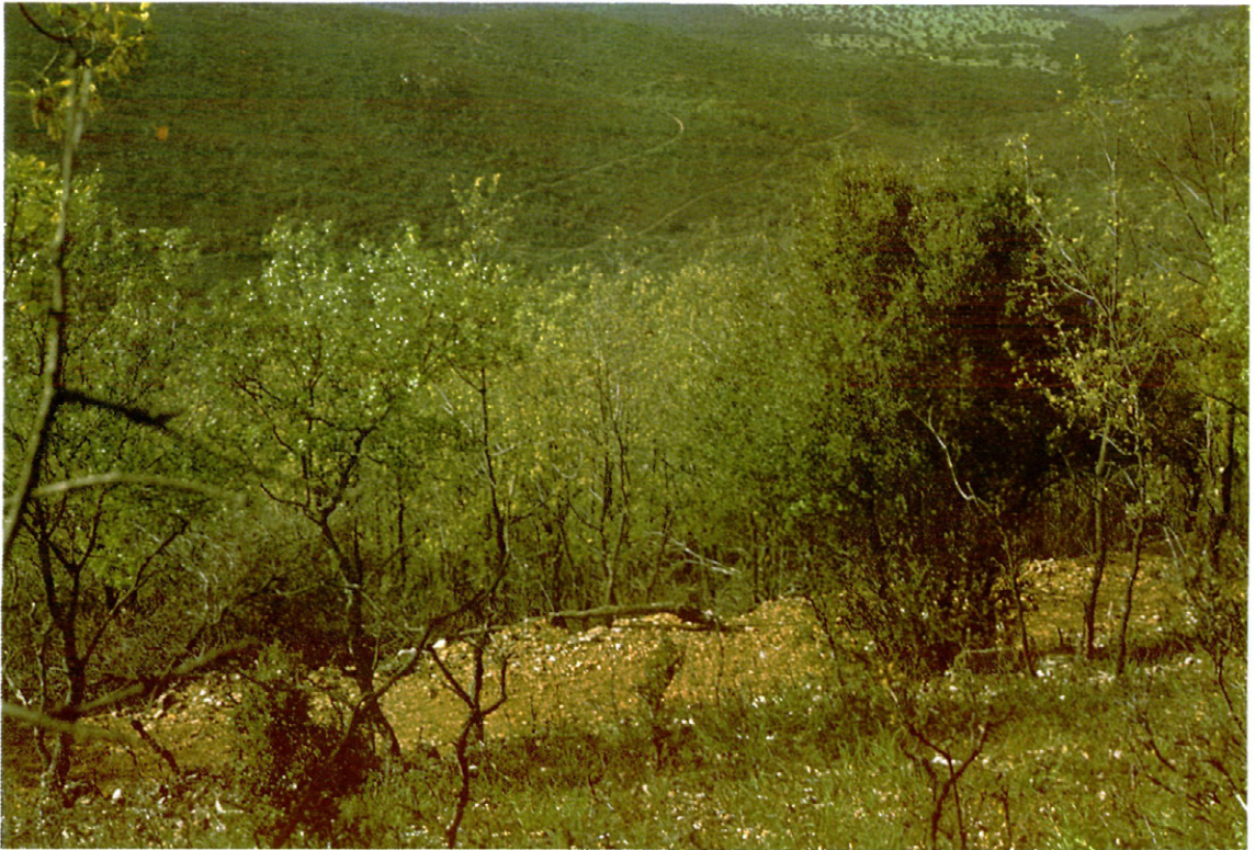
Fig. 2. —Detalle de la zona tratada.

mente todos los autores coinciden, ya que la época de avivamiento de la mariposa es muy tardía; cuando la gran mayoría de los insectos se encuentran en la forma en que pasarán el invierno: octubre-noviembre (BREHM, 1880); principios de invierno (SALA de CASTELLARNAU, 1945); mitad de septiembre a principios de enero, y febrero y marzo (FORSTER y WOHLFART, 1973); otoño, principios de invierno (CEBALLOS, 1974); finales de septiembre a primeros de octubre (BONNEMAISON, 1976); etc. Las orugas nacen a principios de primavera y crisalida en junio o julio, poseyendo, por tanto, una sola generación anual.