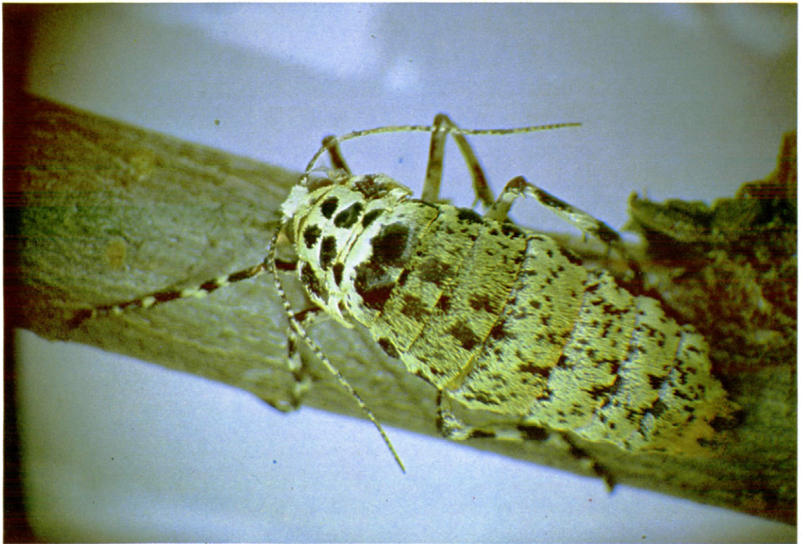
Fig. 5. — Hembra de Erannis defoliaria Clerck.