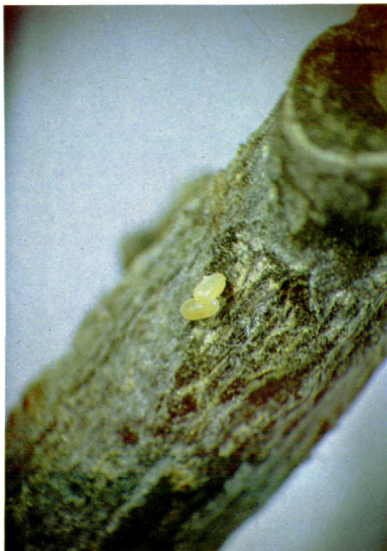
Fig. 6.—Puesta de Erannis defoliaria Clerck.

Oruga. —Pasa por 5 estadios larvales, alcanzado en el momento de la crisalidación unos 30-35 mm. de longitud.