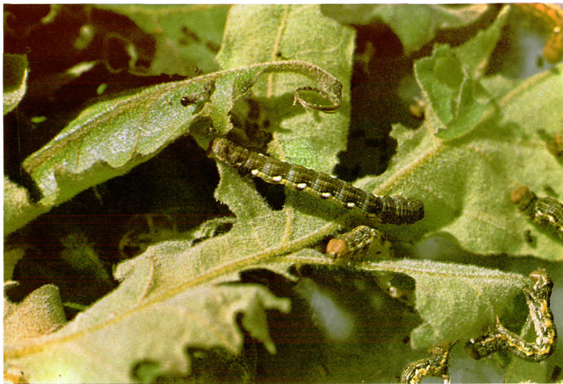
Fig. 9. — Orugas de Erannis defoliaria Clerck., sobre rebollo.

Las hembras, ápteras, trepan a las ramas de los árboles, donde son fecunda-