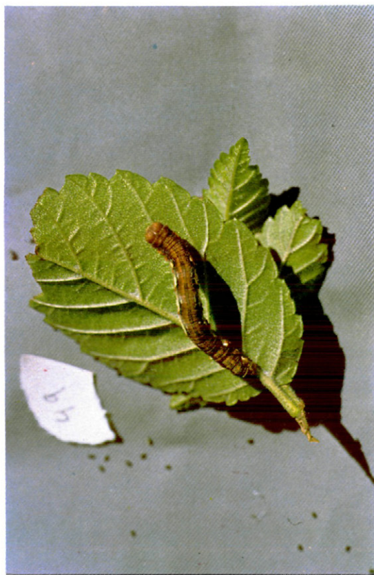
Fig. 7.—Oruga de Erannis defoliaria Clerck., sobre olmo.

Es en éste estadio cuando la oruga adquiere su tonalidad definitiva, que es muy variable de unos individuos a otros; dorsalmente presenta dos líneas oscuras, formadas por puntos, muy finos y negros. Posee una serie de puntos de igual color salteados sobre el fondo, que es castaño, castaño oscuro o rojizo. Tiene tres líneas dorso-laterales igualmente formadas por puntos negros, si bien la tercera de ellas