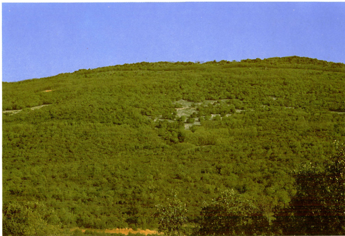
Fig. 1. — Vista General de la zona tratada.