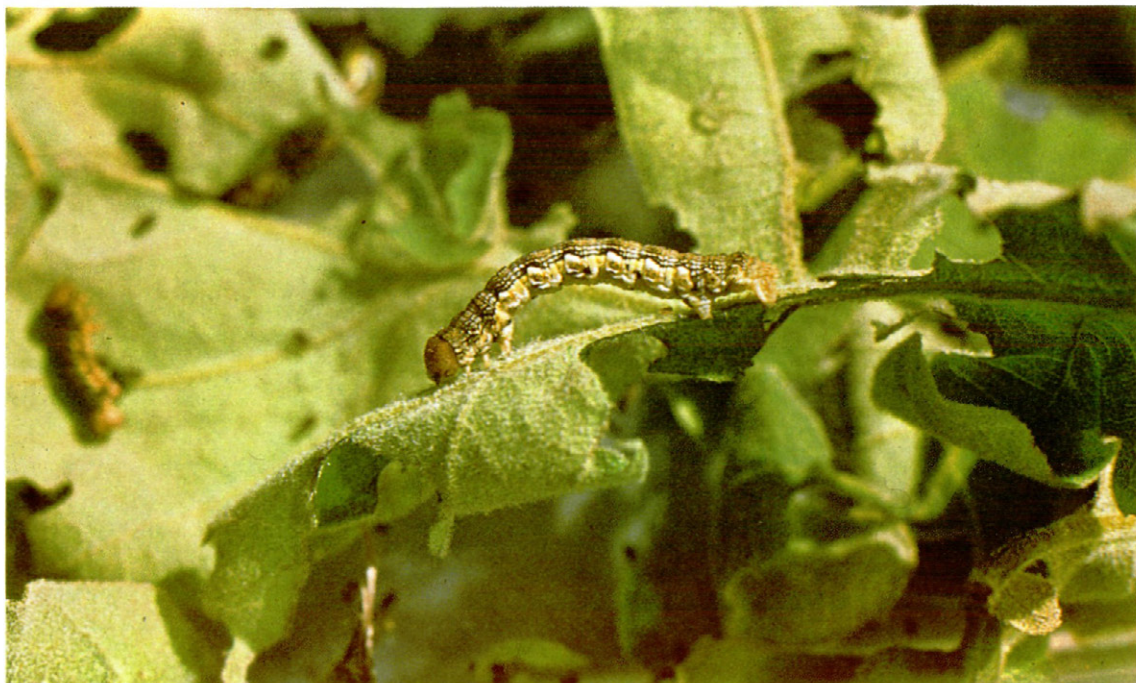
Fig. 10.—Oruga de Erannis defoliaria Clerck., sobre rebollo.