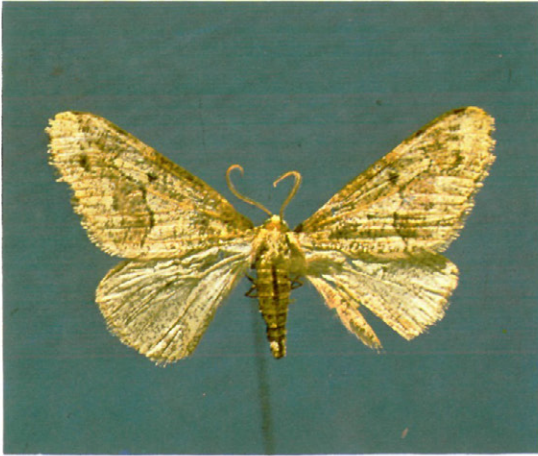
Fig. 4. — Macho de Erannis defoliaria Clerck.