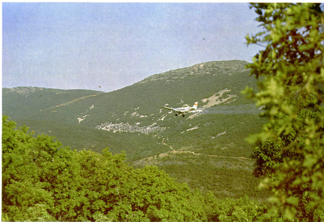
Fig. 3.—Ensayo con líquido.

Los productos utilizados fueron: diflubenzuron 45 (Dimilin) a 56,25 gr. de m.a./ha., en 5 l. de gasoil. Decametrín (Decis) a 2,5 gr. de m.a./ha. y 5 gr. de m.a./ha. en 2 l. de gasoil; y carbaril 1 por 100 + malation 3 por 100 en polvo, a 17 kg/ha.