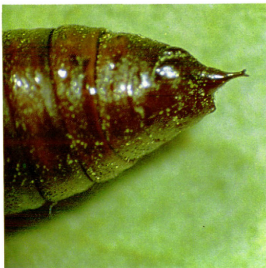
Fig. 11.—Cremaster de la crisálida de E. defoliaria Clerck.