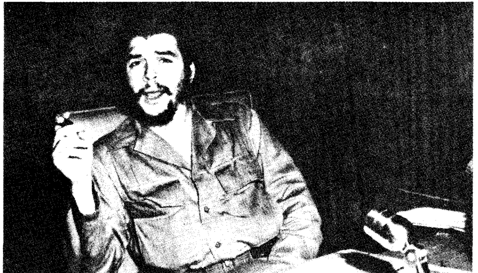
Che Guevara auf einer Pressekonferenz in Havanna, Oktober 1960.

nen castroistischen Bewegung schnell vorangeschritten. Schon im Juli 1959 hatte Präsident Urrutia eine Regierungskrise provoziert, indem er die PSP und den Kommunismus denunzierte; fast zur selben Zeit forderte der Oberkommandierende der Luftwaffe, Diaz Lanz, Verteidigungsminister Raúl Castro auf, die Kommunisten aus den Streitkräften zu entfernen. Diaz flüchtete bald darauf in die USA, Urrutia trat zurück und wurde von Osvaldo Dorticós ersetzt. Im Oktober versuchte der Kommandierende der Streitkräfte in der Provinz Camagüey, Hubert Matos, zusammen mit zwei Dutzend seiner Offiziere eine regionale Rebellion zu organisieren, wurde jedoch schnell überwältigt und verhaftet.