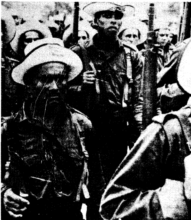
Links: Kubanische Arbeitermiliz während der frühen 60er Jahre. Seite 6: Hauptquartier von Radio Rebelde in der Sierra Maestra.

Inzwischen war die Polarisierung innerhalb der heteroge-