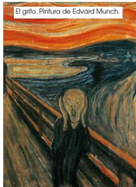
El grito. Pintura de Edvard Munch.