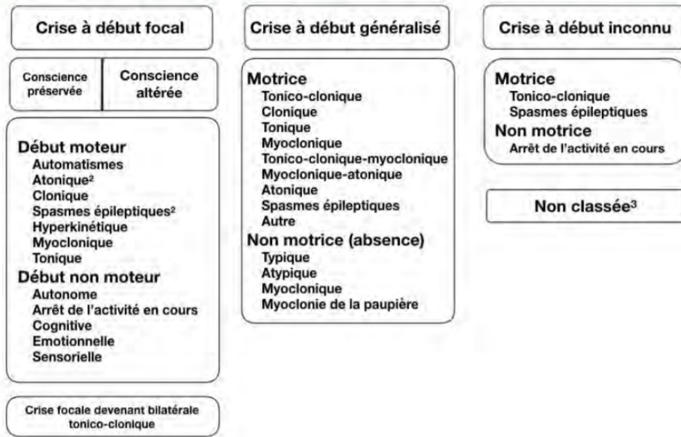
Figure n°1: classification des crises épileptiques (Scheffer I, Epilepsia 2017)