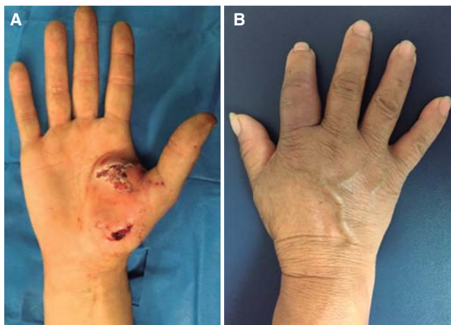
Figura 6. A. Mordedura de perro. B. Mordedura de gato.

lesión más proximal en el tendón y cápsula articular. Deben solicitarse siempre radiografías para descartar fracturas. 19