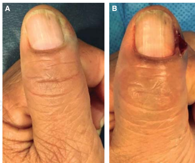
Figura 1. A. Paroniquia aguda. B. Drenaje de absceso.

El tratamiento consiste en realizar descompresión quirúrgica con extirpación minuciosa del tejido necrótico, además de antibióticos y ferulización. La herida debe de-