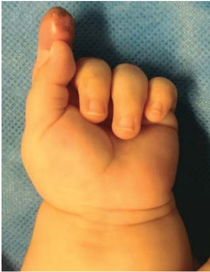
Figura 2. Panadizo en paciente pediátrico.

jarse abierta de dos a cinco días para favorecer el drenaje de todo el material purulento restante. 3,5