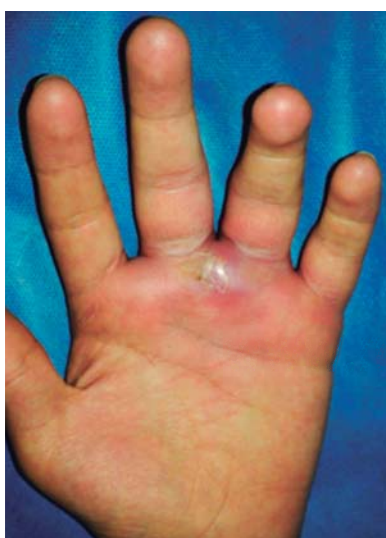
Figura 5. Absceso en botón de camisa/interdigital.

Se aprecia dolor y tumefacción en el espacio interdigital. La tumefacción es mayor en la cara dorsal, aunque no debe pasarse por alto el componente volar más importante de la infección. El signo clínico diferencial es la "abducción de