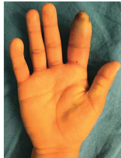
Figura 3. Imagen clínica de un paciente con tenosinovitis con presencia de tumefacción fusiforme.

La intervención quirúrgica es necesaria en la mayoría de los casos, la cual consiste en realizar un abordaje para exposición distal y proximal de la vaina tendinosa y su irrigación, con un abordaje con incisión medio-lateral en el dedo infectado o una incisión transversal distal, inmediatamente proximal al pliegue de la articulación interfalángica distal, haciendo la apertura de la vaina tendinosa a ese nivel y posteriormente una segunda incisión transversal en la región distal, proximal a la polea A1, con posterior colocación de la sonda de irrigación (Figura 4). 13,14