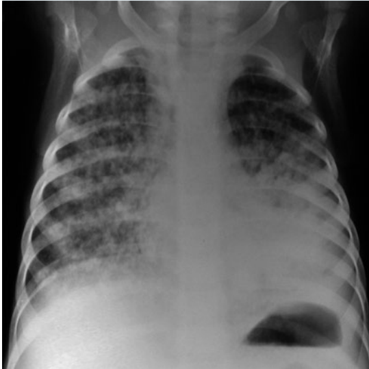
Figura 3. Radiografía de tórax de masculino de 22 meses con infección ganglionar por Mycobacterium tuberculosis , en la cual se observa infiltrado miliar bilateral. Tomado de: Artega R, Pantoja M. Tuberculosis Ganglionar y Miliar. Rev. Soc. Bol. Ped. 2002; 41 (2) bajo licencia CC BY-NC 4.0