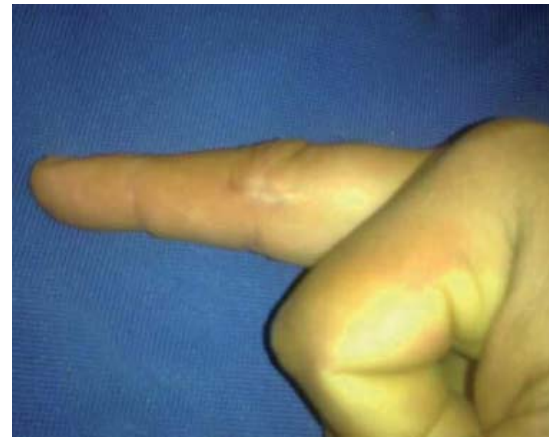
Figura 6. Resolución completa del cuadro infeccioso sin secuelas a un año de seguimiento.

lisis histopatológico reportó tejido de granulación con inflamación granulomatosa crónica de tipo cuerpo extraño. La tinción de Gram fue negativa. La tinción de Ziehl-Neelsen fue positiva para bacilos ácido-alcohol-resistentes. Se solicitó cultivo de Lowenstein-Jensen con resultado positivo para crecimiento de micobacterias y se envió muestra a reacción en cadena de la polimerasa (PCR) para tipificar. Posteriormente la PCR y secuencia de microarreglo del ADN arrojaron un resultado positivo para Mycobacterium marinum . El antibiograma demostró sensibilidad a estreptomycin, isoniazida, rifampicina, etambutol y pirazinamida. Actualmente el paciente se encuentra en observación después de completar un tratamiento por seis meses con claritromicina, etambutol y rifampicina, con adecuada evolución. El seguimiento a un año no ha mostrado recurrencia de la infección, y el paciente no presenta secuelas funcionales en el dedo afectado (Figuras 5 y 6).