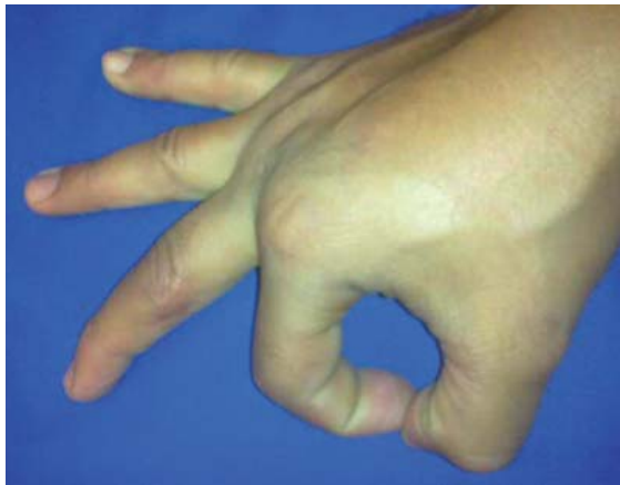
Figura 5. Resolución completa del cuadro infeccioso sin secuelas a un año de seguimiento.