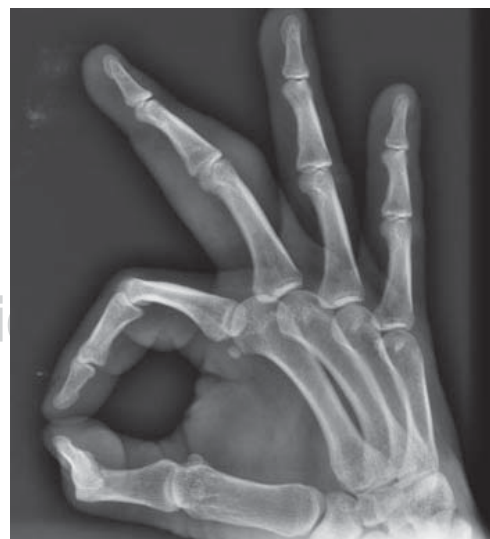
Figura 3. Radiografía simple oblicua de la mano derecha con edema de los tejidos blandos del dedo afectado, sin datos de patología ósea o intraarticular.