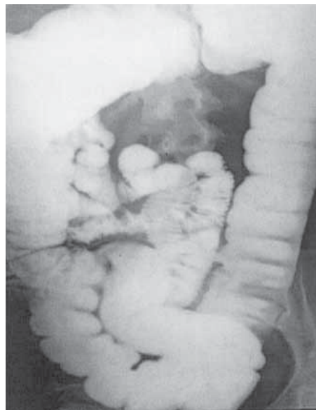
Figura 1. Colon por enema que muestra dolicosigmoide.

Segmento de colon de 18 x 2.6 x 2.4 cm, con superficie de manera normal, con tejido adiposo adherido; al corte, mucosa café claro con zonas rosa claro y áreas congestivas, pliegues parcialmente aplanados, sin lesión macroscópica; al corte histológico, sin datos patológicos.