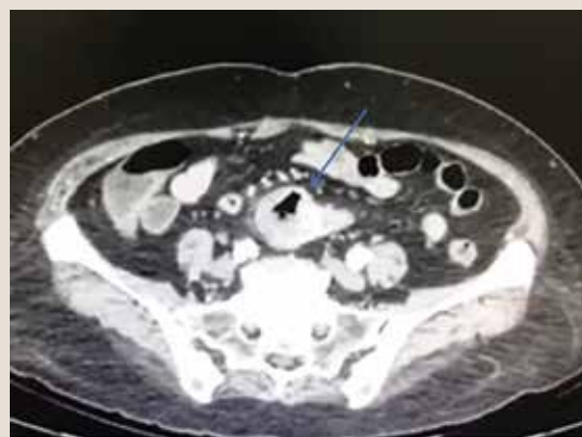
Figura 1. Tomografía abdominal con contraste intravenoso que muestra una imagen sacular en línea media con gas en su interior en íleon distal, pared 18 mm con reforzamiento en fase arterial y venosa

La pieza quirúrgica fue enviada a patología para su análisis, donde reportaron un segmento de intes-