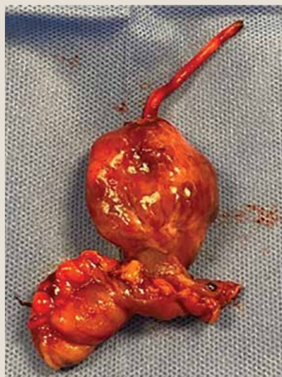
Figura 2. Imagen sacular dependiente del borde antimesentérico en íleon terminal de aproximadamente 4 × 3 cm, adyacente a conducto onfalomesentérico, con recubrimiento de natas fibrinopurulentas