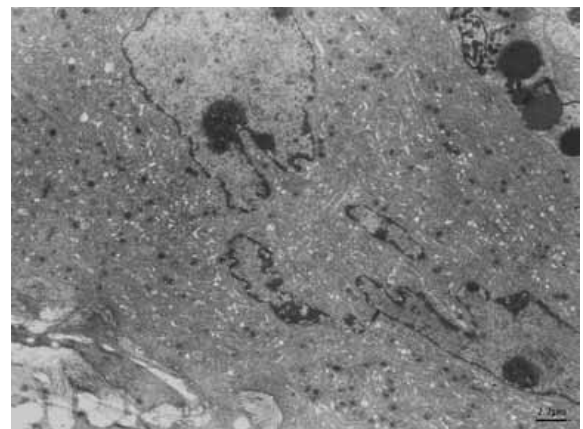
Figura 1. Ultraestructura de un megacariocito maduro. Se observa su núcleo y citoplasma muy granular, así como los canales de demarcación que darán lugar a las pro plaquetas. Médula ósea de ratón. Micrografía electrónica de transmisión.

El megacariocito deriva de una célula de la médula ósea llamada célula troncal hematopoyética, la cual tiene la capacidad de autorrenovarse, es multipotencial y se ha encontrado que en su superficie expresa antígenos como CD34, CD90, CD117 y CD133 y carece de la expresión de antígenos de linajes específicos. Estas células dan origen a células progenitoras hematopoyéticas que pierden la capacidad de renovación, pero siguen conservando su multipotencialidad, bipotencialidad o monopotencialidad, según sea el caso, puesto que si bien aún conservan el antígeno CD34, ya expresan antígenos del linaje al cual darán origen. La célula