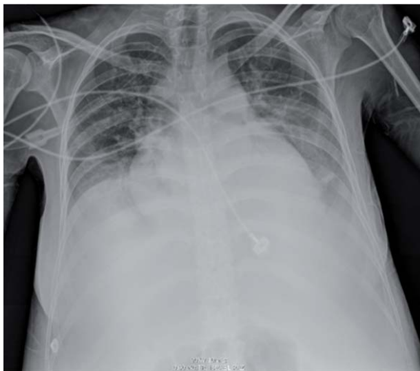
Figura 1. Radiografía de tórax en donde se observa derrame pleural izquierdo, abombamiento de la arteria pulmonar y cardiomegalia.

En la anemia, la capacidad de transporte de O_2 disminuye pero la oxigenación tisular se conserva por diversos mecanismos compensadores. 1 El descen-