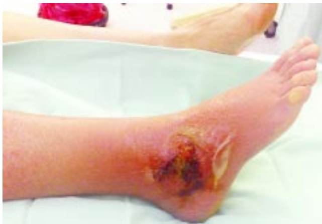
Figura 1. Obsérvese: edema de la extremidad, área de necrosis (úlceras) y celulitis circundante.

Se llevó a cabo drenaje y desbridación quirúrgica extensa de la lesión con toma de cultivos y tejido para patología, encontrando conejeras con pus en su interior ( Figura 2 ). Al día siguiente se inició tromboprolifaxis con enoxaparina 40 mg subcutáneos cada 24 horas, continuándose por cinco semanas. Los cultivos mostraron la presencia de E. cloacae y S. aureus sensibles a meticilina y ertapenem. En los días cuarto y octavo se realizaron lavados quirúrgicos, más colocación de catéter de Hickman 9.6 Fr. para antibioticoterapia intravenosa ambulatoria (ertapenem por un total de cuatro semanas). Evolucionó satisfactoriamente, por lo que egresó al décimo día. El diagnóstico histopatológico fue dermato-