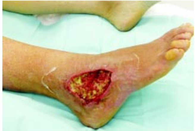
Figura 2. Imagen post-desbridación inmediata.

sis ulcerada con hiperplasia pseudoepiteliomatosa, cambios regenerativos de la epidermis basal, infiltrado inflamatorio mixto y necrosis de licuefacción extensa en relación con vasculitis secundaria, trombosis reciente y organizada, consistente con aracnoidismo dermonecrosante ( Figura 3 ). La paciente reingresó dos días después para aplicación de injerto cutáneo de espesor parcial, con excelente integración y cicatrización.