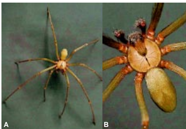
Figura 4. (A y B) Loxosceles reclusa , “araña violinista”.

El veneno que libera la mordedura de las arañas del género Loxosceles contiene varias enzimas: fosfatasa alcalina, 5-ribonucleótido fosfohidrolasa, esterasa, hialuronidasa y la más importante por sus efectos patógenos, la esfingomielinasa D2. Esta última tiene mayor actividad a 37 °C, degrada la esfingomielina a colina y N -acilesfingosina, y es responsable de la lisis eritrocitaria mediada por calcio, además produce agregación plaquetaria y trombosis, así como dolor por desmielinización de los nervios periféricos y lesión a las células endoteliales mediada por neutrófilos con isquemia y necrosis concomitantes. 6-8