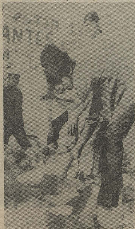
■ EN EL BAÑO se forja la unidad poblador-estudiantil.

Creo estar contestando, en parte a tu pregunta. Decíamos antes que las organizaciones juveniles (FECH, CUT, Federaciones Campesinas, etc.), habían adquirido un compromiso con el