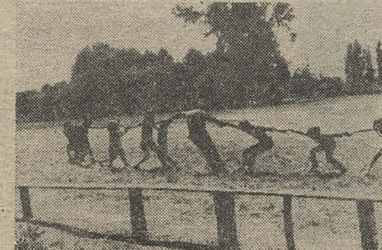
Los juegos son parte de la enseñanza.

Es importante recalcar que el proceso histórico que está viviendo Chile en estos momentos requiere que el número de jóvenes conscientes de