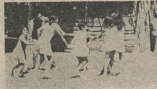
Lo primero es familiarizarse con los niños

La real participación de todas las Federaciones Estudiantiles del país, de las Juventudes Po-