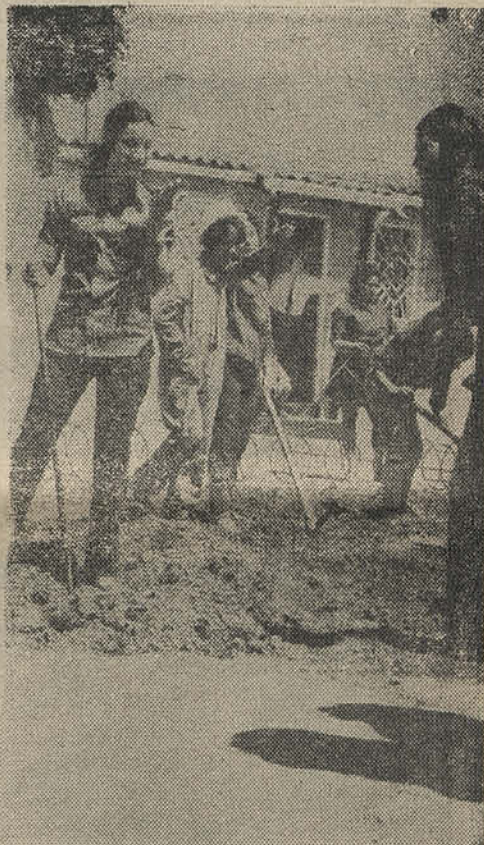
■ ¡PERO LA PLAZA de todas maneras VA!

Pero el descanso, merecido por cierto, no es eterno. Con renovados bríos se vuelve a la carga.