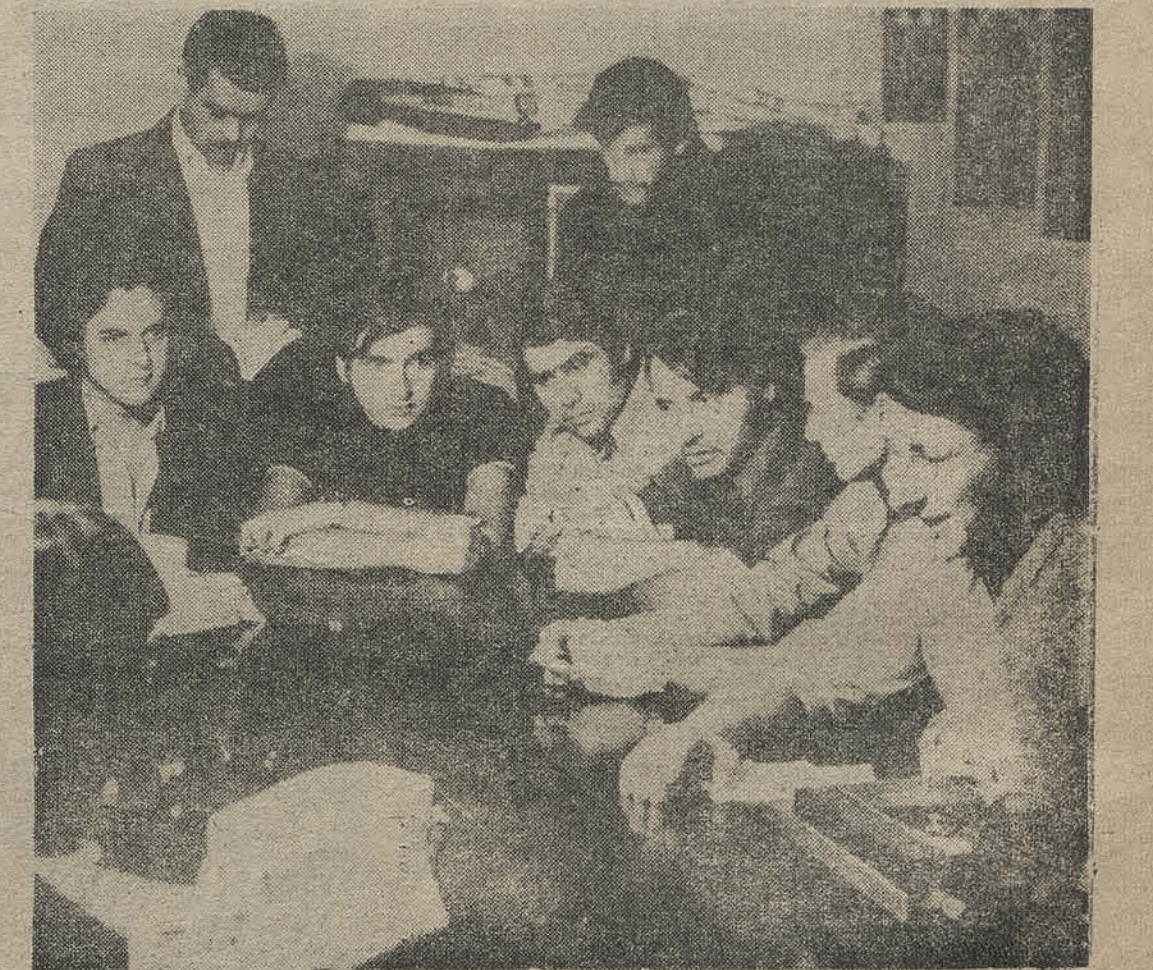
LOS CANTANTES populares se integran a la discusión y puesta en marcha de los Trabajos de Verano.