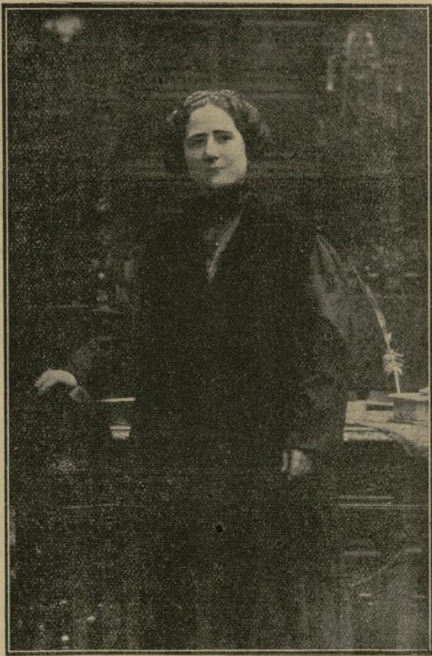
LA SEÑORITA CLARA CAMPOAMOR, ILUSTRE DOCTORA EN DERECHO, PRIMERA MUJER QUE EN ESPAÑA HA INFORMADO EN EL SUPREMO, CON GRAN EXITO. LA SEÑORITA CAMPOAMOR ES LA ABOGADA DE LA «CASA DE LA MUJER», DONDE ABRIRÁ EN BREVE UNA CONSULTA JURIDICA PARA SUS ASOCIADAS Y LAS SUSCRITORAS DE LA VOZ DE LA MUJER

El público tenía fija, en ella, la mirada de curiosidad. Comenzó a hablar con dicción pura y correcta, serena, persuasiva, razonando hechos, desvaneciendo